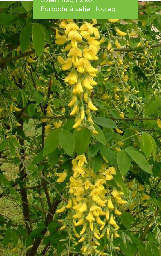
Gullregn / Alpegullregn

SVARTELISTESTATUS: Svært høg risiko. Forbode å selje i Noreg