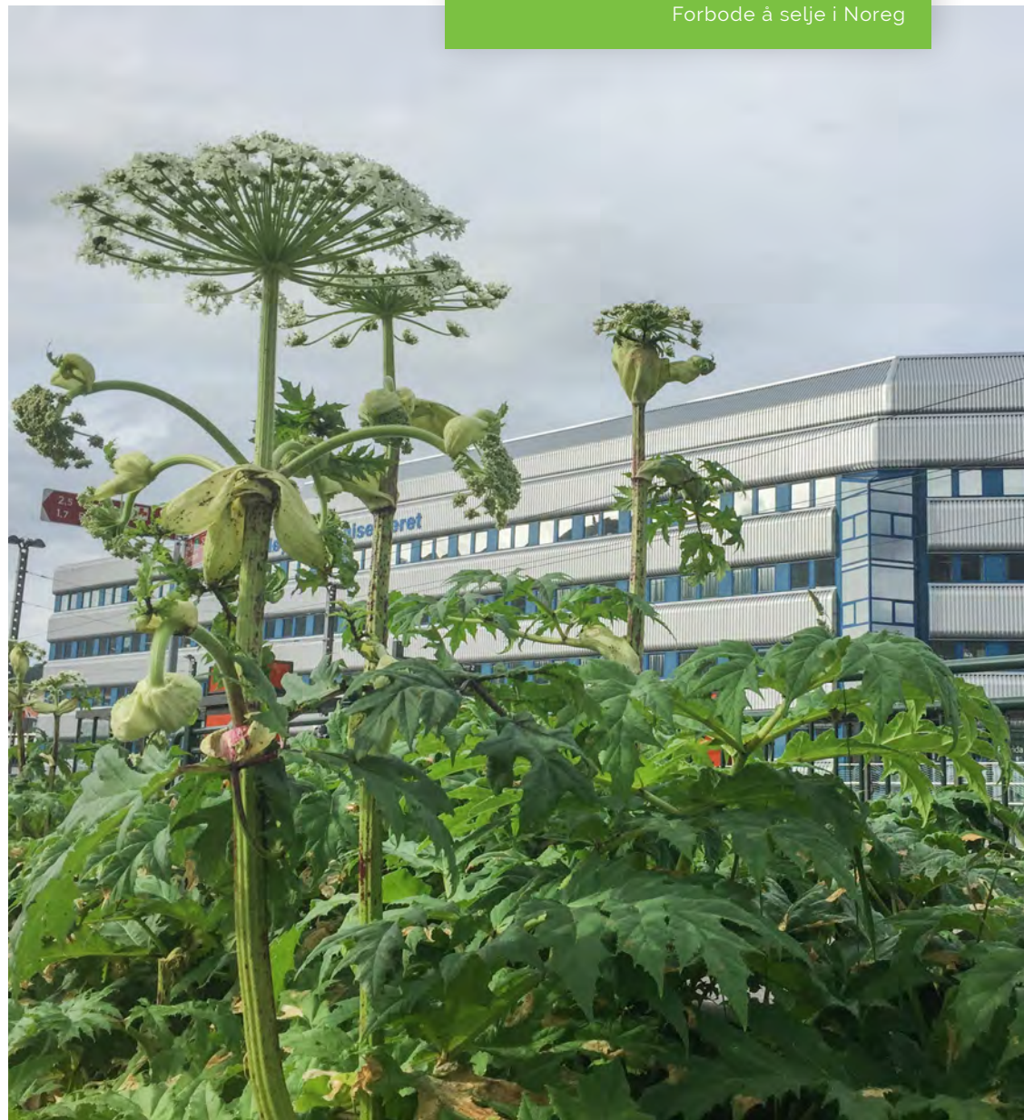
Kjempebjørnekjeks ved bybanestoppet Florida i Bergen.

SVARTELISTESTATUS: Svært høg risiko. Forbode å selje i Noreg