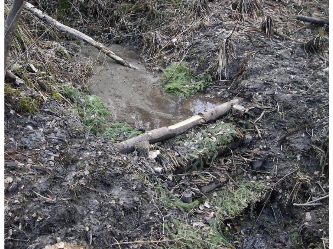
Kvistdam fylt med sediment