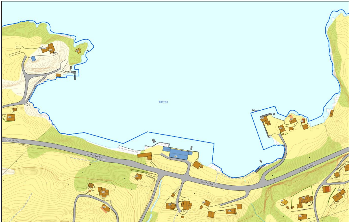
Detaljkart for Eidevik: