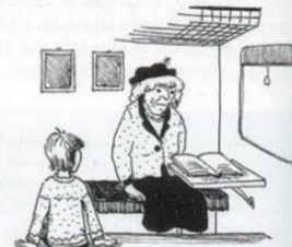
Frk. A. som lille Svend ser henne