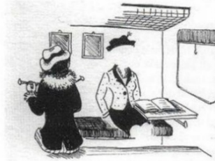
Frk. A. som frk. B ser henne