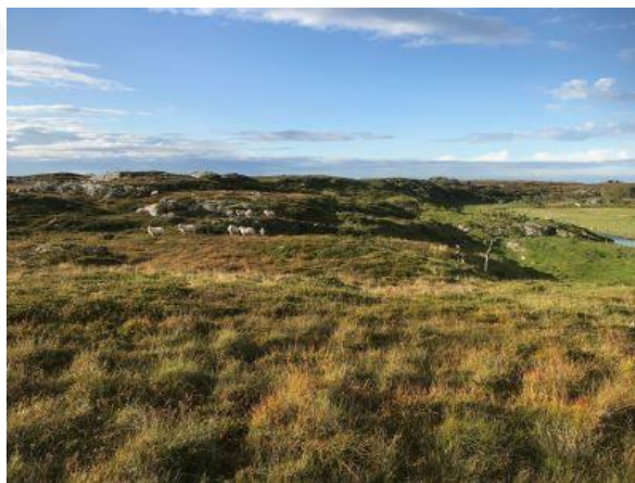
Sau på beite på Husøya på Tarva.

11.30 Lunsj og Innsjekk Ørland kysthotell .