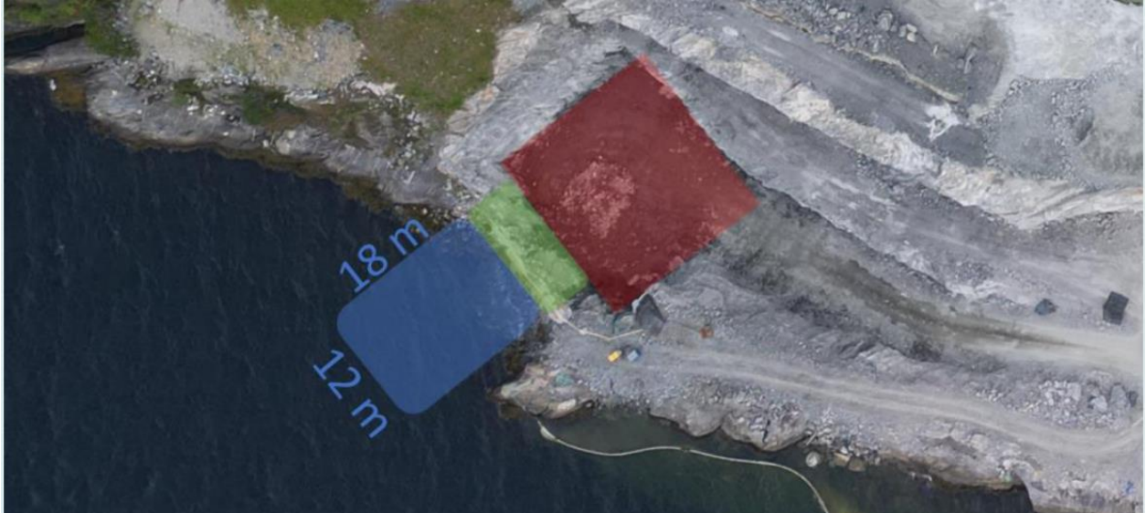
Figur 2. Raudt kvadrat viser kammer som allereie er sprengt, og går ned om lag -10 meter. Blått kvadrat viser flaten som denne søknaden omfattar. Den skal sprengast ned til -12 meter for så å etablere ei flate på -10 meter der det skal etablerast infrastruktur knutt til utslippssystemet. For å knyte det raudte og det blå området saman, skal det grønne arealet også sprengast ut.

Føremålet med tiltaka er å etablere området for sikker og effektiv tilgang til avgangssystemet med rørføringar, som er ein viktig del av mineralprosesseringsanlegget på Engebø. Avgangssystemet med metodikk for å minimere partikkelspreiing er ein del av godkjent utslippsløype og avfallshandteringsplan frå Miljødirektoratet.