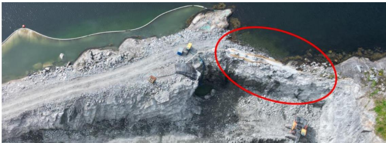
Figur 1. Dronebilette over tiltaksområdet og illustrasjon av fjellmassane som skal sprengast.

Engebø Rutile and Garnet AS søker om løyve etter forureiningslova til tiltak i sjø ved gnr./bnr. 431/3, 431/6, og 431/10 i Sunnfjord kommune. Tiltaka i sjø er ifølge tiltakshavar i samsvar med gjeldande 1 reguleringsplan for området.