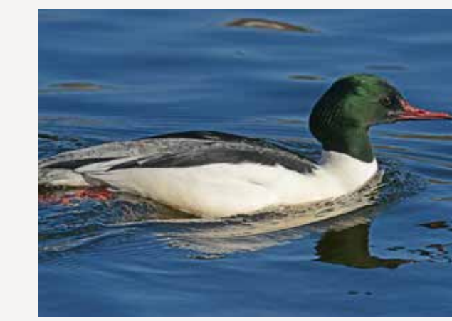
Laksand Goosander Mergus merganser