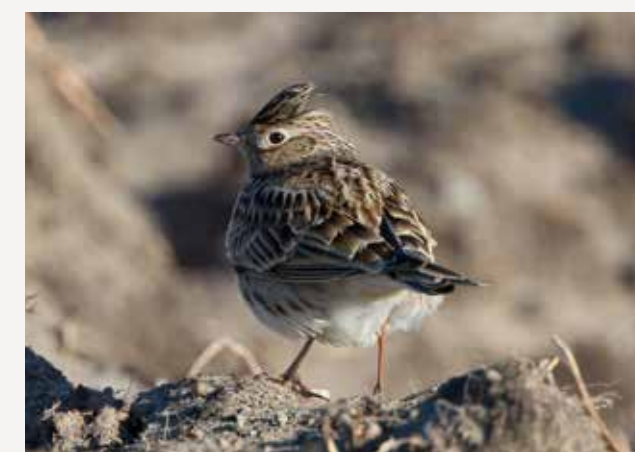
Sanglerke Skylark Alauda arvensis