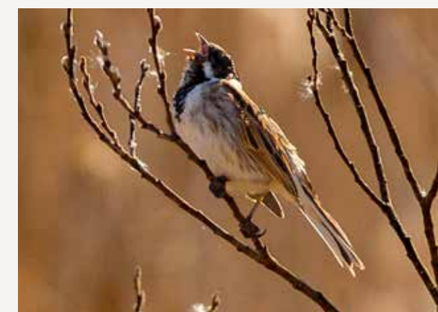
Sivspurv Reed bunting Emberiza schoeniclus