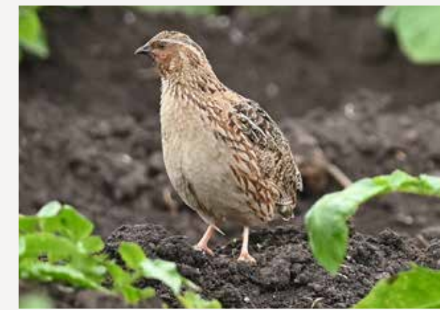
Vaktel Common ringed plover Charadrius hiaticula