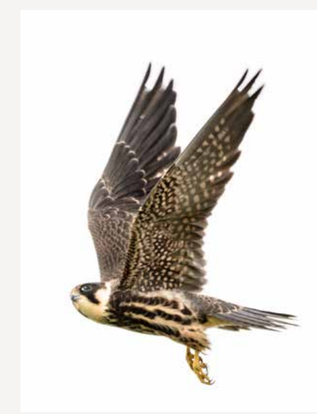
Lerkefalk Eurasian hobby Falco subbuteo