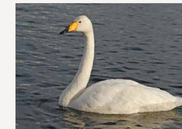
Sangsvane Whooper swan Cygnus cygnus