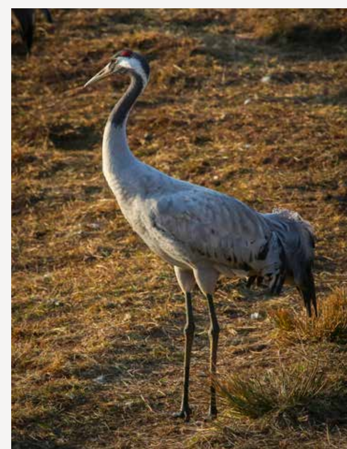
Trane Common crane Grus grus