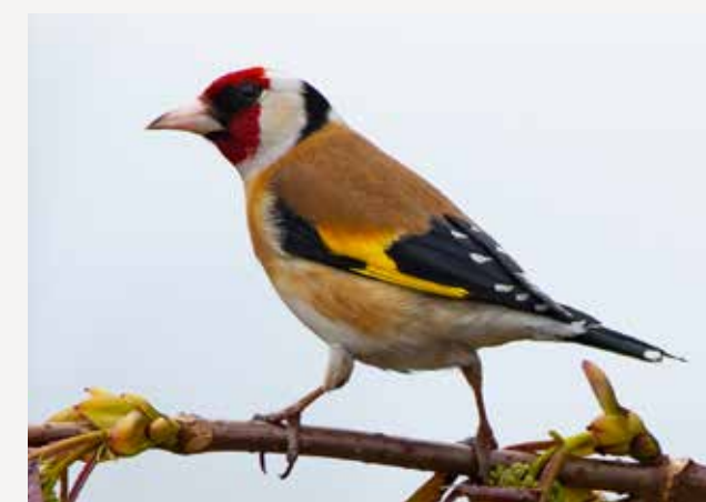
Stillits European goldfinch Carduelis carduelis