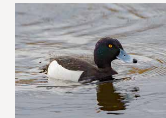
Toppand Tufted duck Aythya fuligula