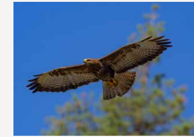
Musvåk Common buzzard Buteo buteo