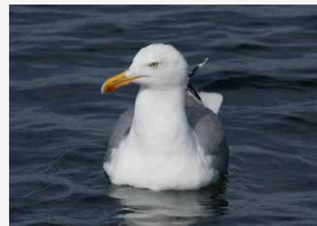
Gråmåke European herring gull Larus argentatus