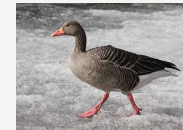
Grågås Greylag goose Anser anser