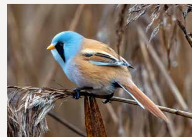
Skjeggmeis Bearded reedling Panurus biarmicus