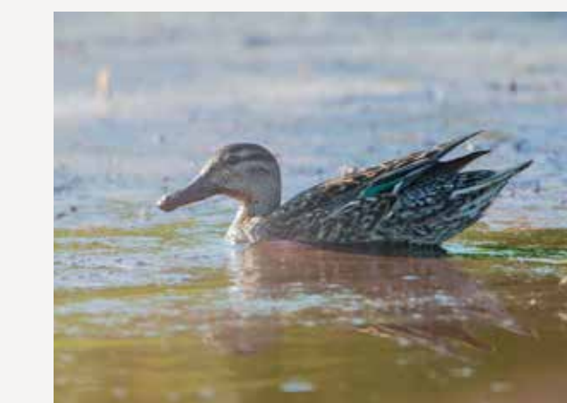
Krikkand Eurasian teal Anas crecca