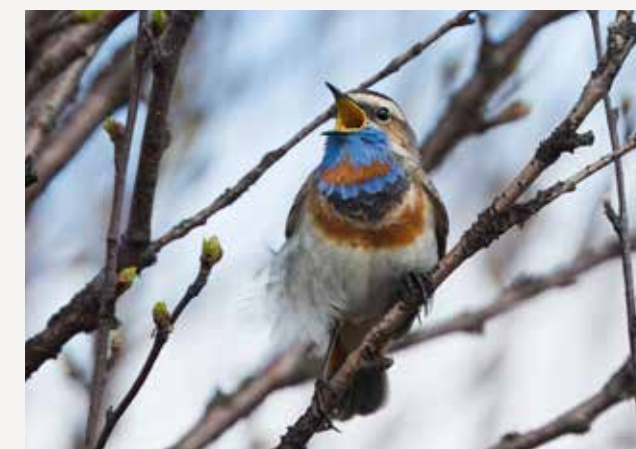
Blåstrupe Bluethroat Luscinia svecica