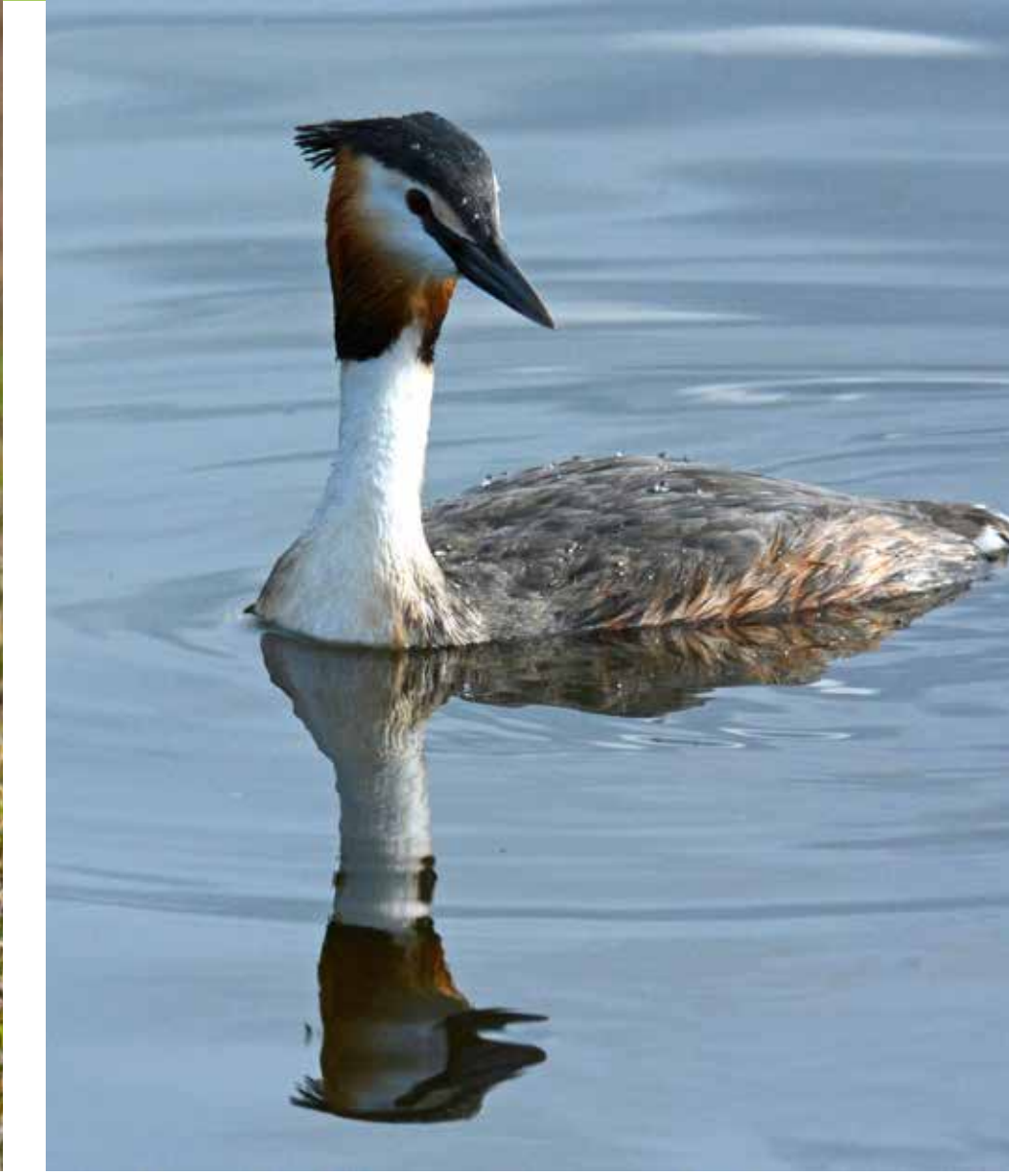
Toppdykker Great crested grebe Podiceps cristatus