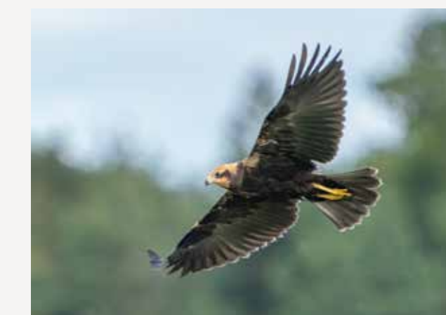
Sivhauk Western marsh harrier Circus aeruginosus