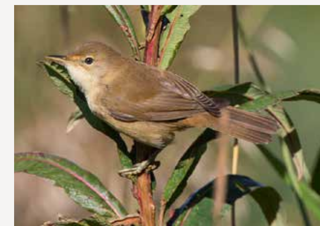
Myrsanger Marsh warbler Acrocephalus palustris