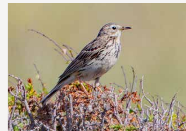
Heipilerke Meadow pipit Anthus pratensis