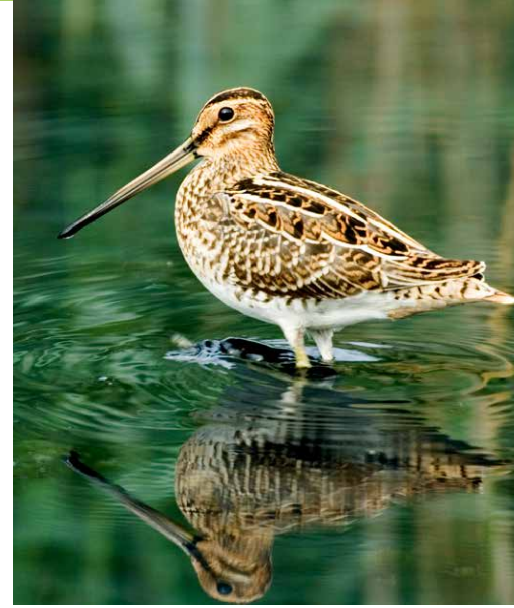
Enkeltbekkasin Common snipe Gallinago gallinago