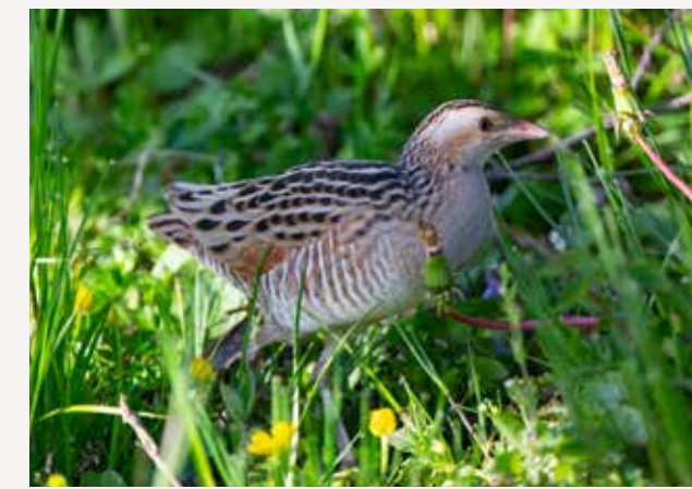
Åkerrikse Dunlin Calidris alpina