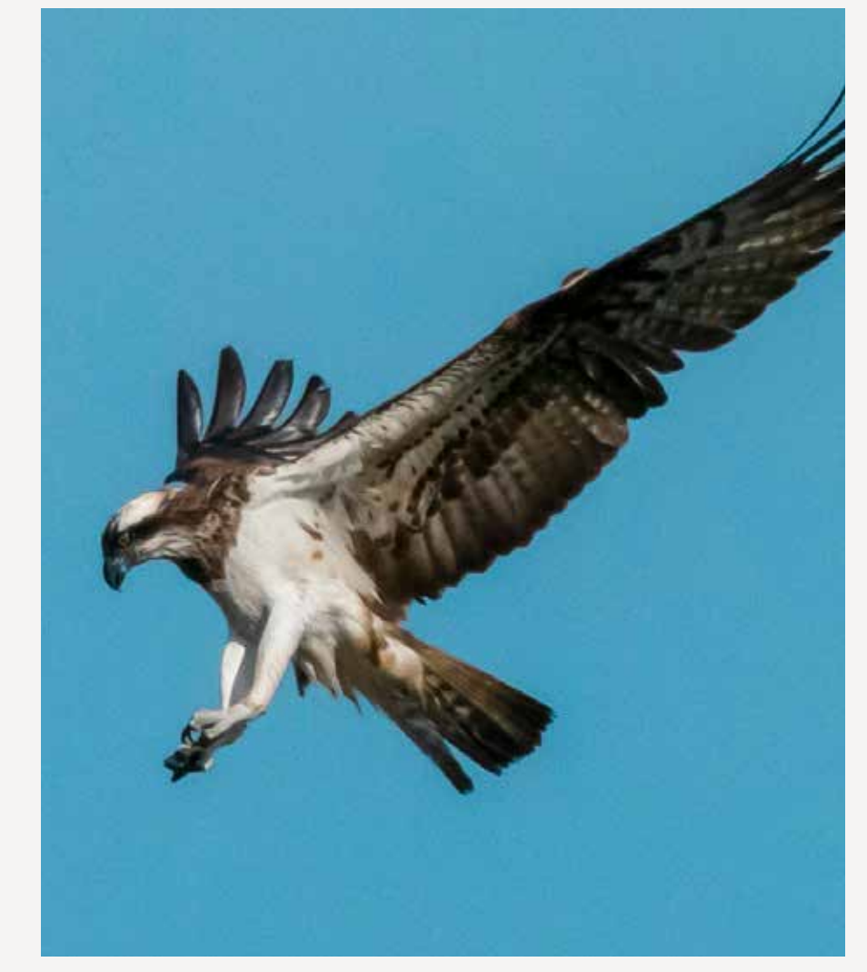
Fiskeørn Osprey Pandion hallaetus

Fiskeørn har vært totalfredet i Norge siden 1962. Den trekker til Middelhavsområdet og tropisk Vest-Afrika.