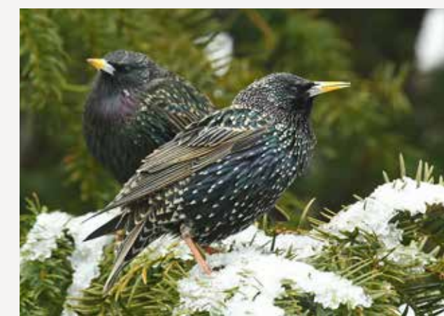
Stær European starling Sturnus vulgaris