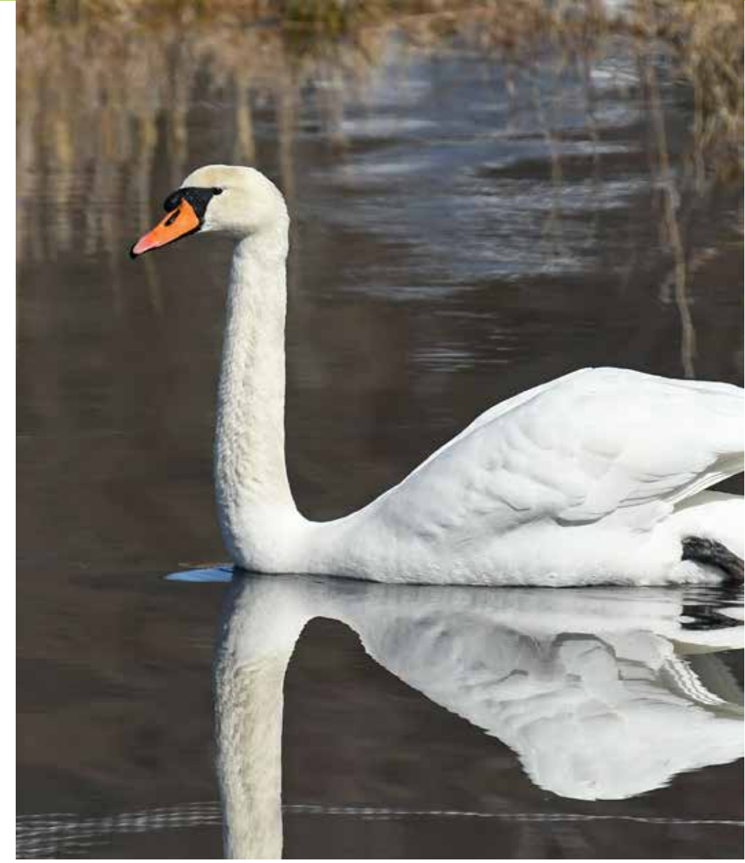
Knoppsvane Mute swan Cygnus olor

247 species of birds have been observed in Børsesjø nature reserve. Many of them are on the Norwegian red list of threatened species.