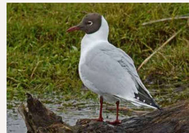
Hettemåke Black-headed gull Chroicocephalus ridibundus