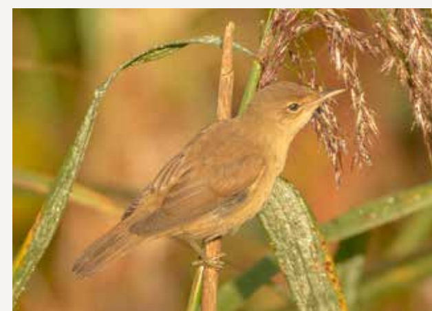
Rørsanger European reed warbler Acrocephalus scirpaceus