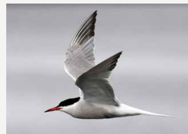
Makrellterne Common tern Sterna hirundo