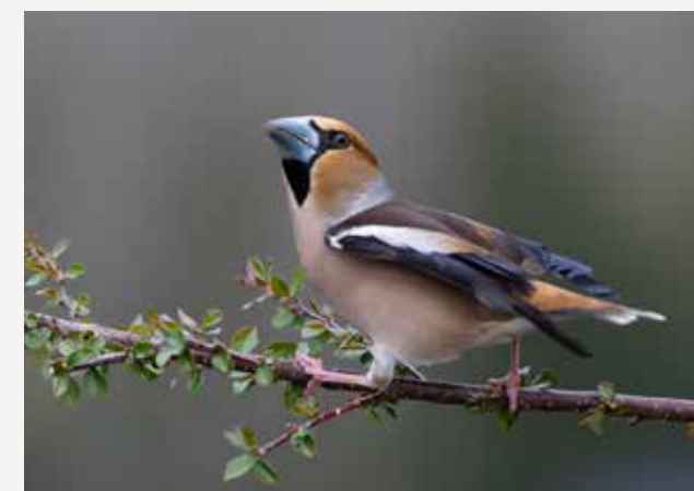
Kjernebiter Hawfinch Coccothraustes coccothraustes