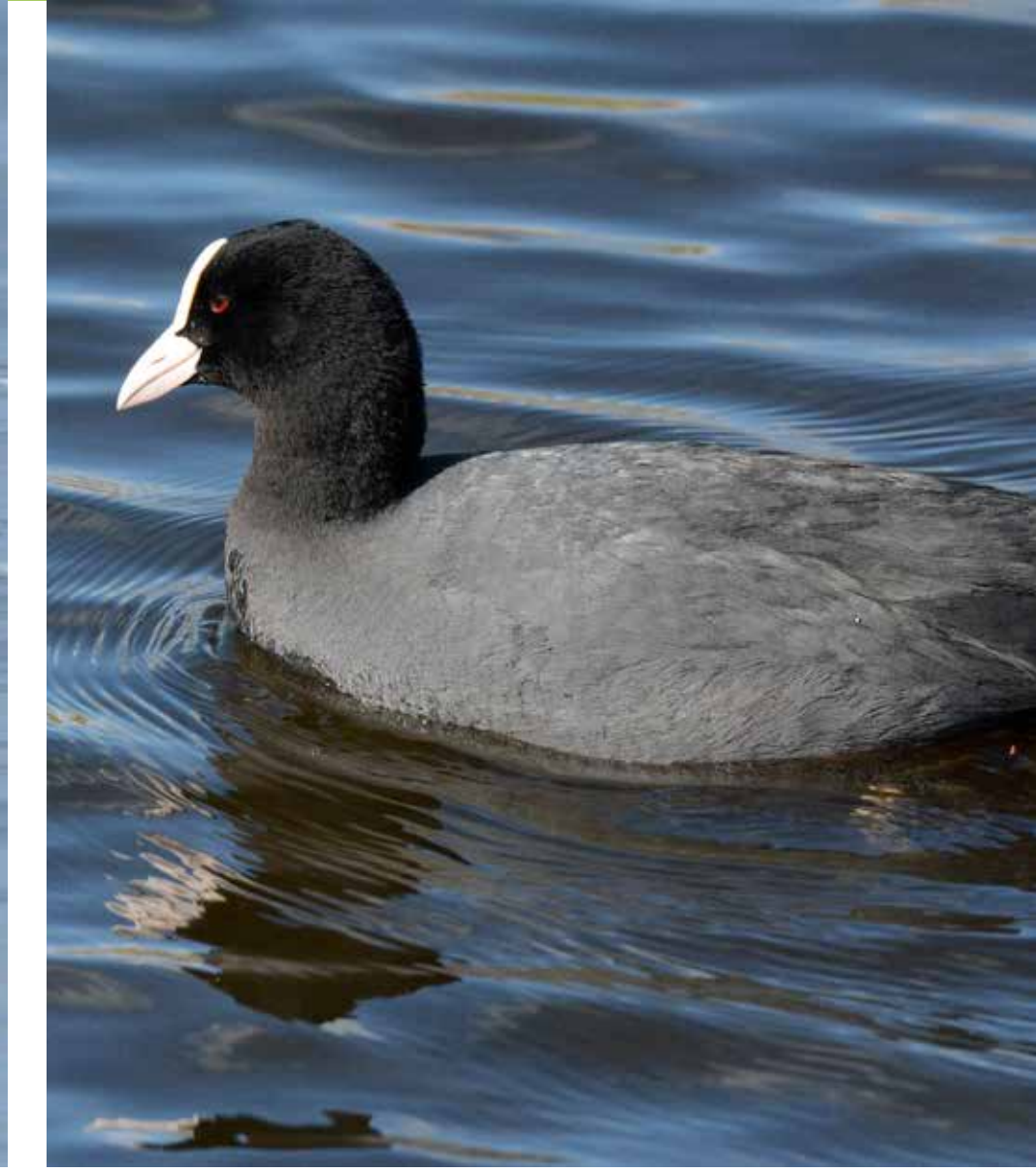
Sothøne Common coot Fulica atra