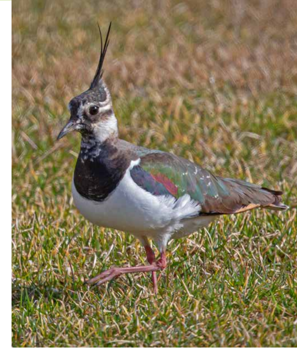
Vipe Northern lapwing Vanellus vanellus