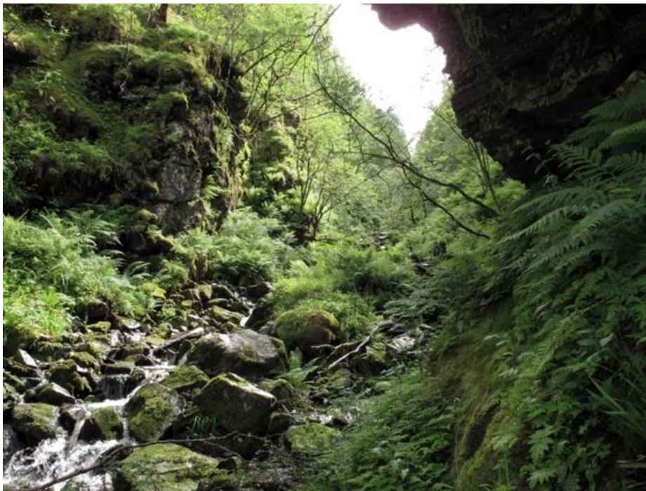
Figur 1 Biletet frå Flategilet i tilbodsområdet syner bekkekløfta, ein naturtype med jamn fuktigheit i lufta og der kravfulle artar trivst på bergvegger og langs vassvegen. Bekkekløfter er mangelfullt dekt i skogvernet i Vestland, og Flategilet vil bidra til å få betre vernet av denne naturtypen.

Verneverdiane er knytt, mellom anna, til gamal kystfuruskog med høg alder i sterk oseanisk seksjon (verdi B). I kystbekkekløfta (verdi B) i Flategilet opptrer gode førekomstar av uvanlege og krevjande artar som flommose/flaumrose (nær truga art).