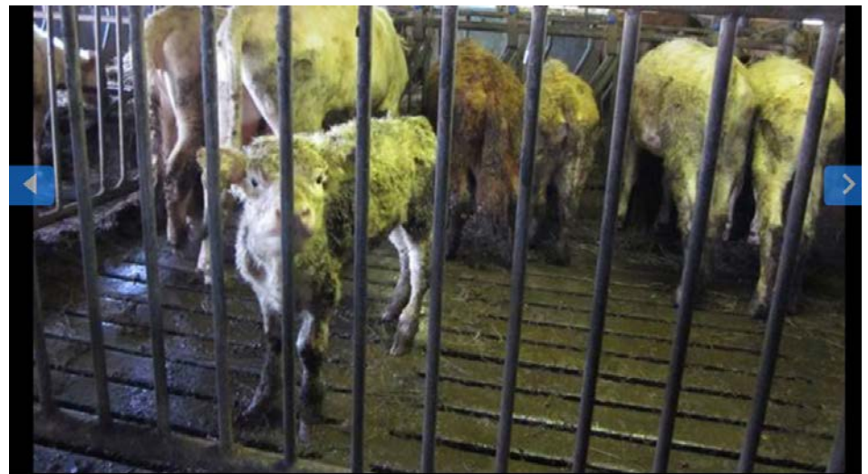
av 7 : Forskjeller i størrelse blant dyr tyder på at en rangorden hersker mellom dyrene.