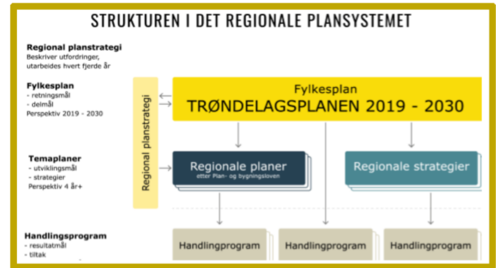
Figuren over viser hovedelementene i det regionale plansystemet.