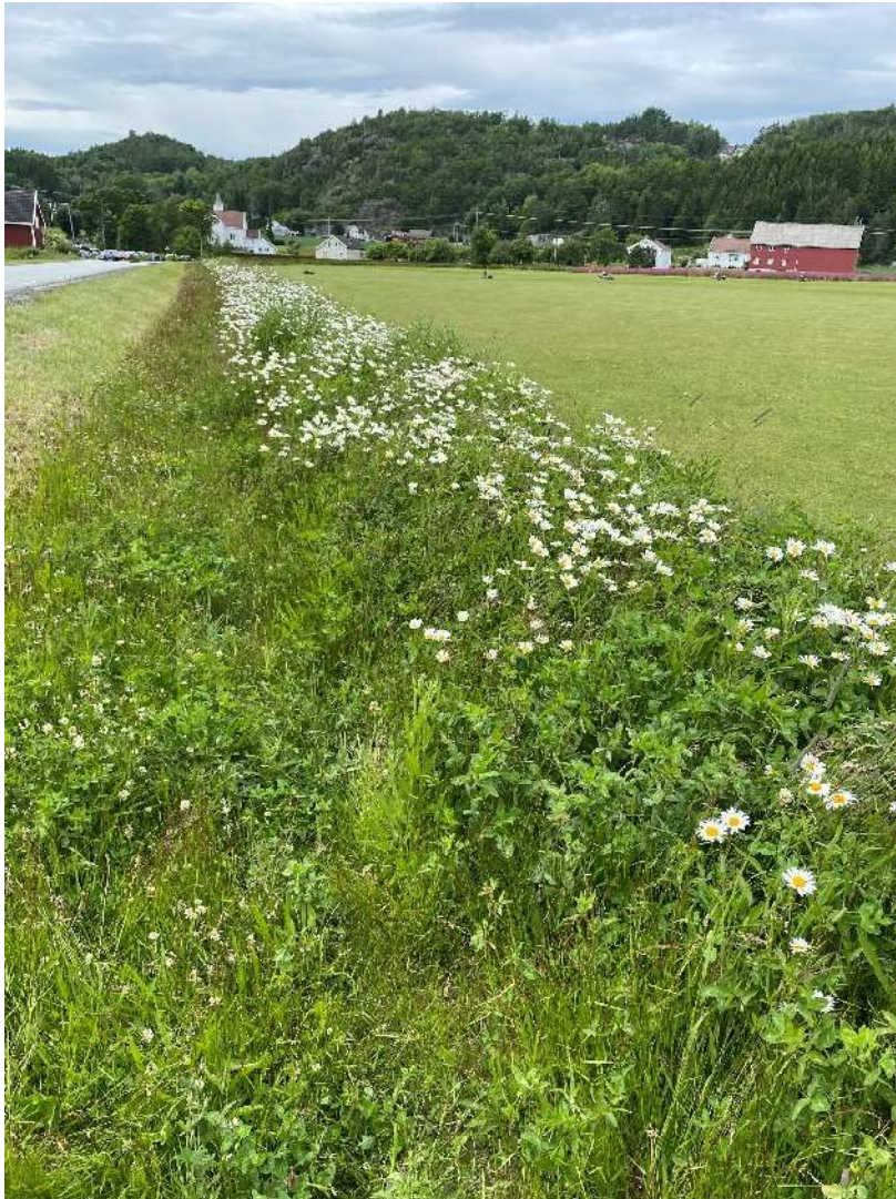
Pollinatorzone på Landvik i Grimstad