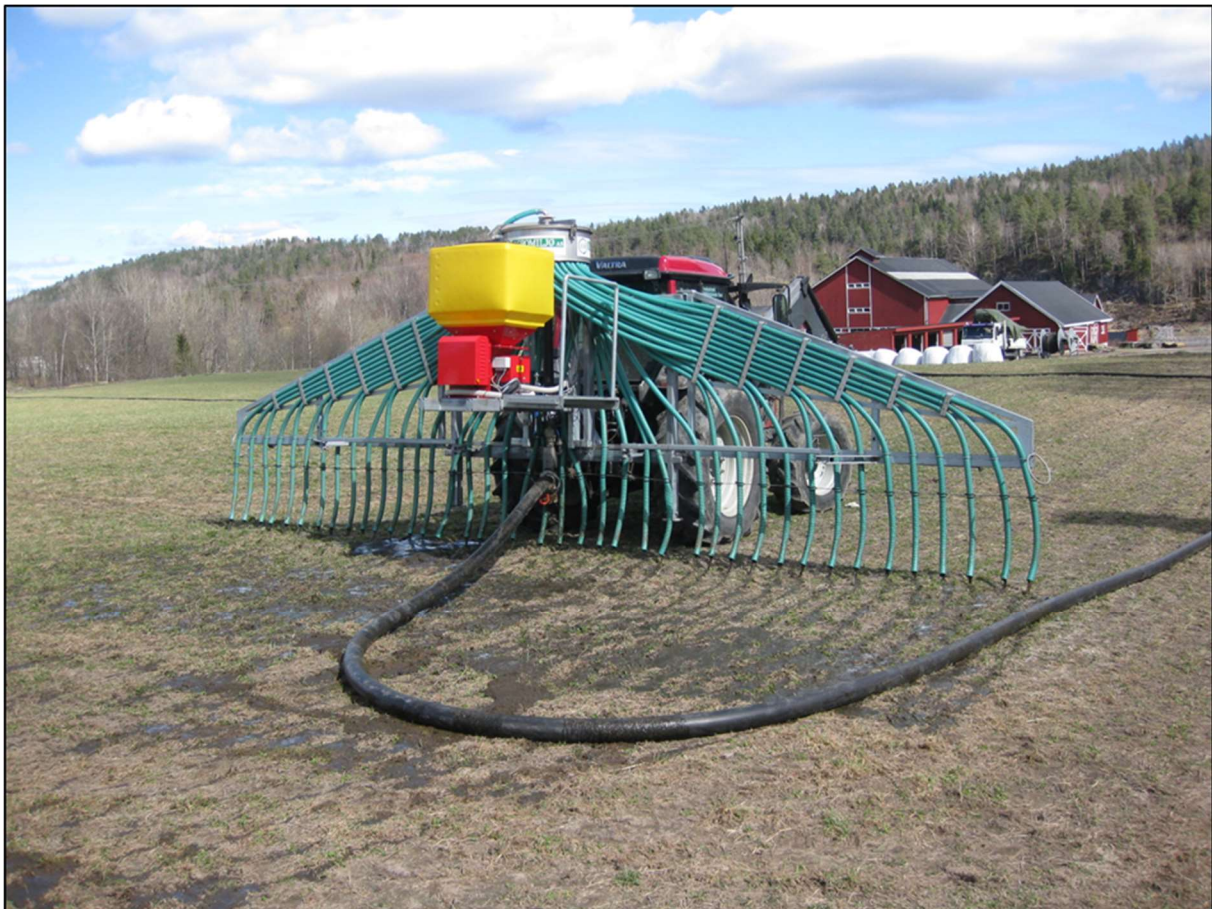
Slangespreder med tilførselsslange, foto: Jan Karstein Henriksen/NLR Agder