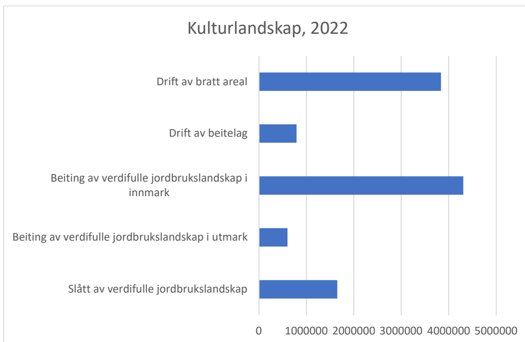
Figur 3 Fordeling av midler til de ulike tiltakene under miljøtema Kulturlandskap for søknadsomgangen 2022.

Figuren nedenfor viser fordeling av tiltakene i utbetalt tilskudd innen miljøtema Kulturlandskap. Det blir en betydelig omfordeling av midler fremover ved de endringene som er foreslått for kommende programperiode. Se mer om endringene i kapittel 6. Tiltaket beiting av verdifulle jordbrukslandskap i innmark er det enkelttiltaket som det er brukt mest av RMP-midlene til.