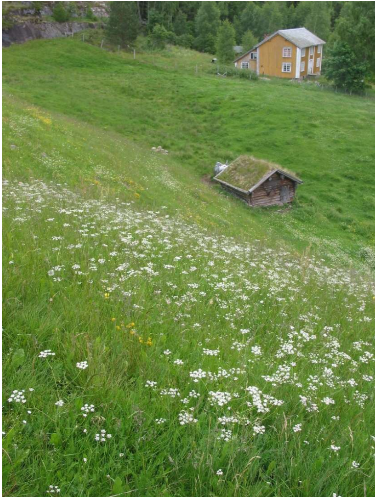
Blomstereng – slåttemark