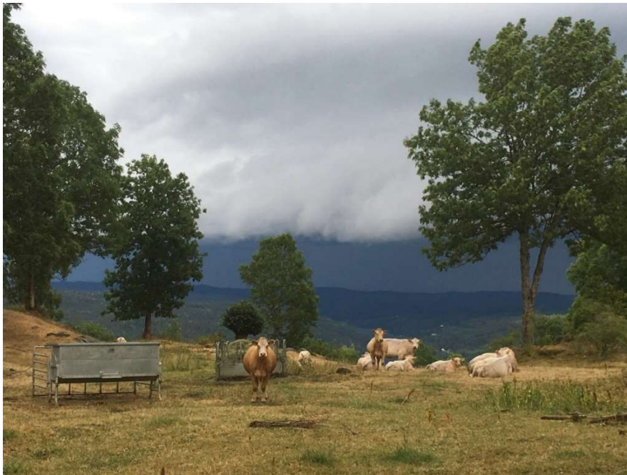
Melås i Gjerstad

Tilskudd til dette tiltaket skal videreføres i 2023 og deretter fases ut med en gradvis nedtrapping av satsene i løpet av resten av programperioden. Se nærmere omtale om hvorfor dette tiltaket utfases i kapittel 6.1.