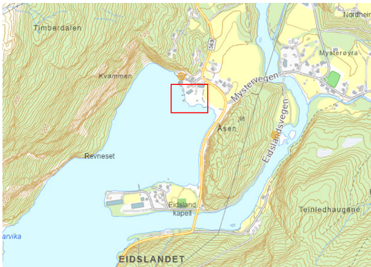
Figur 1: Oversiktskart som viser lokalisering av tiltaksområdet på Eidslandet markert i rødt.

Statnett skal bygge ny transformatorstasjon i Krossdalen, samt kraftledninger mellom Steinsland og Krossdalen. Det vil også bli gjennomført veiarbeid og riving av deler av det eksisterende anlegget. For å muliggjøre transporten av den nye transformatoren, vil det bli bygget et nytt kaihakk på Eidslandet ved gnr./bnr. 35/3 og 35/73. Plassering av tiltaksområdet er vist i Figur 1.