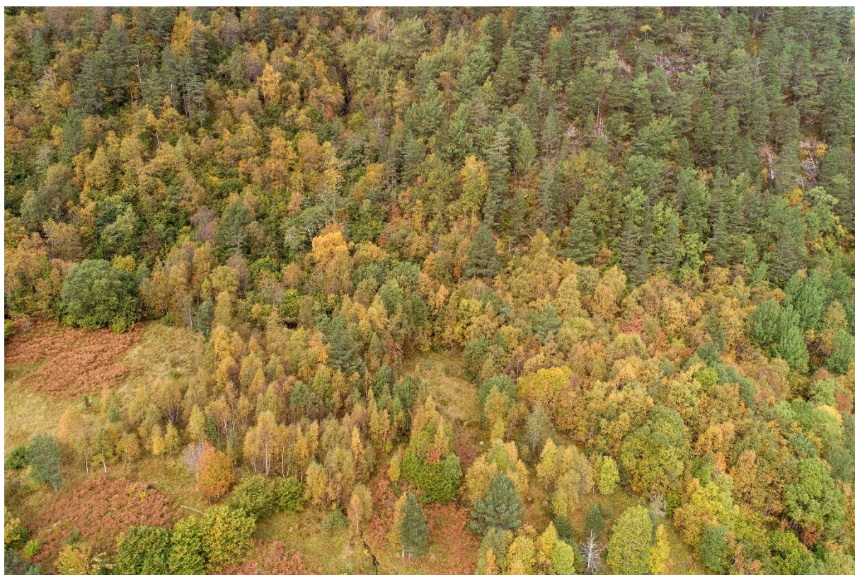
Rik edellauvskog ved Li i Tingvoll kommune.