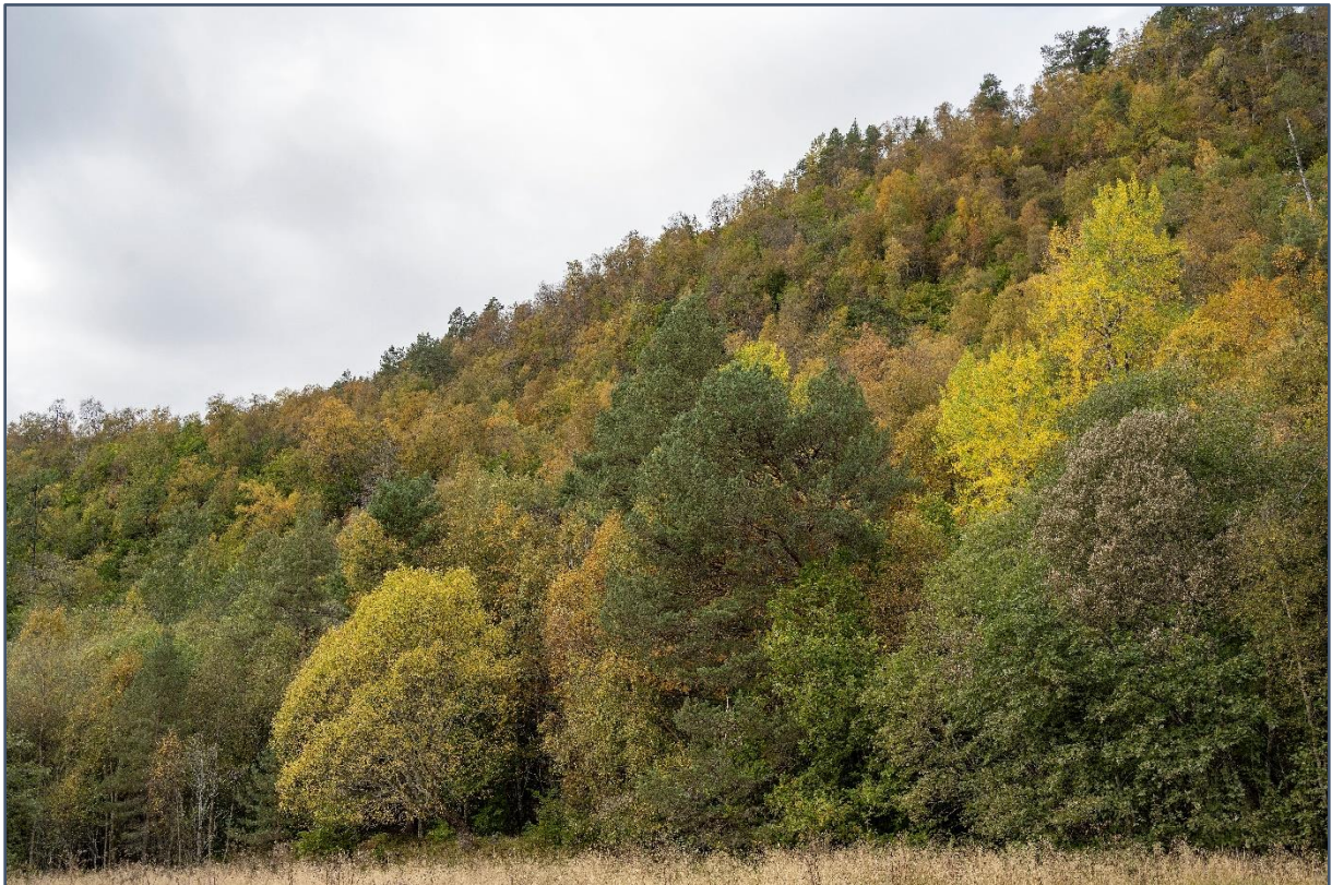
Edellavtre i blanding med furu.

Treffes vedtak om reservat som krever aktive gjenopprettingstiltak, eller vedtak om reservat der bruk er en forutsetning for bevaring av det biologiske mangfold, skal det samtidig med vernevedtaket legges fram et utkast til plan for skjøtsel for å sikre verneformålet. Planen kan omfatte avtale om bruk av arealer, enkeltelementer og driftsformer. Planen eller avtalen kan inneholde bestemmelser om økonomisk kompensasjon til private som bidrar til områdets skjøtsel.”