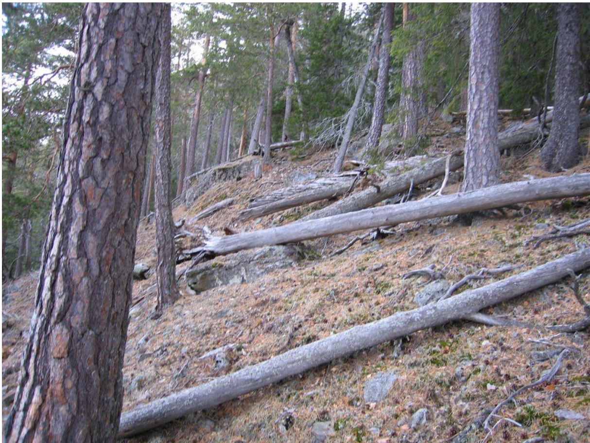
Eldre furuskog med dødved øverst i lia