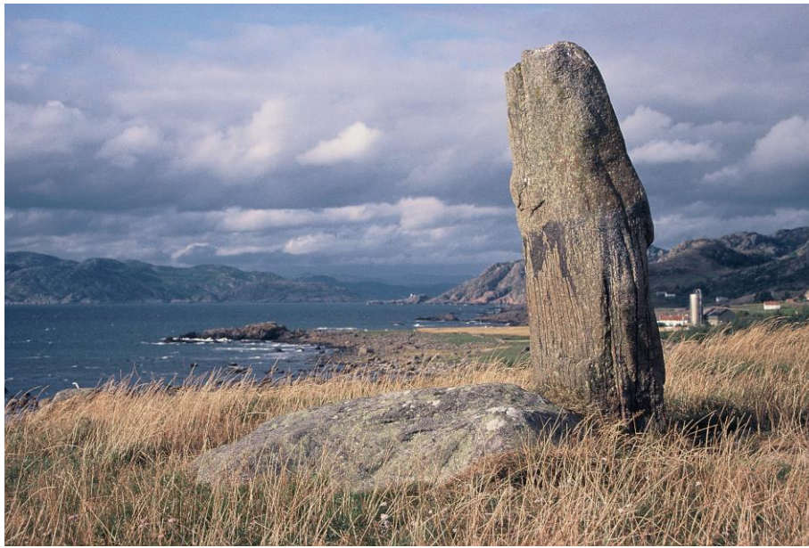
Vanen på Sausebakk