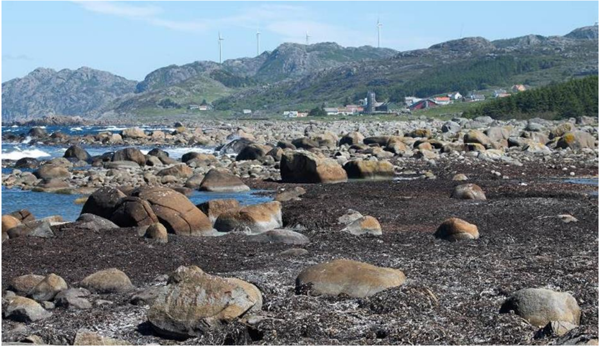
Fig. Tareførekommstane nord for Stavestø er viktige som beiteområde for vadefugl.