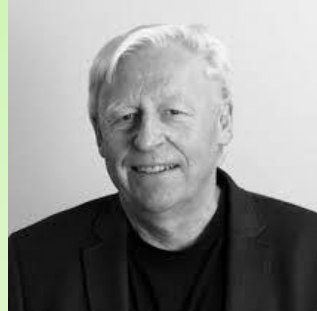
Kjell Aage Gotvassli