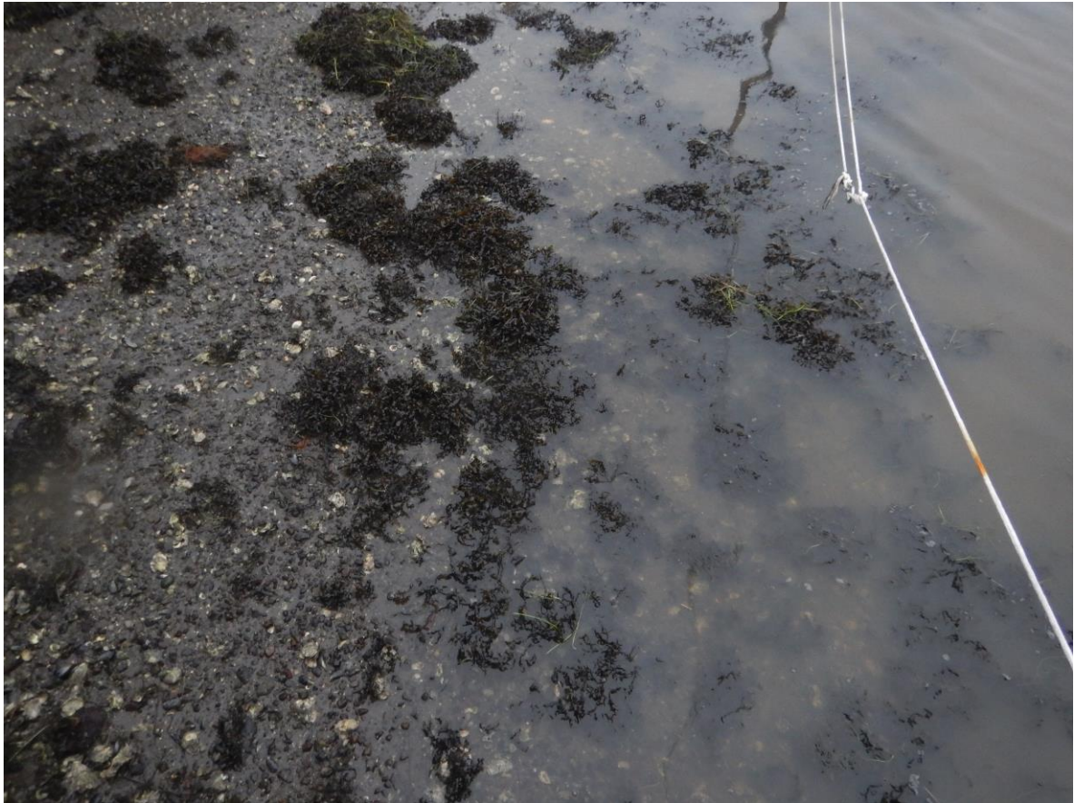
Figur 3. Sjøbunnen ved brygga hvor det ønskes mudring. Bunnen i hele det planlagte utdypingsområdet domineres av spiraltang og stillehavsøsters.

Tiltaksområdet i sjø omfatter den indre 2/3 av flytebrygga. Arealet som ønskes mudret er på ca. 110 m 2 på hver side av brygga, totalt ca. 220 m 2 . Total mengde fjernet mudder vil dermed bli ca. 40 m 3 .