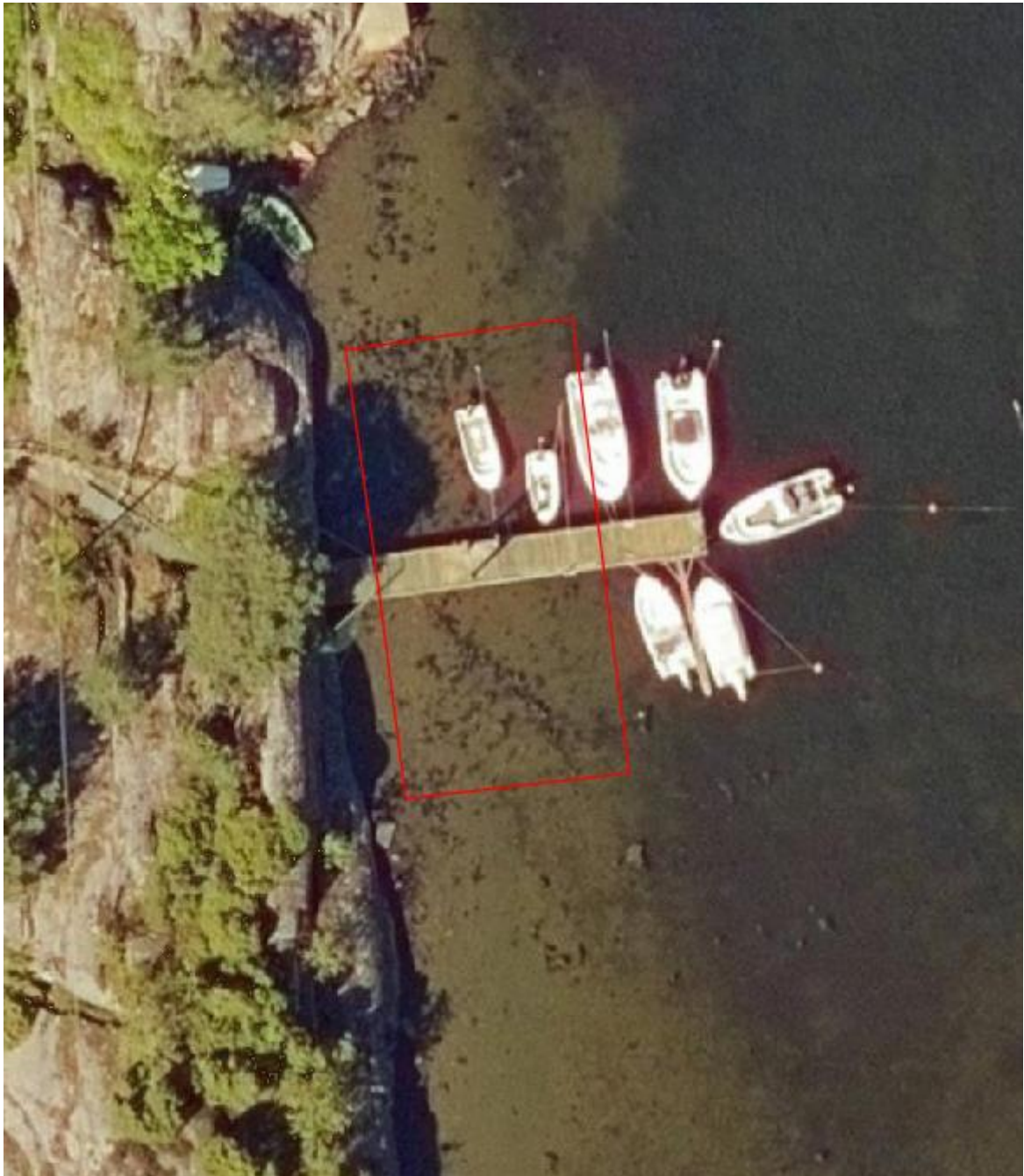
Figur 2. Flybilde av bryggeanlegget, som viser hvor grunt det har blitt under den innerste 2/3 av brygga. Tynn rød strek angir det arealet som ønskes mudret.

Brygga, hvor det er søkt om utdypingstiltak, ligger i Evjesundet, på østsiden av Stangerholmen. Dette er ei enkel fellesbrygge med 10 andelseiere, som har hytte på festetomter i området. Hytteeierne har i sine festekontrakter rett til båtplass i Evjesund og er tilknyttet denne brygga. Det har vært brygge på stedet siden tidlig på 1930-tallet. Sjøbunnen har tidligere blitt mudret for at båter skal kunne ligge ved brygga. Forrige gang det ble gjort utdypingstiltak var på 1970-tallet. Brygga er kun tilrettelagt for småbåter og joller.