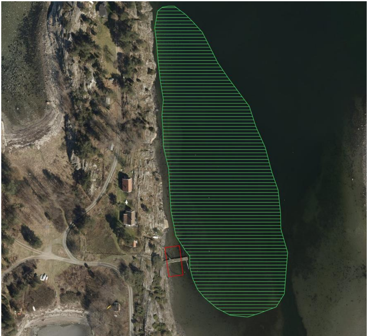
Figur 4. Det er én kjent naturtype i området, en forekomst av Ålegrasenger og andre undervannsenger. Denne ble registrert i Naturbase i 2009 og ble da vurdert som Lokalt viktig (C).

I Naturbase ligger det én registrering av en naturtypelokalitet som berører området foran, og noe inn på siden av flytebrygga. Dette er et område på 15,1 daa med naturtypen Ålegraseng og andre undervannsenger (ID BM000507138, figur 4). Denne ble registrert av Havforskningsinstituttet (HI) den 21.10.2009 og ble gitt verdien Lokalt viktig (C) . Beskrivelsen av denne naturtypen, slik den er presentert i Naturbase, er gjengitt i vedlegg 1.