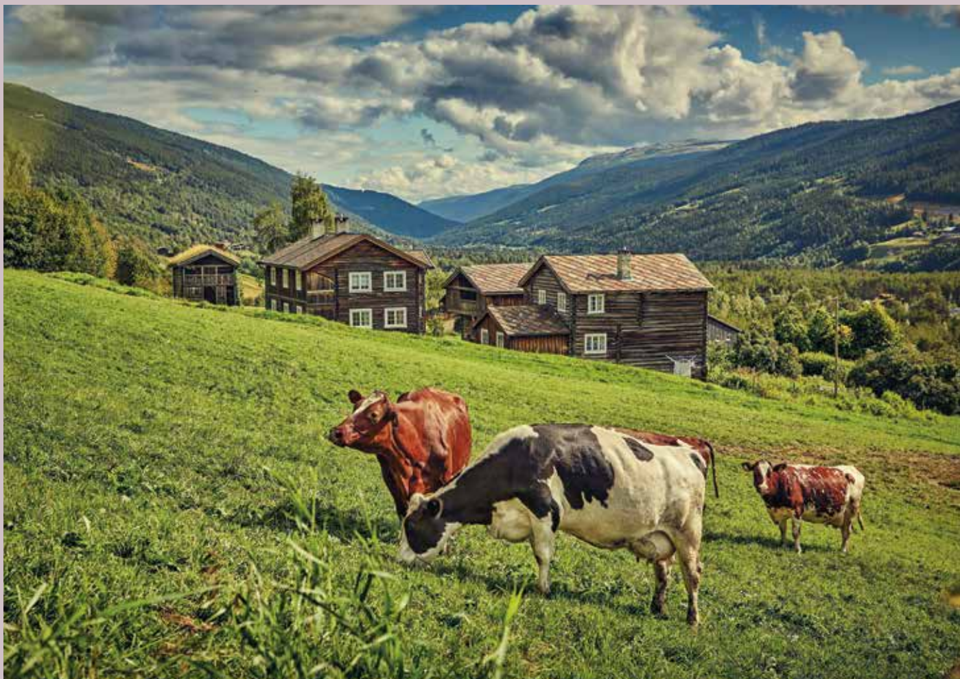
Aus Heidal.