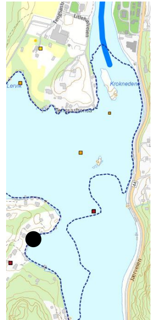
Figur 2. Lakseførende del av vassdrag markert i blått. Mørkeblått stiplet området markerer bløtbunnsområdet. Tiltaksområdet markert i svart

Våre vurderinger og krav er basert på prinsippet om bruk av beste tilgjengelige teknikker (BAT), jf. forurensningsloven § 2 nr. 3 og naturmangfoldloven § 12 om bruk av miljøforsvarlig teknikker og driftsmetoder.