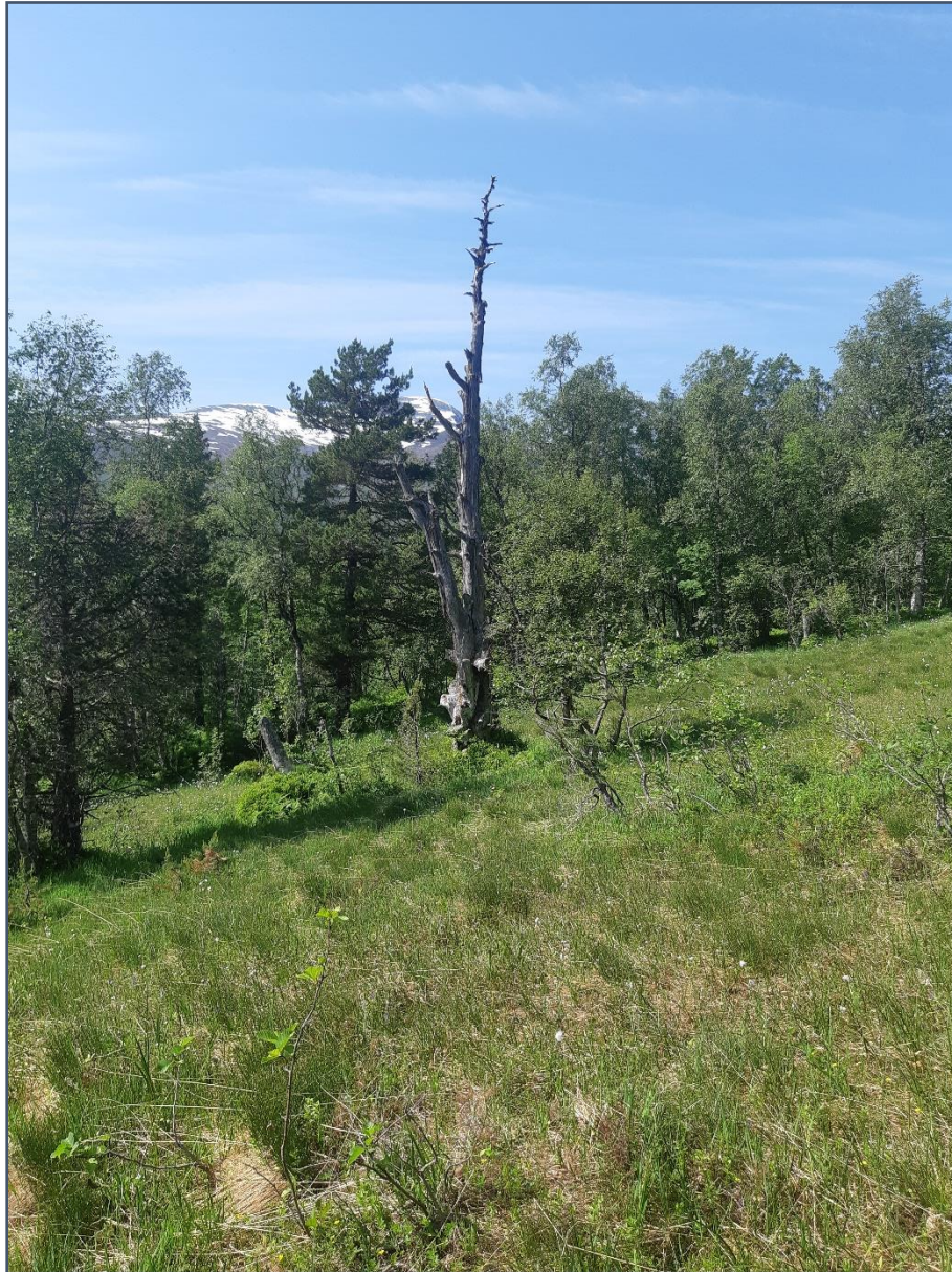
Gadd i soleksponert li med opent myrlandskap.