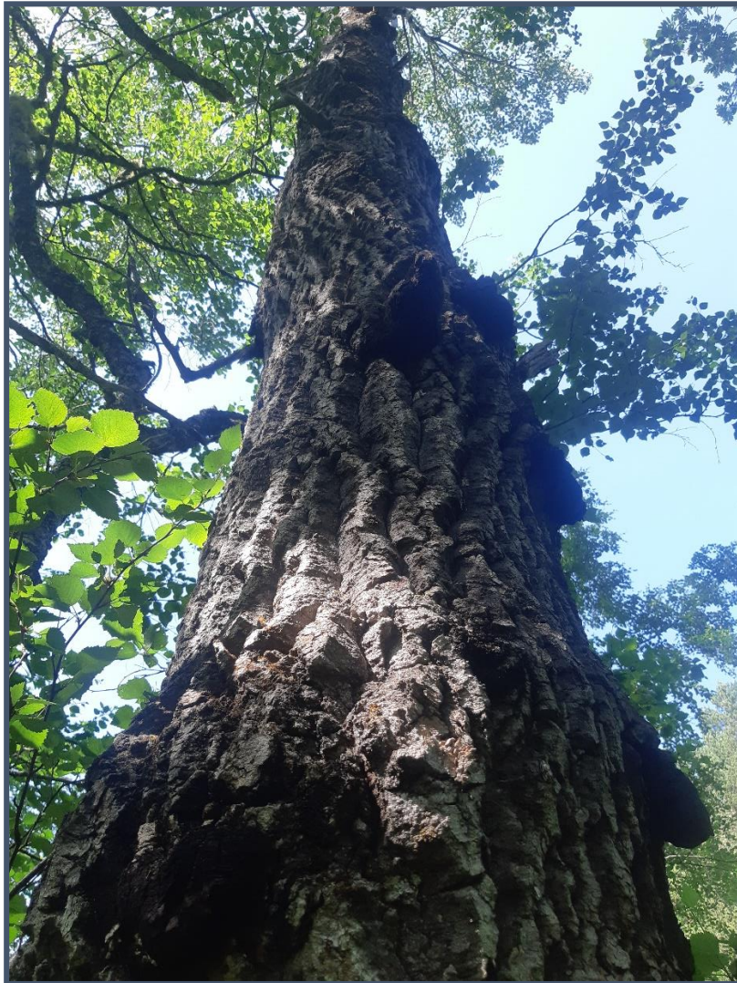
Gamal, grov osp nordvest i verneområde.

Skorgedalen naturreservat, Rauma kommune