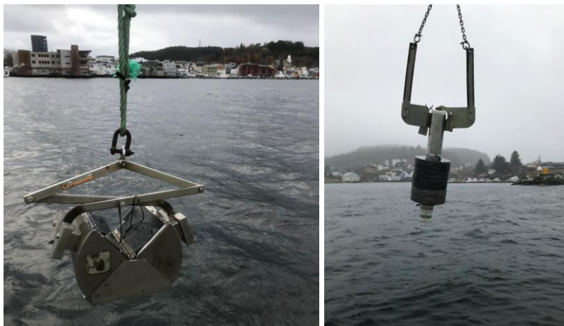
Figur 3. Venstre. Van Veen grabb (0,1 m 2 ) benyttet til prøvetaking i Florø i november 2020. Høyre: Abdullah kjerneprøvetaker med 100 cm lange rør benyttet til prøvetaking i Florø i november 2020.

Når grabbprøvene ble tatt om bord på dekk ble det gjort en visuell beskrivelse av prøven (sedimenttykkelse, lukt, kornfordeling, farge). Deretter ble prøven overført til en rilsanpose eller plastbøtte, forseglet og lagt i en lystett kjølebager. På stasjoner der det ble tatt vellykkete grabbhugg fra flere prøvepunkter, ble representative deler av delprøvene også samlet til en blandprøve for stasjonen. Etter endt feltarbeid ble sedimentprøvene lagret i lystette kjølebager i et kjølerom (ca. 4 °C) hos Rambøll. Blandprøver av sediment fra hver stasjon (eller representativ delprøve, der kun en delprøve ble opparbeidet for stasjonen) ble levert til analyse hos ALS Laboratory Group 11. november 2020.