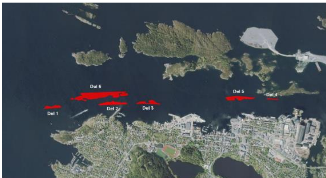
Figur 1. Planlagte utdypningsområder i innseilingen til Florø.

De planlagte utdypningsområdene i innseilingen til Florø i Kinn kommune, er delt inn i 6 delområder (del 1-6), illustrert i Figur 1. I denne rapporten presenteres resultater fra undersøkelse av løsmasser/sedimenter ved de ulike utdypningsområdene, samt to dypere områder (del-8 og del-10) like sør for delområde del 3 og del 5.