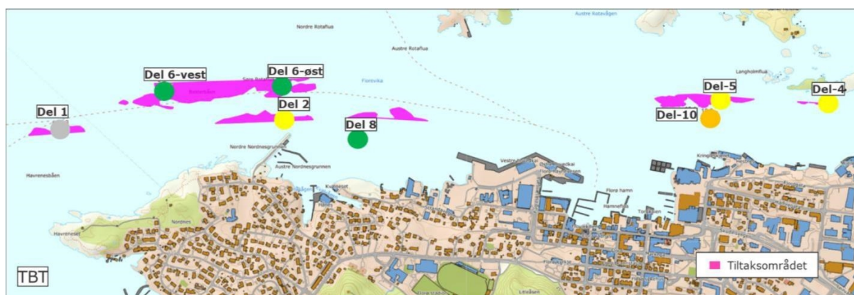
Figur 8. Omtrentlig område representert i sedimentprøvene fra de ulike stasjonene i Florø er markert med sirkel. Fargen på sirkelen indikerer tilstandsklassen til TBT på de enkelte stasjonene (der sedimentprøver er analysert) iht. fargekoder gitt i Tabell 2. Blå indikerer svært god tilstand (tilstandsklasse I), grønn indikerer god tilstand (tilstandsklasse II), gul indikerer moderat tilstand (tilstandsklasse III), oransje indikerer dårlig tilstand (tilstandsklasse IV), rød indikerer svært dårlig tilstand (tilstandsklasse V), mens grå indikerer konsentrasjoner under deteksjonsgrensen.

TBT ble ikke detektert i sedimentprøven fra stasjon del-1. På stasjon del-6-vest, del-6-øst og del-8 tilsvarte konsentrasjonen av TBT god tilstand (tilstandsklasse II). På stasjon del-2, del-4 og del-5 tilsvarte konsentrasjonen av TBT moderat tilstand (tilstandsklasse III), mens på stasjon del-10 tilsvarte konsentrasjonen av TBT dårlig tilstand (tilstandsklasse IV).