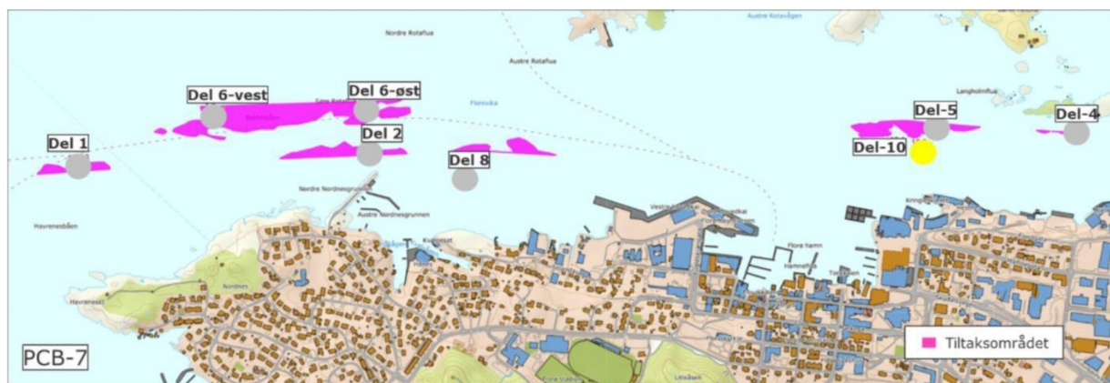
Figur 7. Omtrentlig område representert i sedimentprøvene fra de ulike stasjonene i Florø er markert med sirkel. Fargen på sirkelen indikerer tilstandsklassen til PCB-7 på de enkelte stasjonene (der sedimentprøver er analysert) iht. fargekoder gitt i Tabell 2. Blå indikerer svært god tilstand (tilstandsklasse I), grønn indikerer god tilstand (tilstandsklasse II), gul indikerer moderat tilstand (tilstandsklasse III), oransje indikerer dårlig tilstand (tilstandsklasse IV), rød indikerer svært dårlig tilstand (tilstandsklasse V), mens grå indikerer konsentrasjoner under deteksjonsgrensen.

Det ble kun detektert PCB-7 på en av åtte stasjoner. Dette var stasjon del-10, som ligger på dypere vann noe sør for det planlagte utdypingsområdet (del-5) til Kystverket. Konsentrasjonen av PCB-7 tilsvarte moderat tilstand (tilstandsklasse III) på denne stasjonen.