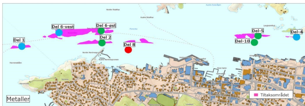
Figur 5. Omtrentlig område representert i sedimentprøvene fra de ulike stasjonene i Florø er markert med sirkel. Fargen på sirkelen indikerer tilstandsklassen til det metallet i dårligst tilstand på de enkelte stasjonene (der sedimentprøver er analysert) iht. fargekoder gitt i Tabell 2. Blå indikerer svært god tilstand (tilstandsklasse I), grønn indikerer god tilstand (tilstandsklasse II), gul indikerer moderat tilstand (tilstandsklasse III), oransje indikerer dårlig tilstand (tilstandsklasse IV), rød indikerer svært dårlig tilstand (tilstandsklasse V), mens grå indikerer konsentrasjoner under deteksjonsgrensen.

Konsentrasjonen av metaller (arsen, bly, kadmium, krom, kobber, sink, kvikksølv og nikkel) tilsvarte svært god tilstand (tilstandsklasse I) eller god tilstand (tilstandsklasse II) på alle stasjoner, utenom konsentrasjonen av kobber i delområde 8 (St-del-8). Konsentrasjonen av kobber på denne stasjonen tilsvarte svært dårlig tilstand (tilstandsklasse V). Merk at dette området ligger dypere og noe sør for utdypningsområde «delområde 3», samt at det ble kun tatt en vellykket grabbprøve på denne stasjonen.