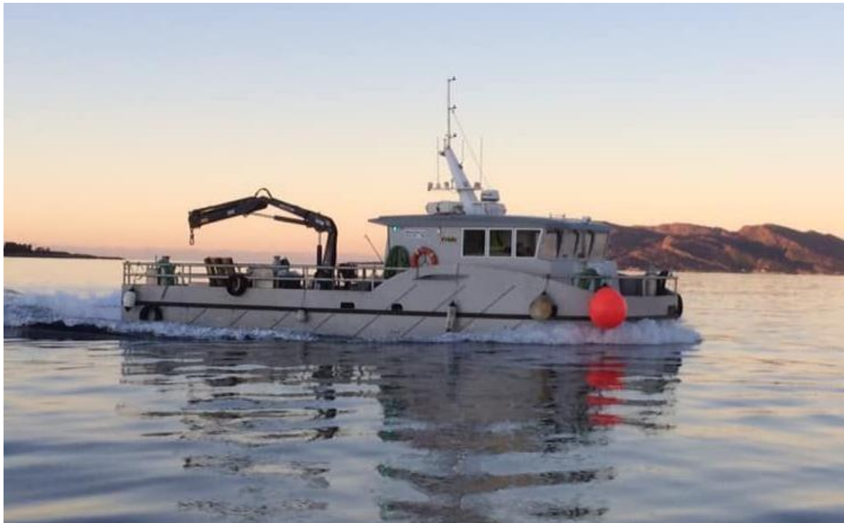
Figur 2. Bilde av fartøyet Nautilus Survey benyttet til ROV-undersøkelsene.

Under feltarbeidet ble det gjennomført grabbprøvetaking og kjerneprøvetaking med bruk av fartøyet kran og nokk.