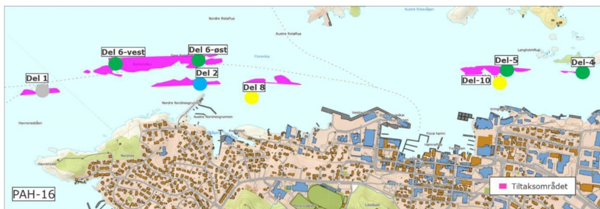
Figur 6. Omtrentlig område representert i sedimentprøvene fra de ulike stasjonene i Florø er markert med sirkel. Fargen på sirkelen indikerer tilstandsklassen til PAH-16 på de enkelte stasjonene (der sedimentprøver er analysert) iht. fargekoder gitt i Tabell 2. Blå indikerer svært god tilstand (tilstandsklasse I), grønn indikerer god tilstand (tilstandsklasse II), gul indikerer moderat tilstand (tilstandsklasse III), oransje indikerer dårlig tilstand (tilstandsklasse IV), rød indikerer svært dårlig tilstand (tilstandsklasse V), mens grå indikerer konsentrasjoner under deteksjonsgrensen.

På de to stasjonene fra større dyp, del-8 og del-10, ble det detektert noe høyere konsentrasjoner av PAH-forbindelser. På begge disse stasjonene ble det detektert konsentrasjoner tilsvarende dårlig tilstand (tilstandsklasse IV) for syv PAH-forbindelser, og konsentrasjoner tilsvarende moderat tilstand (tilstandsklasse III) for hhv. fire (del-8) og tre (del-10) PAH-forbindelser. De øvrige PAH-forbindelsene ble detektert i konsentrasjoner tilsvarende god tilstand (tilstandsklasse II). Sum-parameteren for alle analyserte PAH-forbindelser, PAH-16, tilsvarte moderat tilstand (tilstandsklasse III) på begge stasjonene.