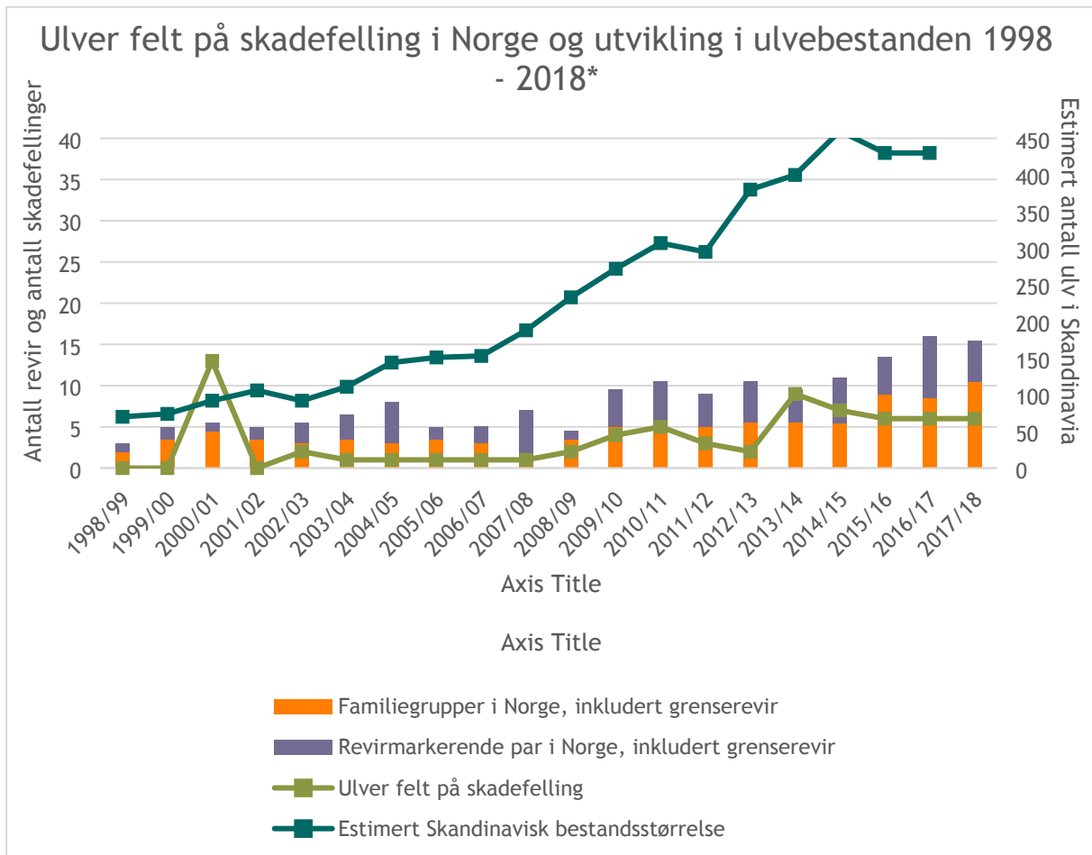
Figur 1. Utviklingen i ulvebestanden i Skandinavia og Norge, samt antall ulv felt på skadefelling i tilsvarende periode (1. april 1998 til og med 31. mars 2018). *Endelig bestandsstatus for 2017/18 vil foreligge juni 2018.

Ut fra disse vurderingene og med tanke på rask iverksettelse, i de tilfeller når kriteriene for skadefelling vurderes oppfylt, vedtar Miljødirektoratet en kvote for betinget skadefelling innenfor hvilken fylkesmennene kan iverksette skadefelling av ulv etter eget tiltak eller etter søknad jf. rovviltforskriften § 9 og innenfor gitt kvote og tidsrom. Miljødirektoratet vurderer at et slikt uttak ikke vil sette ulvebestandens overlevelse i fare.