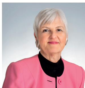
Valgerd Svarstad Haugland Statsforvaltar i Oslo og Viken

Eg ynskjer, på embete sine vegne, ein god dialog og eit godt samarbeid med kommunane i 2024. Tusen takk for innsatsen i åra vi har lagt bak oss. Dei siste åra har vore krevjande for oss alle og 2024 vil nok også bli utfordrande.