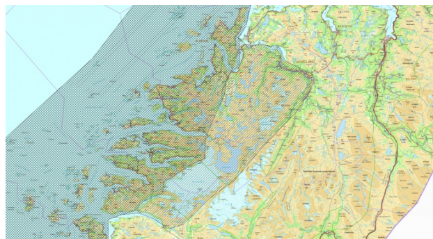
Figur: Forslag til utvidelse av "Kystområdet" i kommunene Rødøy, Meløy og Gildeskål. Svart rutenett = dagens plan, svart skravur = foreslått utvidelse.

Under høringa av forvaltningsplanen ble det ikke spilt inn et ønske om å endre grensene for "Kystområdet", og nemnda har i utgangspunktet ikke lagt opp til evt. ny vurdering av disse grensene. Evt. justeringer av "Kystområdet" er heller ikke omtalt ved oversendelse av forvaltningsplanen til DN.