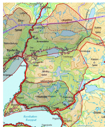
Figur: Forslag til utvidelse av prioriterte beiteområder i Indre Ofoten. Svart rutenett = dagens plan, rød skravur = foreslått utvidelse.

Sørfold kommune påpeker at de er prinsipielt i mot at prioriterte beiteområder for sau i forvaltningsplanen, kun skal omfatte beiteområder som er i bruk. Det er store verdifulle utmarksressurser i Sørfold, som på denne måten går tapt for framtidig matproduksjon. Det vises i den sammenheng til områdene i Siso, der beitebrukeren måtte flytte dyrene til et nærmere skogsbeite og gjerde inn dette, for overhode å kunne fortsette med sau. Dyrene på dette beitet har gjennomgående lavere slaktevekt enn de dyrene som går på utmarksbeite i kommunen.