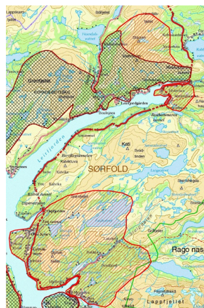
Figur: Forslag til utvidelse av prioriterte beiteområder i Sørfold. Svart rutenett = dagens plan, rød skravur = foreslått utvidelse.