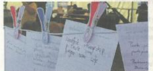
INNSPILL: Mange benyttet anledningen til å komme med forslag til hva Melhus sentrum kan bli i framtida.