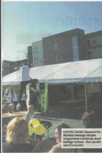
LUFTIG DANS: Dansere fra Melhus Onstage skapte temperatur i sentrum med heftige rytmer. Her tas det sats fra bordet.