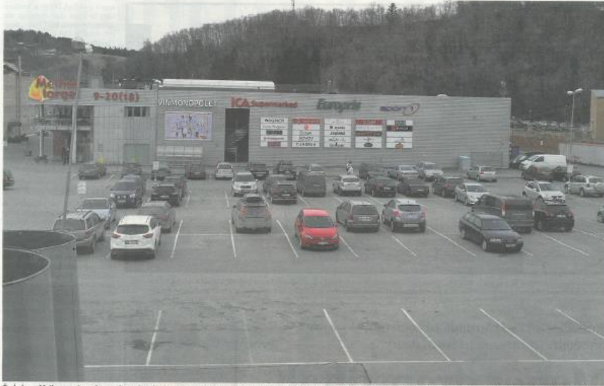
God plass: Melhus sentrum har godt med parkeringsplasser, som her foran Melhus torget. Nå vil kommunen gi sentrum et kraftig løft, og kanskje bilene får mindre boltréplass?

Trønderiske tettsteder er sorgelige saker. Melhus vil gjøre noe med det, men vil få trøbbel med å rette opp gamle feilgrep.