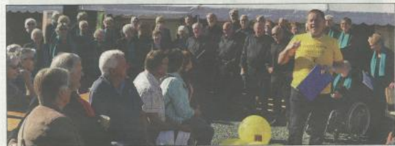
Mye folk i Melhus sentrum da Bondens marked var på besøk. Melhus kommune hadde et arrangement der folk kunne komme med innspill til sentrumsplan. Her er pensjonistkoret sitt opp for fru korsang.

Årsmend Sveiflug fortalte om den historiske utviklingen av Melhus sentrum. Et sentrum ved Melhus oppstod tidlig, og ble forsterket av ferjetrafikken over Gaule, som ble drevet tidlig, og av jernbanen som kom i 1864. At Melhus ble en folkerik storkommune skyldes på utviklingen av tettstedet.