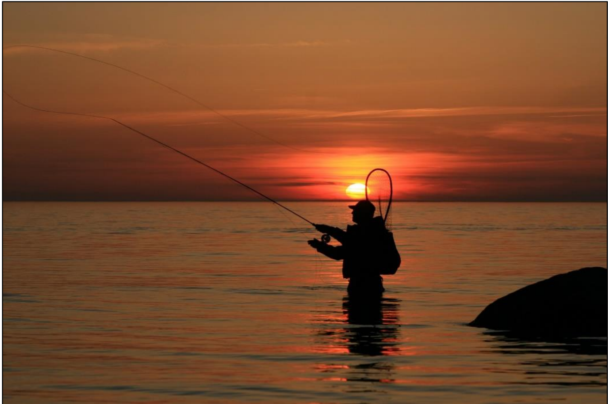
Figur 3. Sportsfiske i sjø.

Garn med maskevidde mindre enn 32 millimeter, vil framleis kunne fange effektivt på utvandrande laksesmolt og små sjøaure. Eit garn med maskevidde på 29 millimeter vil til dømes vere effektivt på fisk i storleik 25 – 32 cm. Garn er til ein viss grad selektivt på storleik, men sjølv i garn med små maskevidder tiltenkt liten fisk, kan større fisk sette seg fast.