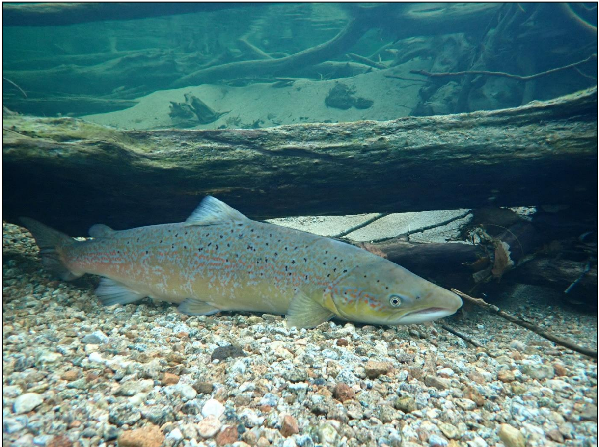
Figur 1. Hanlaks som nyttar tre og røter som skjul.

Osterfjorden og Nordfjord er det merkeprosjekt for å registrere ut- og innvandrande laksefisk. I tillegg vert det utført fiskeundersøkingar ved konsekvensutgreiing av ulike utbyggingar.