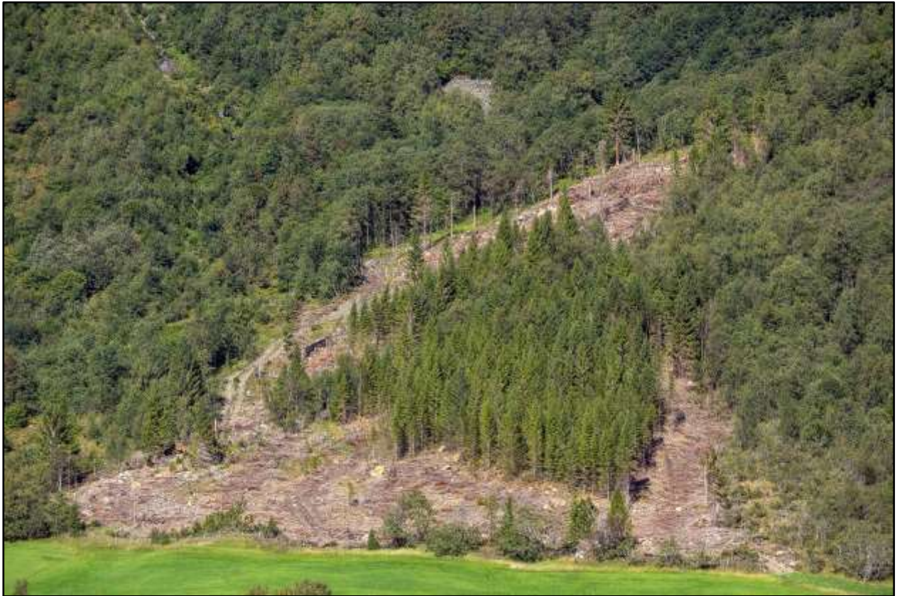
Figur 1 Det vart hogd gran inntil og inni tilbodsområdet i 2021.