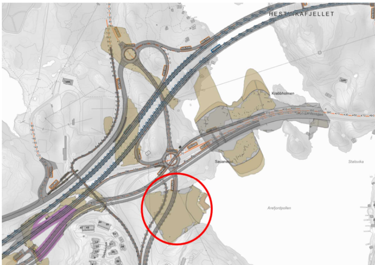
Figur 2. Fotavtrykk for utfylling i Stekervika, markert med raud sirkel. Brunt område er forventa massefortrenging.

Stekervika ligger i Arefjordpollen som er del av vassførekomsten 0261010600-C Kobbaleia i Byfjordsystemet. Det renn og ein bekk som munnar ut i Stekervika, vassførekomst ID 057-38-R. Skildring av vassførekomstane er gitt i søknaden, side 17.