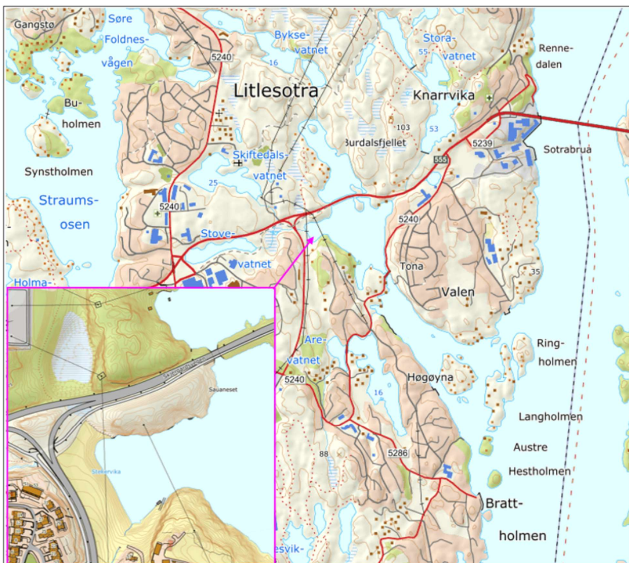
Figur 1. Oversikt over Lillesotra, Knarrvika, Straume og Rosa rute viser Stekervika slik det er i dag, før utbygging av Rv.555.

Som del av Sotrasambandet og ny Rv. 555 skal det byggast ny sykkelveg og ein tilførselsveg ved Arefjordpollen. Vegen fører til behov for utfylling på land og utfylling i sjø ved Stekervika. Stekervika ligger ved Lillesotra, Øygarden Kommune, sjå figur 1