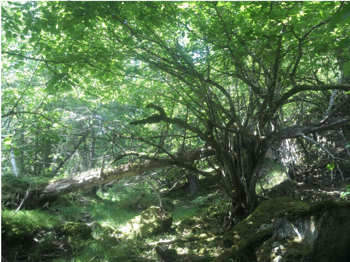
Figur 4 Ospehogen ligg vest for Hundvika i Stad kommune. Det er registrert sjeldne, truga og sårbare artar og raudlista naturtypar som til dømes frisk rik edellauvskog i området.

Formuleringa hogst av etablerte plantefelt er byta ut med formuleringa uttak av framande treslag. Endringa er gjort for å presisere at det gjeld gran og andre framande treslag som anten er etablert i plantefelt eller som spreier seg inn som frø frå andre etablerte plantefelt. Vi har også lagt inn ein ny heimel i § 4 første ledd bokstav l om manuell fjerning av småtre frå framande treslag. Dette for å gjere det lettare for grunneigarar og andre på tur i området å kunne «nappe» småtre av gran før trea rekk å etablere seg.