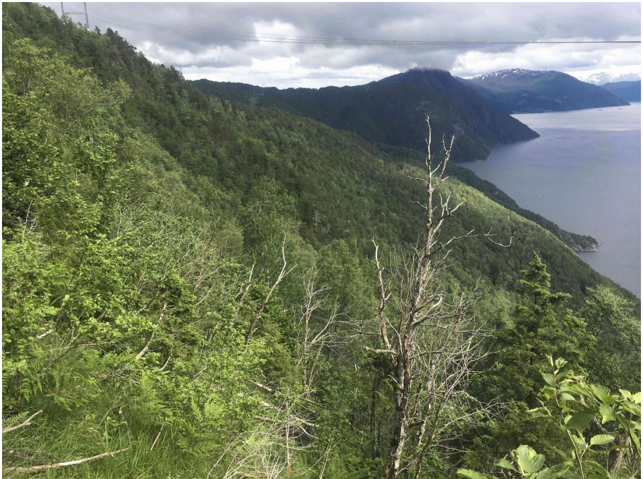
Figur 1 Biletet syner kandidatområdet Ospehogen i Stad kommune som husar fleire raudlista naturtypar for skog. Ein kan sjå kraftlinja i biletet, kandidatområdet ligg i god avstand til linja. Fleire bilete av området ligg i skoganalyserapporten som er tilgjengeleg på heimesidene våre.

Området ligg i ei bratt, sørvendt lisode i ein gradient frå fjorden og opp mot fjellet på nordsida av Nordfjorden i Stad kommune. Arealet vart kartlagt av Biofokus sommaren 2022 i samband med frivillig skogvern. Tresjiktet er rikt og varierer frå ganske storvaksne furutre iblanda bjørk, rogn, osp og selje i høgda, mens det i nedre del mot fjorden veks meir varmekrevjande treslag som hassel, alm, lind, svartor og eik. Arealet inneheld fire ulike raudlista naturtypar, tre av dei er ulike utformingar av edellauvskog (høgstaude edellauvskog, frisk rik edellauvskog og lågurtedellauvskog) og den fjerde er kalk- og lågurtfuruskog. Daud ved finst jamt spreidd, men kontinuiteten er relativt låg. Mange store, gamle tre i kombinasjon med gode vekstforhold gjer at det truleg kjem til å bli betre tilgang på daud ved på relativt kort sikt. Større delar av arealet har rik vegetasjon, og fleire kravfulle artar er registrert. Av 12 raudlista artar er 8 nær truga (NT) og ein er sterkt truga (EN). Det er potensial for å finne fleire. For å få oversikt over registrerte artar, sjå rapporten frå skoganalyse på våre heimesider. På ein verdiskala frå 0 til 9 får Ospehogen ein score på 6,0.