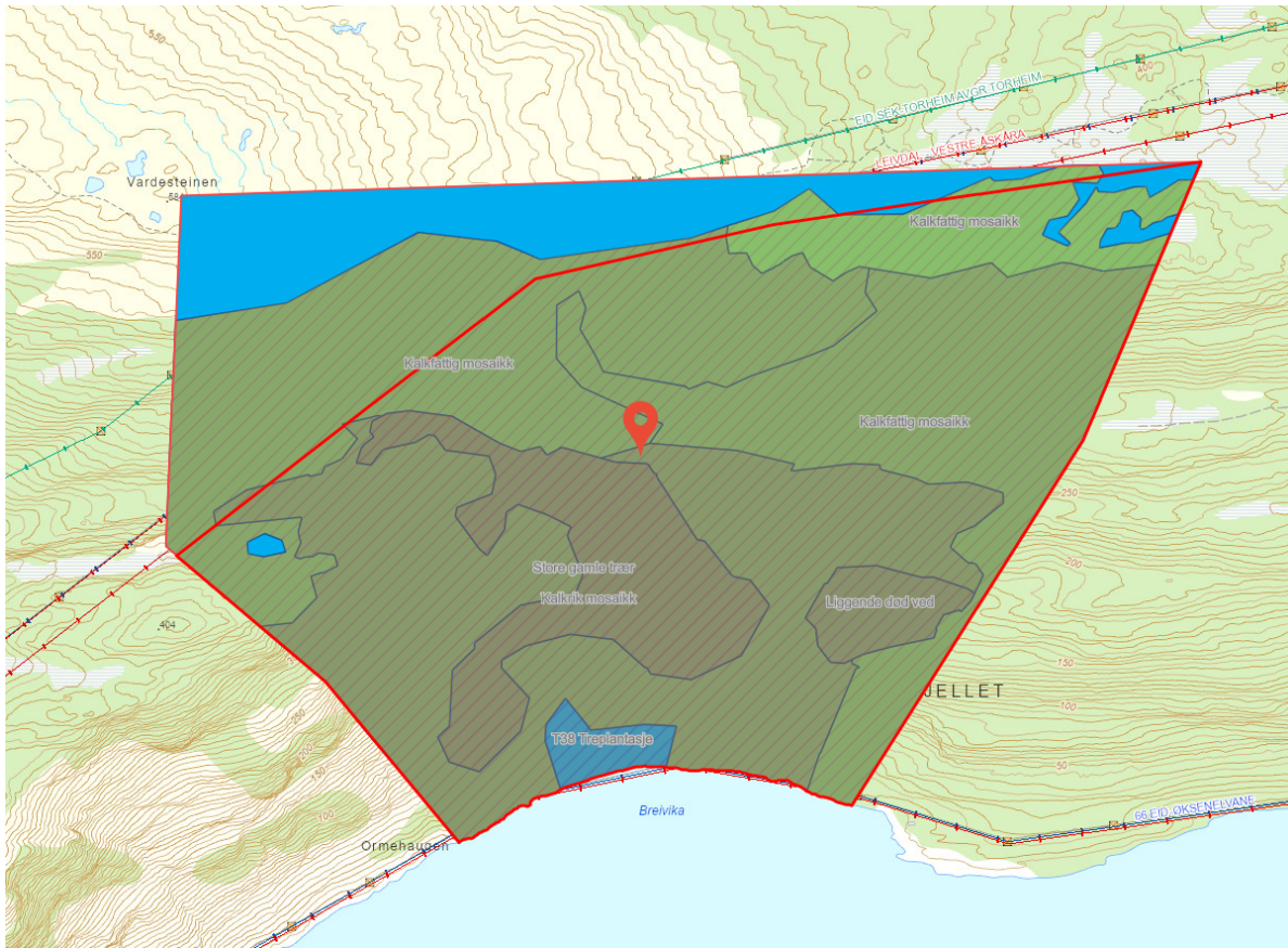
Figur 2 Den heildekkjande figuren syner tilbudsområdet til frivillig skogvern frå grunneigarane, det var då på 758 dekar. Kraftlinjene er markert i raudt og grønt, både i nord og i sør. Arealet innanfor den raudre streken er den arronderinga det vart meldt oppstart på. Det er no redusert ytterlegare i høyringsframlegget. Kjelde: fylkesatlas

I figur 2 (under) kan ein sjå heile det fargelagde arealet som tilbodet frå grunneigarane via AT Skog. Tilbudsarealet var opphavleg på 758 dekar. Av omsyn til kraftlinja reduserte vi arealet med 22 % før vi meldte oppstart av verneprosess, og meldte oppstart på eit areal på 590 dekar, området markert med raud kant. I kartet vedlagt oppstartsmeldinga er grensa til verneområdet markert om lag 10 meter sør for den nærmaste 420- linja for å ta omsyn til den.