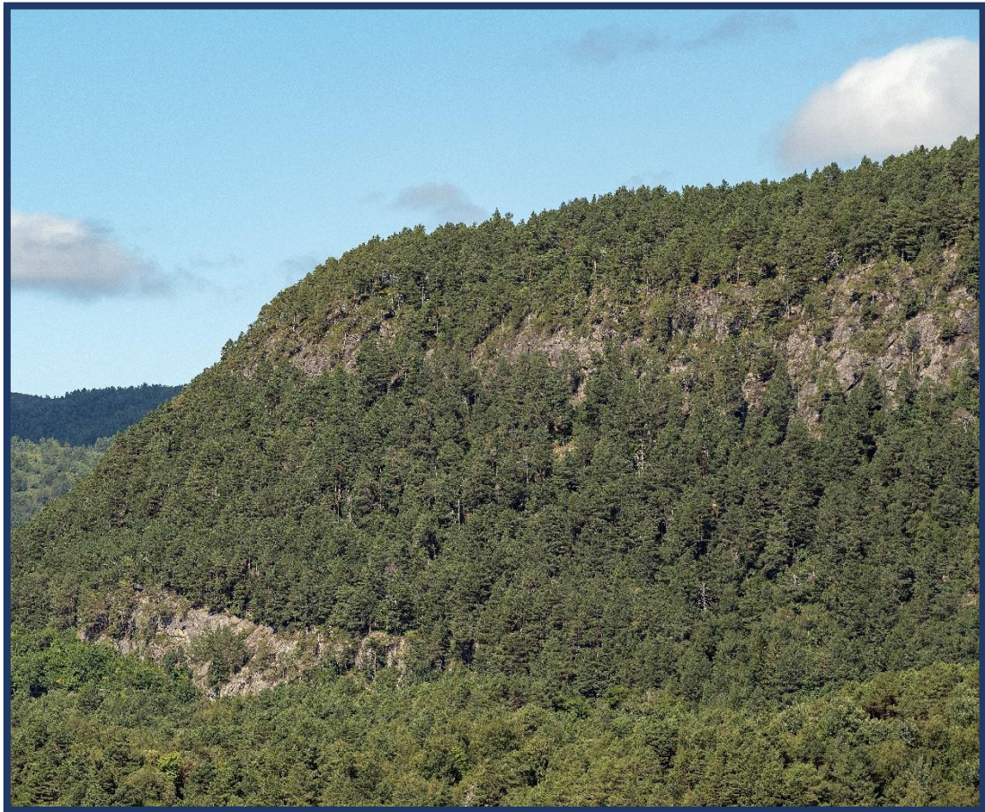
Gamal kystfuruskog ved Akslanakken sett mot vest.