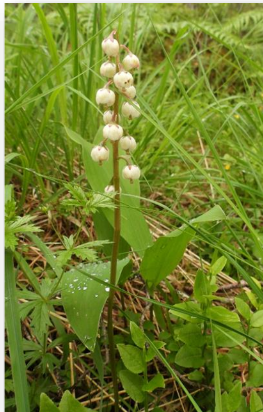
Bilde til venstre er sanikel Sanicula europaea . Til høyre er en lyngart av vintergrøn Pyrola . Dette er arter som kjennetegner lågurtvegetasjon.