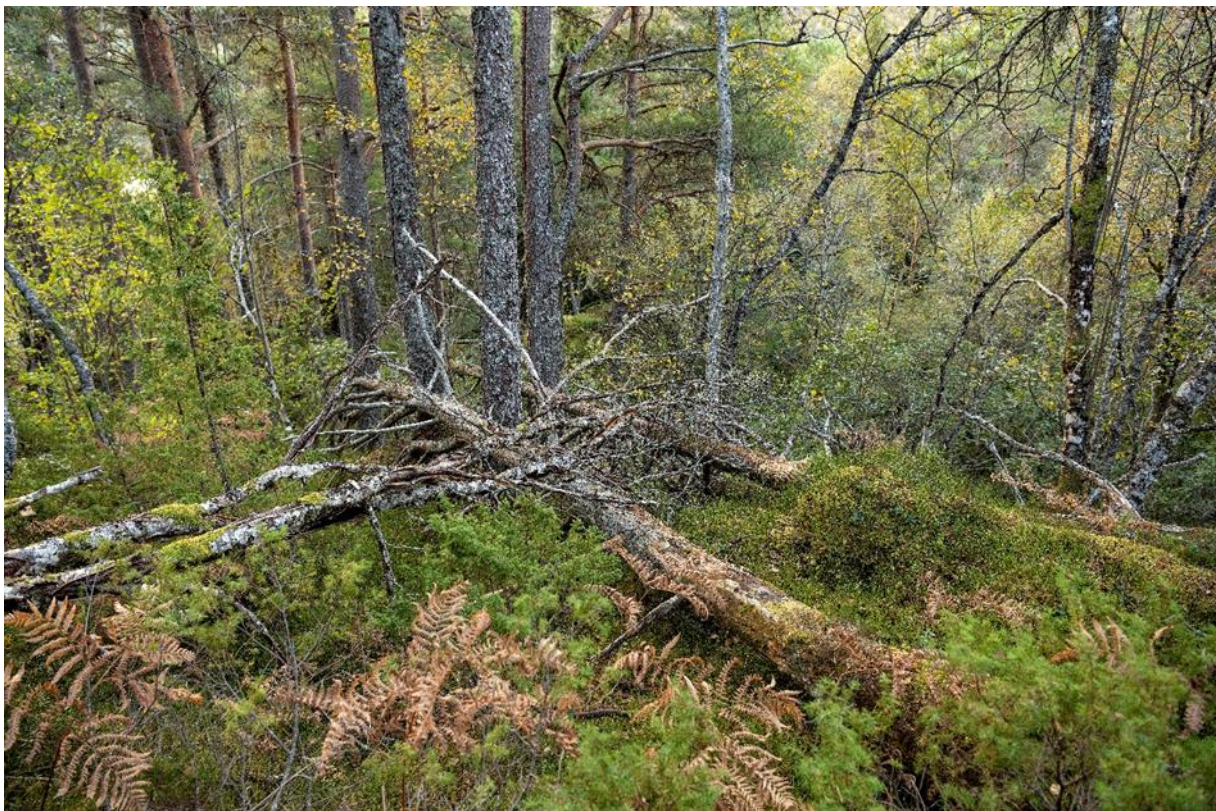
Furuskog i vestre del av område.

Treffes vedtak om reservat som krever aktive gjenopprettingstiltak, eller vedtak om reservat der bruk er en forutsetning for bevaring av det biologiske mangfold, skal det samtidig med vernevedtaket legges fram et utkast til plan for skjøtsel for å sikre verneformålet. Planen kan omfatte avtale om bruk av arealer, enkeltelementer og driftsformer. Planen eller avtalen kan inneholde bestemmelser om økonomisk kompensasjon til private som bidrar til områdetets skjøtsel.”