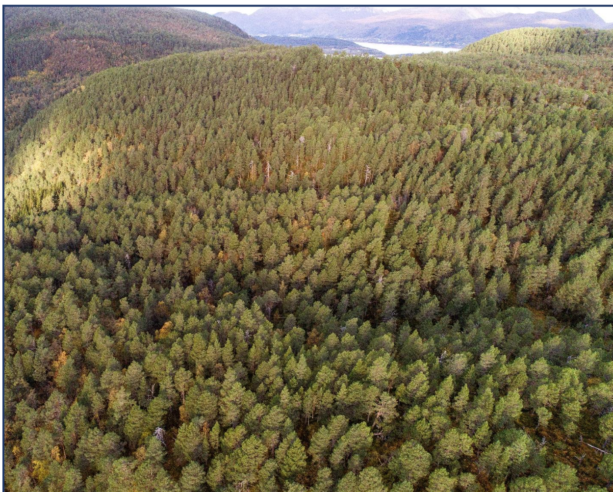
Gamal furuskog ved Skylegga sett mot vest.