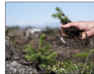
SITKASPIRE: Frå 2009 og utover brukte Statsforvaltaren mellom ein halv og ein million kroner årleg på å fjerne framande artar frå verneområdet i Møre og Romsdal. Nå har dei auka på til 3-4 millionar kroner per år.