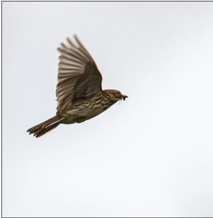
FANGST: Ei heipiplerke, her med fangst i nebbet. Alle nærbilete av fugl i denne reportasjen er tatt 16. juni 2021.