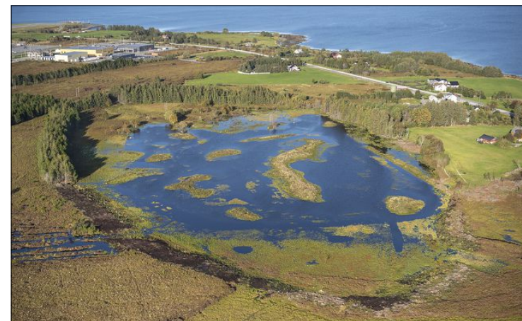
ETTER: I 2019 hadde Rørvikvatnet vorte eit vatn igjen på ordentleg og ikkje berre i namnet.

– Avinor trudde at meir fuglevil så nær opp mot flyplassen kunne kome til å forstyrre innflygingane. Det trudde ikkje Statsforvaltaren, og fuglane har heller ikkje vorte noko problem, seier Betten.