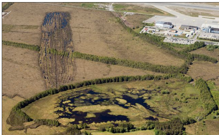
FØR: Slik såg naturreservatet ut i 2015.