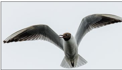
SÅRBAR FUGL: Hettemåka har status som sårbar på raudlista.

SPESIELT NABOSKAP: Her finst ikkje noko fugletårn, men dei som jobbar i flytårnet har iallfall godt utsyn over reservatet.