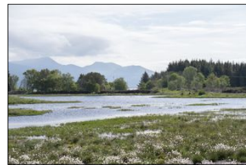
NÆR BUSTADER: NVE har konkludert med at demningane ikkje utgjør nokon fare for dei som bur nær reservatet.