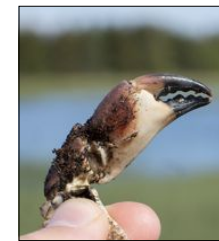
GOD MIKS: Krabbeskall, klør og fiskebein kan ein finne ved Rørvikvatnet.