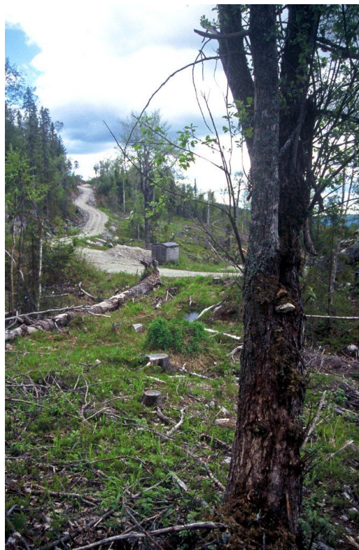
Nordlig aniskjuka ( Haploporus odorus ) i K12 Gråberglia 1999.