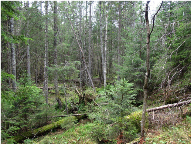
Gammel granskog nederst i kjerne 1.