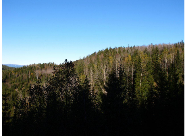
Sørvestsiden av Handklevassåsen sett fra sør; liseide med mye gammel osp.