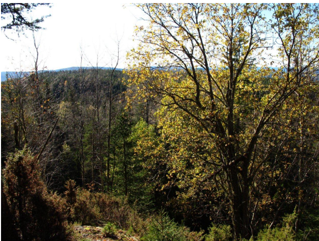
Området har uvanlig mye gammel selje, her fra K4 Gulmyråsen V.