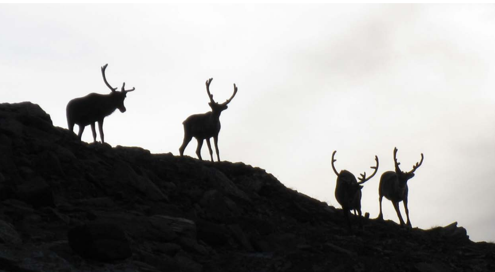
Rein i motlys, Istinden Balsfjord kommune.