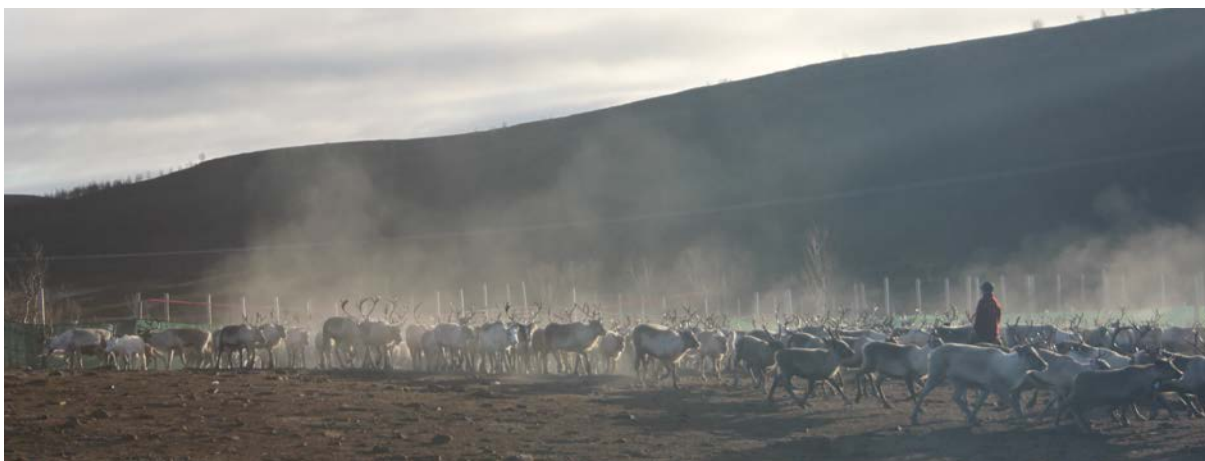
Rein i samlegjerde.