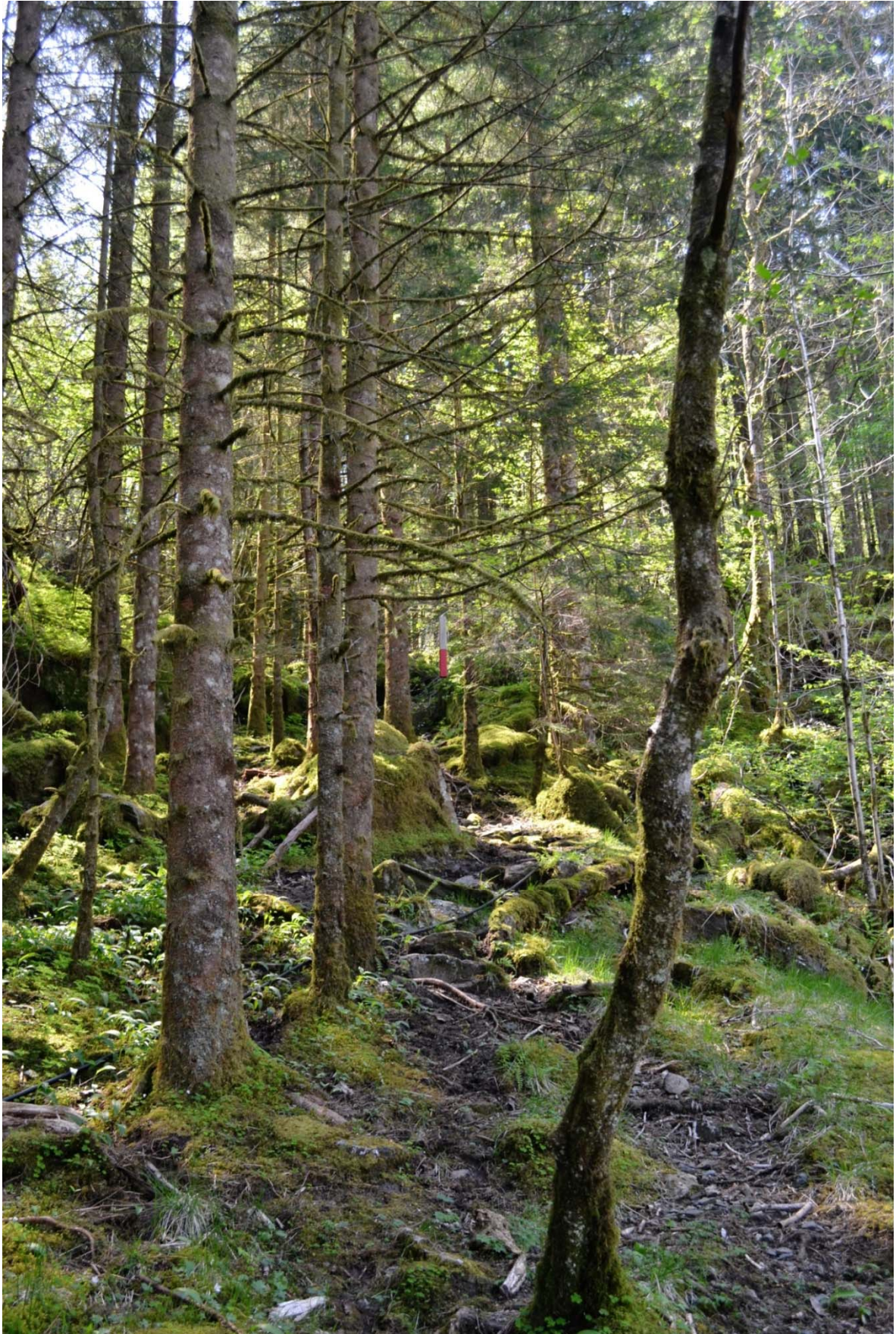
Stien frå Heltveit til Bjørge går igjennom eit granfelt. Foto: Jørgen Aarø, 24. mai 2012.