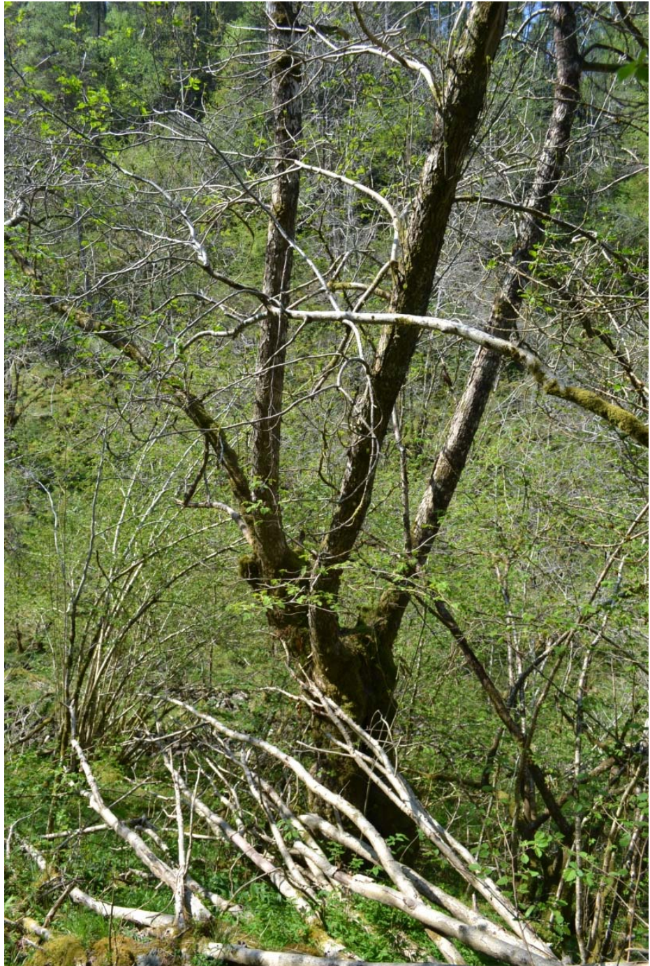
Dei styva askene ber preg av manglande skjøtsel, med grove greiner og mykje vegetasjon rundt trea. Foto: Jørgen Aarø, 24. mai 2012.

Det er nokre granbestand i området. I vår del av landet er gran eit innført treslag. Eitt felt står ned mot sjøen nord for Kvalvika og eitt i søkket der dei styva askane står. I tillegg står det litt gran i kantsoner vest og sør for reservatet.