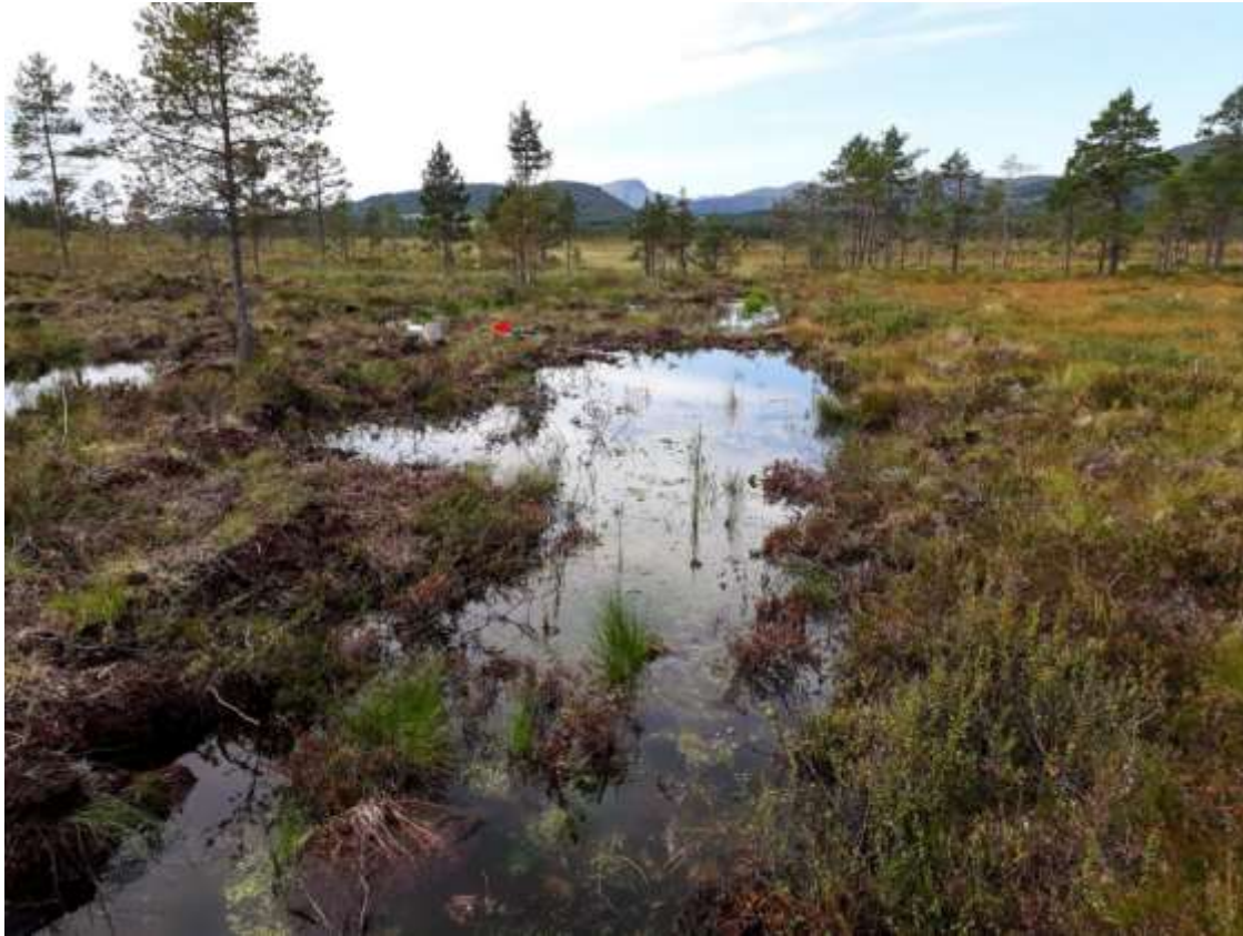
Fig. 11. Lok. 33 Pluggdam B SVf Damtjørna, sett mot nordøst.