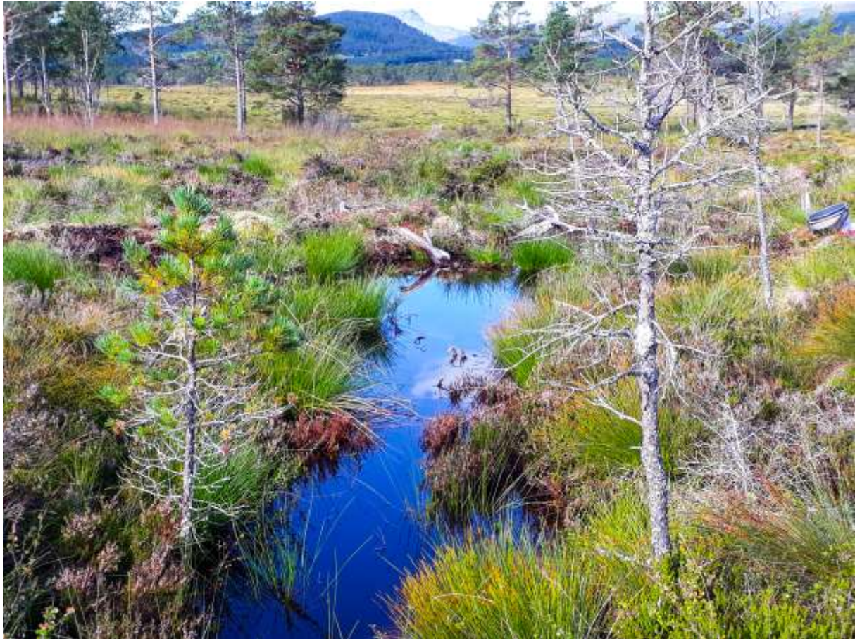
Fig. 10. Lok. 32 Pluggdam A SVf Damtjørna, sett mot nordøst.

Lok. 33 Pluggdam B SVf. Damtjørna minner også noe om lok. 11 Pluggdam Vf. Angviksetra. Omgivelsene er de samme som for foregående lokalitet (Fig. 11). Vannkvaliteten var enda mer ekstrem enn i pluggdam A, i det pH lå på maksimum 4.4 og fargetallet på hele 600. Imidlertid, også her var dyrelivet allerede ganske rikt. Øyestikkerfaunaen besto av et høyt antall Coenagrion hastulatum -larver og noen Libellula quadrimaculata -larver, og det fløy både Lestes sponsa , Aeshna juncea og Sympetrum danae ved lokaliteten.