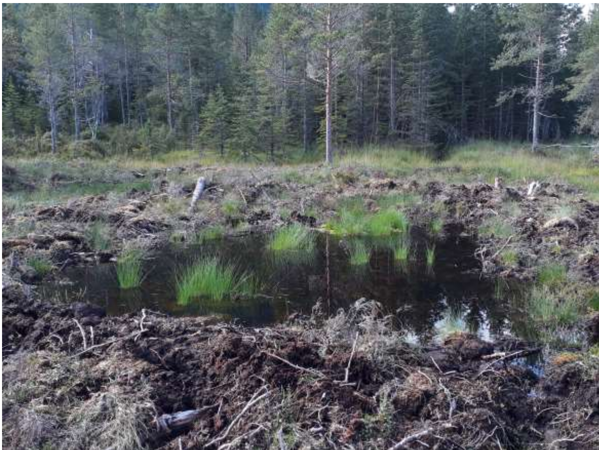
Fig. 8. Parti med dam i det nye pluggdamområdet SØf Grøntjørna, sett mot vest.

Av nebbmunner/teger fant jeg Gerris odontogaster , Notonecta lutea og minst én buksvømmer-art (bare larver ble registrert). Av biller ble det registrert både Acilius sulcatus og A. canaliculatus , men ingen mindre vasskalver eller andre biller.