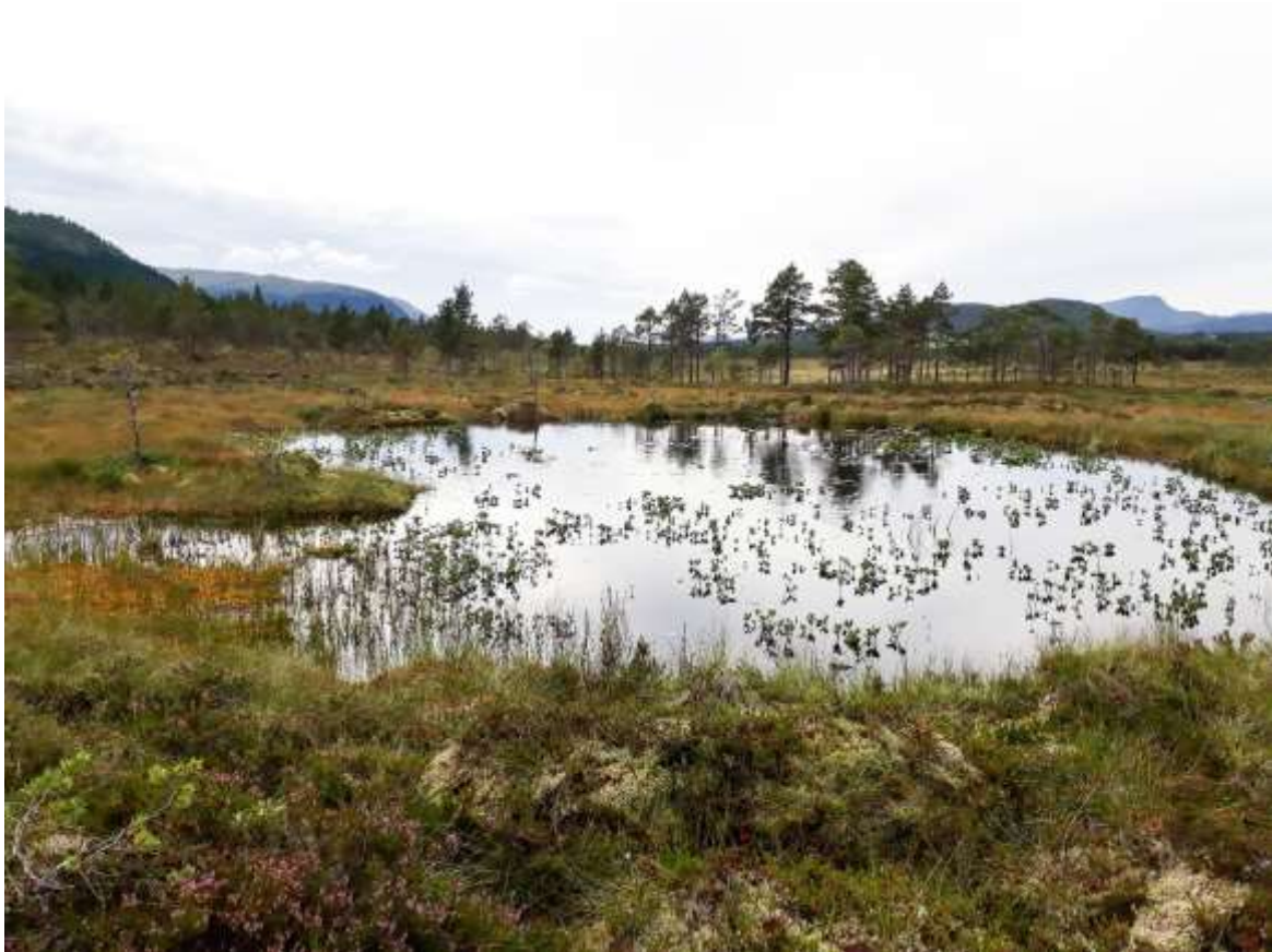
Fig. 9. Damtjørna ØSØf Grøntjørna, sett mot øst.

Vårfluene var representert med Holocentropus dubius og Agrypnia sp., og det ble fanget ganske mange svevemygg (Chaoboridae), både Chaoborus obscuripes og Ch. crystallinus . Bare én fjærmygglarve (Chironomidae) ble registrert. Som eneste lokalitet denne gangen ble det funnet en del vannmidd (Hydracarina). Totalt antall taxa registrert i tjørna i 2023 var 15.