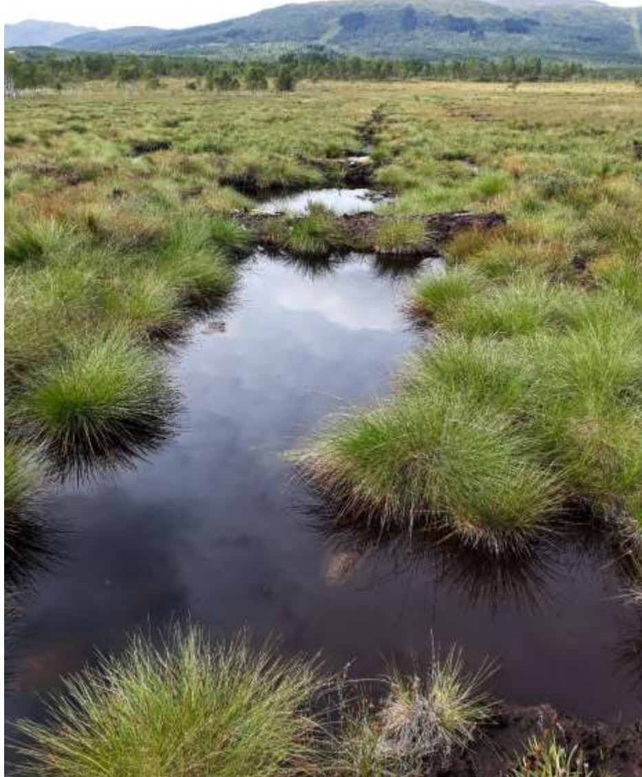
Fig. 5. Lok. 1 Pluggdam NVf Angviksetra (Sf. Grøntjørna), sett mot nord. Det var lite forandring å se på denne dammen i 2023.

Det ser ut til at nebbmunn/ tege-faunaen fortsatt er omtrent den samme som i 2019–2022, dvs. tre (sikre) arter: én vannløper ( Gerris odontogaster ) og to buksvømmere ( Sigara distincta og S. semistriata ) – og i omtrent samme lave antall. Tidligere er Hesperocorixa sahlbergi blitt påvist. Av billefamilien vasskalver (Dytiscidae) ble det i 2023, som i 2022, bare registrert larver av underfamilie Colymbetinae, noe som sannsynligvis er Ilybius aenescens , en art som også tidligere er funnet både i denne pluggdammen og i andre dammer på myra. Men også en vasskjær (Hydrophiloidea) ble denne gang registrert, nemlig den lille Anacaena lutescens . En ubestemt larve av denne billegruppa (vasskjær) ble registrert i 2022. Antall billearter har hele tida vært lavt i Pluggdam 1, men det kan se ut til at billefauaen etter hvert har gått ytterligere tilbake. Følgende arter er ellers tidligere blitt påvist, de fleste i 2019: Hydroporus obscurus , Acilius sulcatus , A. canaliculatus og Dytiscus marginalis (larve). De sistnevnte artene er nokså store og trives ikke like godt i så små dammer som det her er snakk om.