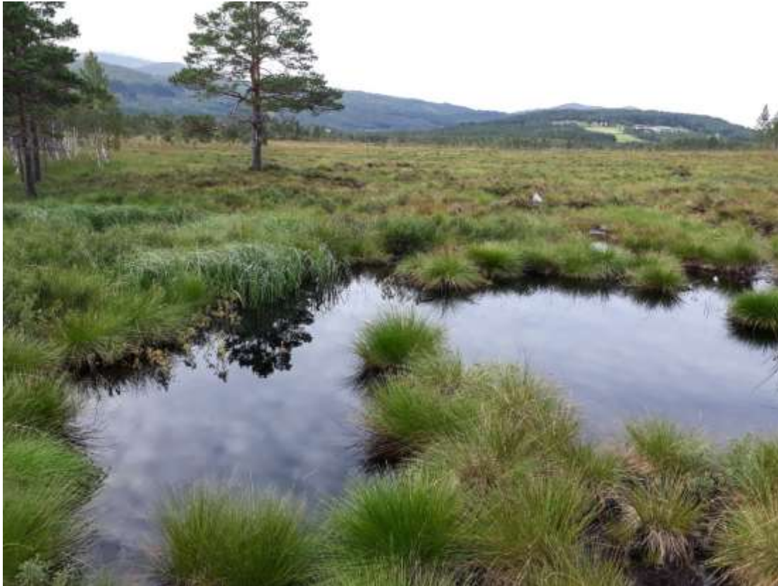
Fig. 6. Lok 2b Pluggdam NVf Angviksetra/ Sf Grøntjørna i 2023, sett mot nord. Denne dammen synes å gro sakte igjen.