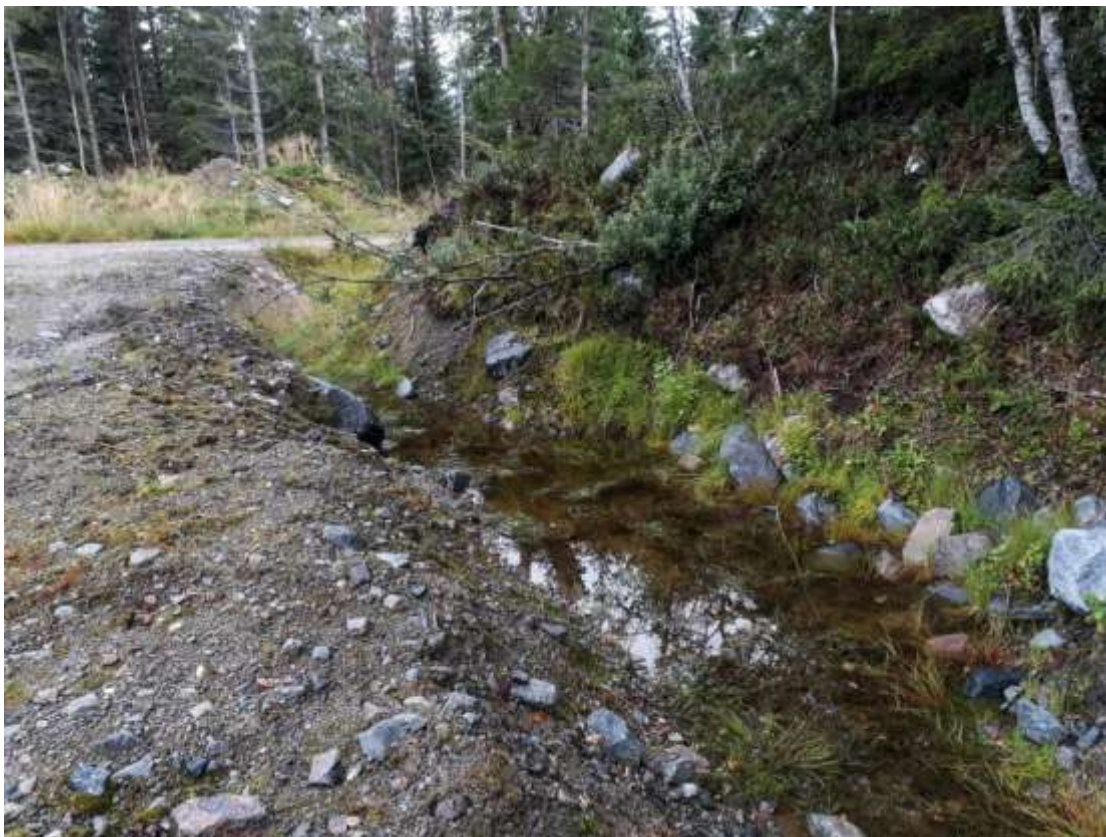
Fig. 12. Lok. 34 Veggrøftdam ved parkeringsplassen Angviksetra.