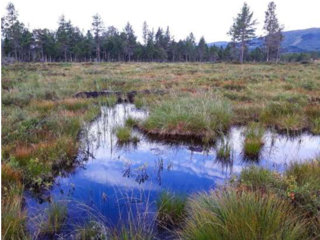
Fig. 7. Lok. 11 Pluggdam Vf Angviksetra, sett mot vest.