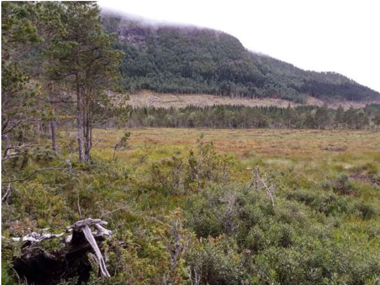
Fig. 2. Pluggdamsområdet NVf Angviksetra, (Sf Grøntjørna), sett mot sørvest fra der stien fra Angviksetra møter myra.

Undersøkelsene gjennom alle fire år tok sikte på å få en oversikt over noe av dyrelivet i dammer og tjern på Aspåsmyran. Samtidig ville en gjerne se på hvilke forandringer av det helt lokale dyrelivet restaureringsarbeidet hadde hatt, med sammenlikninger både med de drenerte grøftene og med uberørte ferskvannslokaliteter på myra. For 2023 var det ønskelig med videre kartlegging av ferskvannsdyr og herptiler innafor verneområdet, med samme metodikk som tidligere, slik at resultatene fra de ulike åra kunne sammenlignes. Samtidig var det vinteren 2022/23 utført plugging av ytterligere dreneringsgrøfter, i et nytt område, øst for det gamle. Noen slike dammer skulle også inkluderes i prosjektet.