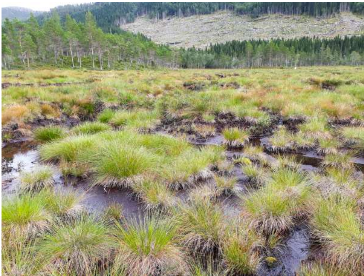
Fig.4. Noen steder hadde vannet (i 2022) brutt gjennom pluggene og dammene var nesten tørrlagte.

Av øyestikkere ble det i 2023 påvist larver av de samme artene som tidligere: Coenagrion hastulatum (i høyt antall), Aeshna juncea , Libellula quadrimaculata og Leucorrhinia dubia , men ikke Sympetrum danae . Heller ikke imagines av Lestes sponsa og Sympetrum danae ble observert. Det er nå imidlertid akkumulativt påvist sju øyestikkerarter i denne/ disse dammen(e), både i 2019, 2020 og 2021 (de samme artene) og ytterligere en art i 2022. De er alle relativt vanlige, men for 30–40 år sia (som nevnt i tidligere rapporter) var L. sponse svært sjelden nordafjells (Aagaard & Dolmen 1971).