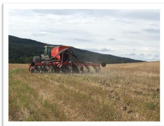
direktesåing, Nome kommune