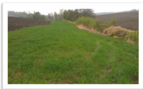
grasdekt kantsone, Horten kommune

Tiltaket kan overlappe med § 21 «ingen jordarbeiding om høsten».