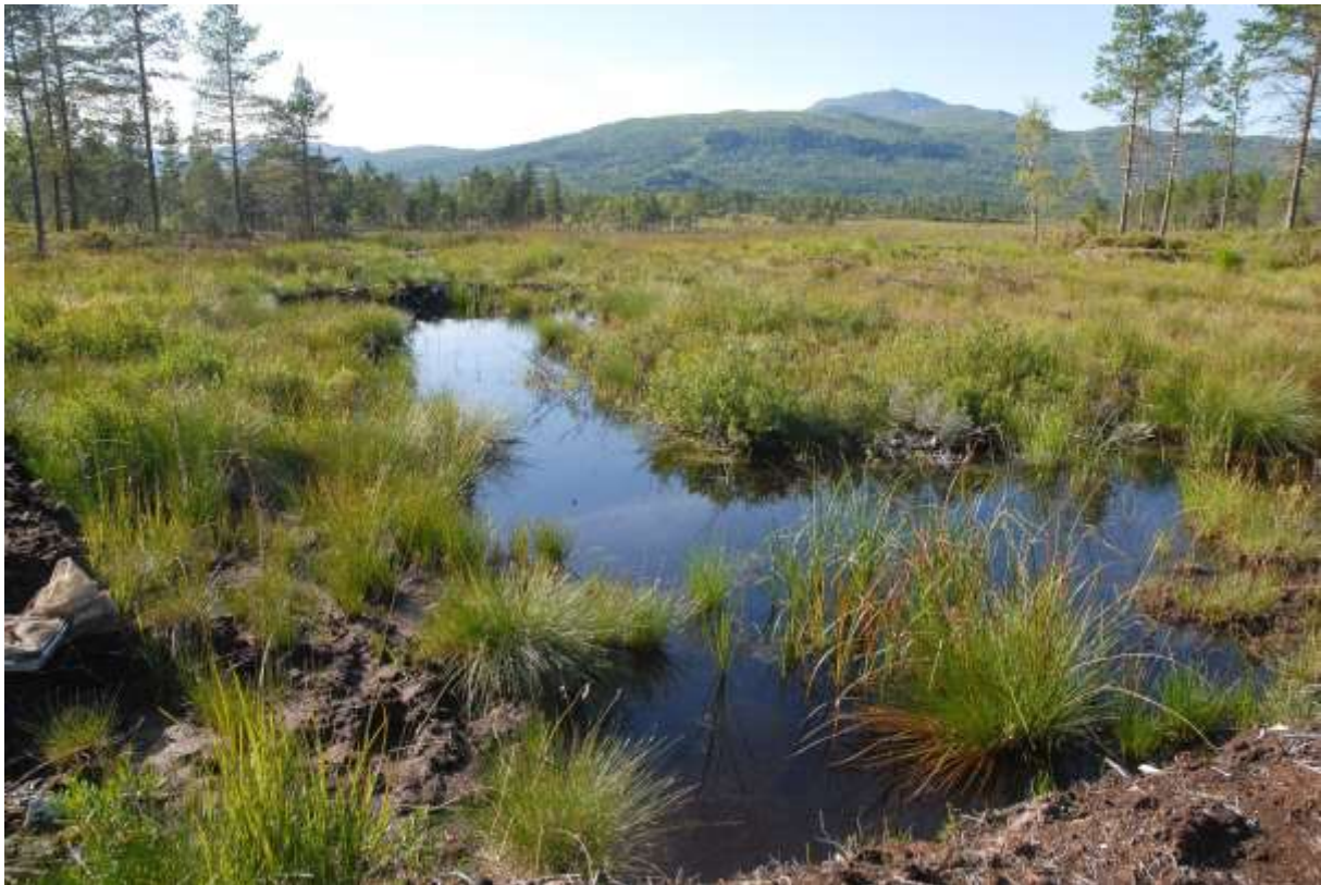
Fig. 8. Pluggdam 11 i Pluggdamområdet vest for Angviksetra, sett mot vest.

11 Pluggdammer Vf Angviksetra. Dammene her er av en litt annen morfometrisk karakter enn de nordvest for Angviksetra; mange av dem er lange vannfylte grøfter (Fig. 8). Men ellers likner de pluggdammene NVf Angviksetra. Vannet var brunfarget og vegetasjonen sparsom. Undersøkelsene ble foretatt litt seint på ettermiddagen, men ennå fløy øyestikkerne Lestes sponsa og Aeshna juncea . En eggleggende hunn av Somatochlora metallica ble observert i damkanten. Det ble funnet larver av ytterligere arter: Coenagrion hastulatum , Leucorrhinia dubia og Sympetrum danae . I 2019 var også Libellula quadrimaculata blitt observert. Til sammen gir dette hele sju arter. Med liknende miljø var resten av faunaen også omtrent som i dammene nordvest for Angviksetra.