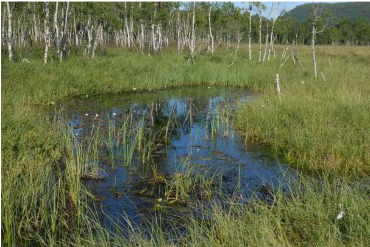
Fig. 17. Dammer SVf Langneslonet, sett mot nordøst.

19 «Langnestjønna» VSVf Junen. Langnestjønna (Fig. 19) ligger sørøst for foregående lokalitet og har mer diffus forbindelse med elva. Dette er også ei vakker tjønn, med myr/ starrkant og flyteøyer. Hvite nøkkeroser vokser over det meste av tjønna. Det finnes ganske sikkert 3-pigga stingsild, og trolig også ørret, men faunaen var relativt god. Av flygende øyestikkere ble det registrert noen individer av Lestes sponsa , men i tillegg larver av Coenagrion hastulatum , Aeshna juncea , Ae. grandis , Cordulia aenea og Leucorrhinia dubia . En buksvømmer Sigara semistriata og en liten vasskalv Hydroporus obscurus ble likeledes funnet.