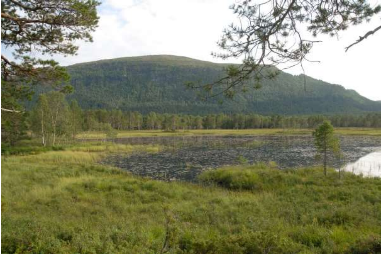
Fig. 23. Motjørna, sett mot sør.