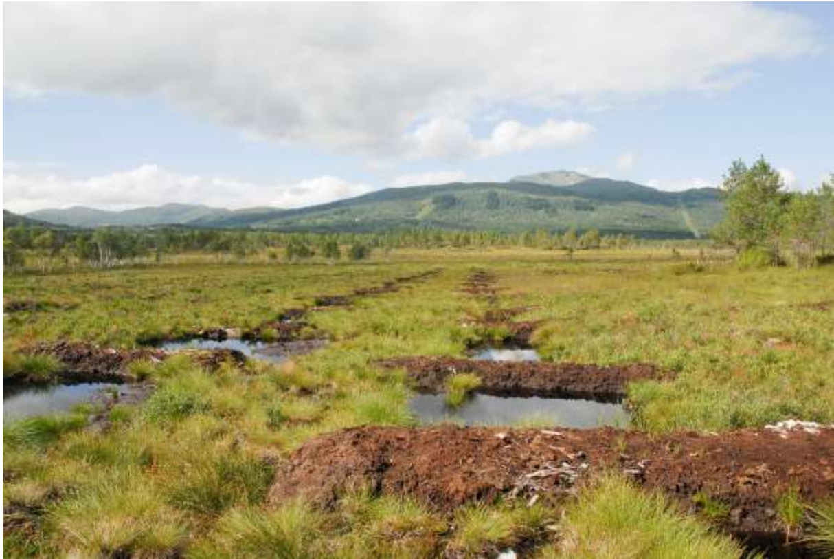
Fig. 2. Pluggdammer NVf Angviksetra (og Sf Grøntjørna), sett mot nord.

I 2020 var det av interesse å få undersøkt noen av de samme dammene (spesielt pluggdammene) som ble undersøkt året før, men denne gang seinere på sommeren. Samtidig skulle en kartlegge faunaen i dammer og tjørner mer sentralt og på nordlige deler av myra, med samme metodikk som i 2019.