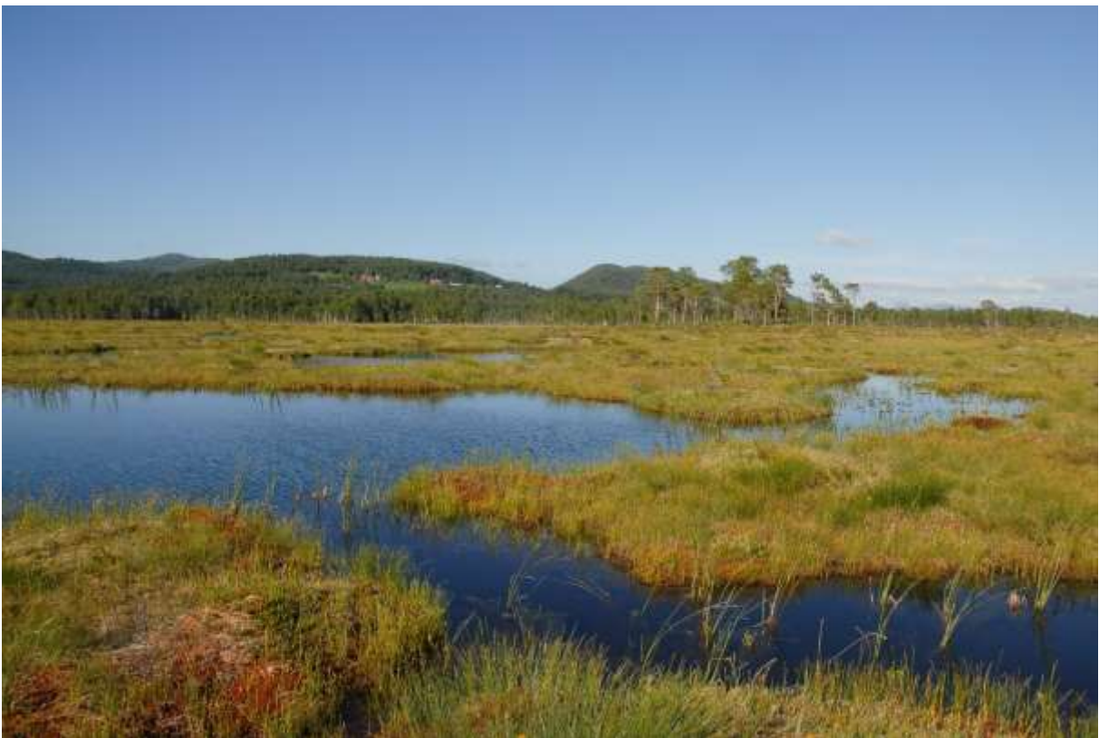
Fig.6. Dammer NØf Dødisgropa, sett mot nordøst.