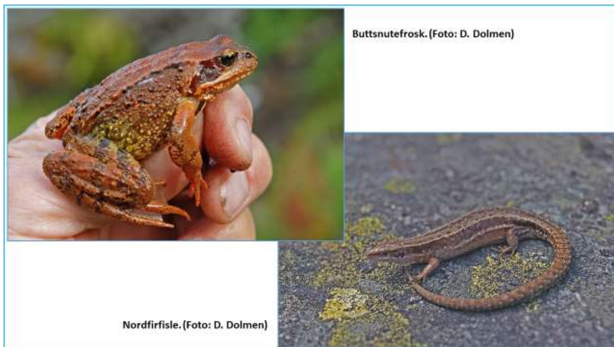
Fig. 25. Herptiler funnet på Aspåsmyran.