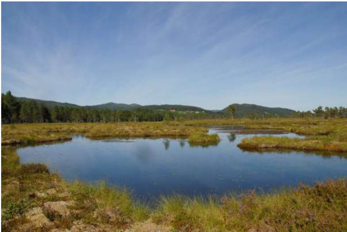
Fig. 20. Stuegolvtjørna, sett mot nordøst.

Tjørna hadde en relativt høyt arts mangfold. Og det ble konstatert høy tetthet av småkreps. Øyenstikkerfaunaen var ganske rik, med mange observerte flygende Lestes sponsa , Enallagma cyathigerum og Aeshna juncea , samt noen Sympetrum danae . Av larver ble det i tillegg påvist Aeshna caerulea , Codulia aenea og Sympetrum danae . Dette gir sju arter. Av nebbmunner ble det registrert vannløperen Gerris lacustris og ryggsvømmeren Notoneta lutea , samt buksvømmerlarver Corixidae indet., av biller Colymbetinae-larver, dessuten Acilius sulcatus og Gyrinus minutus . Det ble også funnet fjærmygglarver.