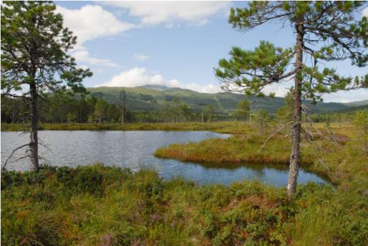
Fig. 5. Dødisgropa, sett mot nord.