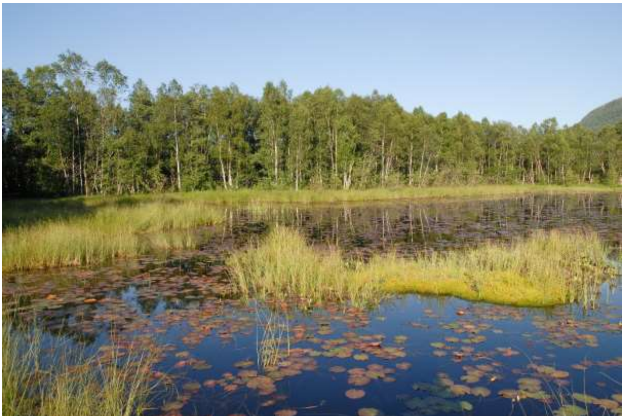
Fig. 19. Langnestjørna VSVf Junen, sett mot sørøst.