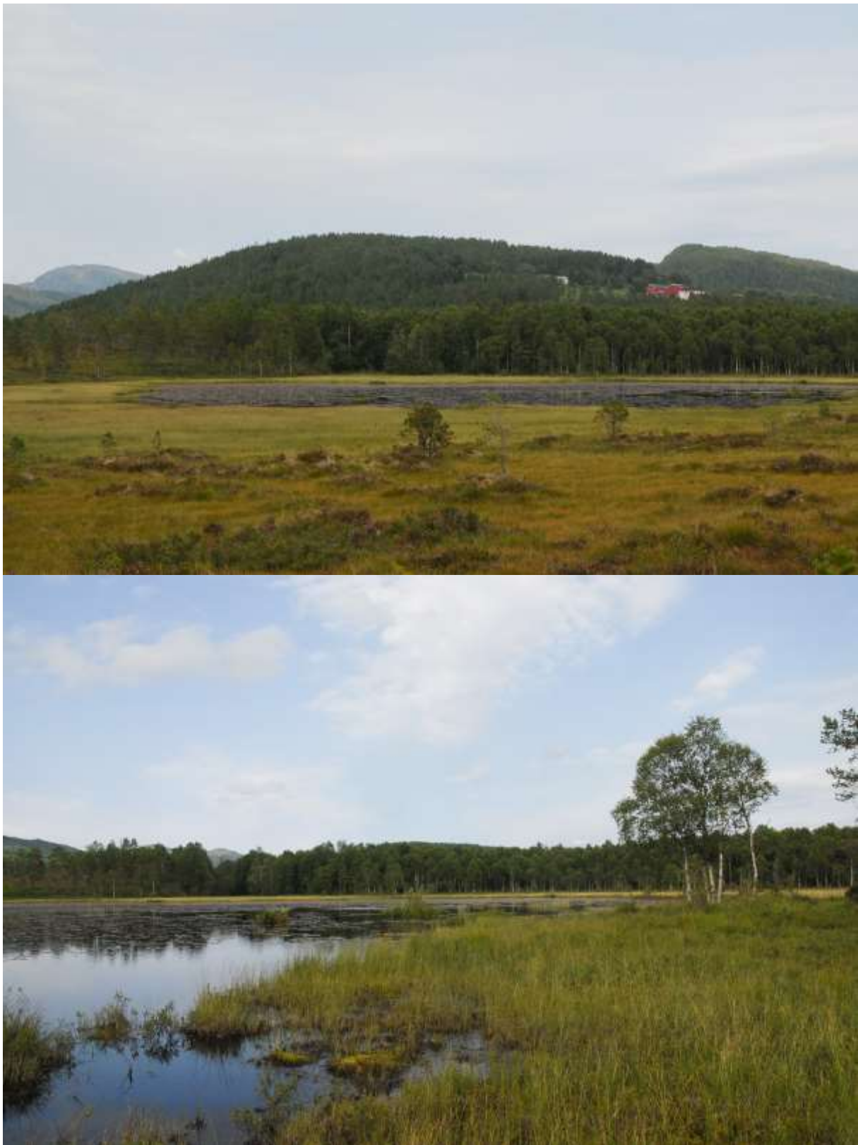
Fig. 21 (a og b). Mobergtjørna, sett mot nord og mot nordøst.