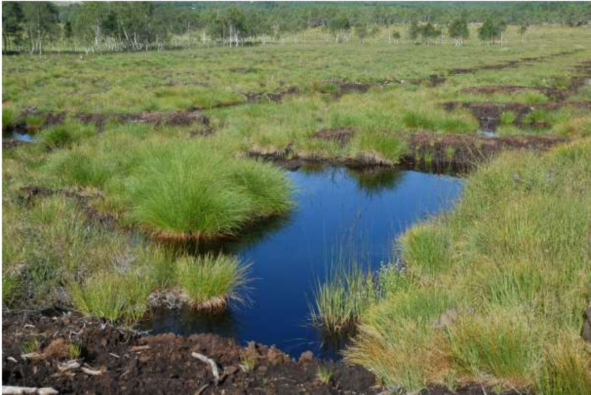
Fig. 3. Pluggdam 1, NVf Angviksetra, sett mot nordvest.