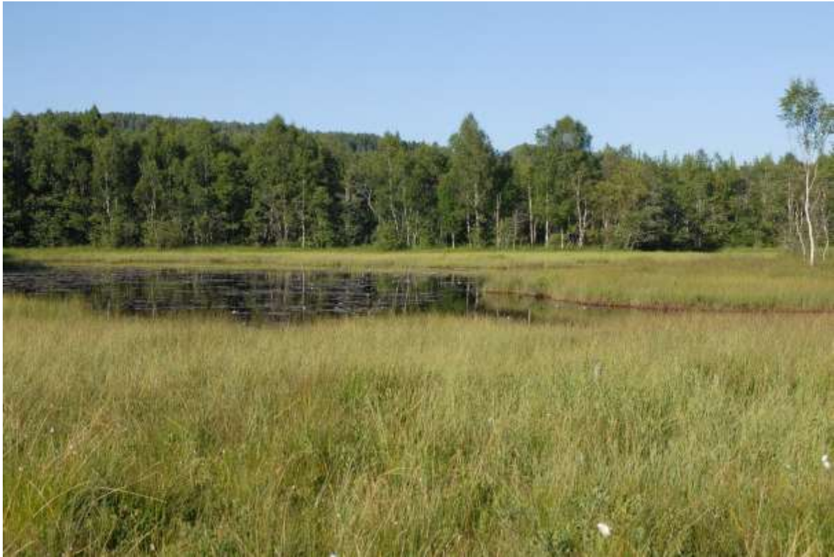
Fig. 18. Langneslonet, sett mot nordøst.