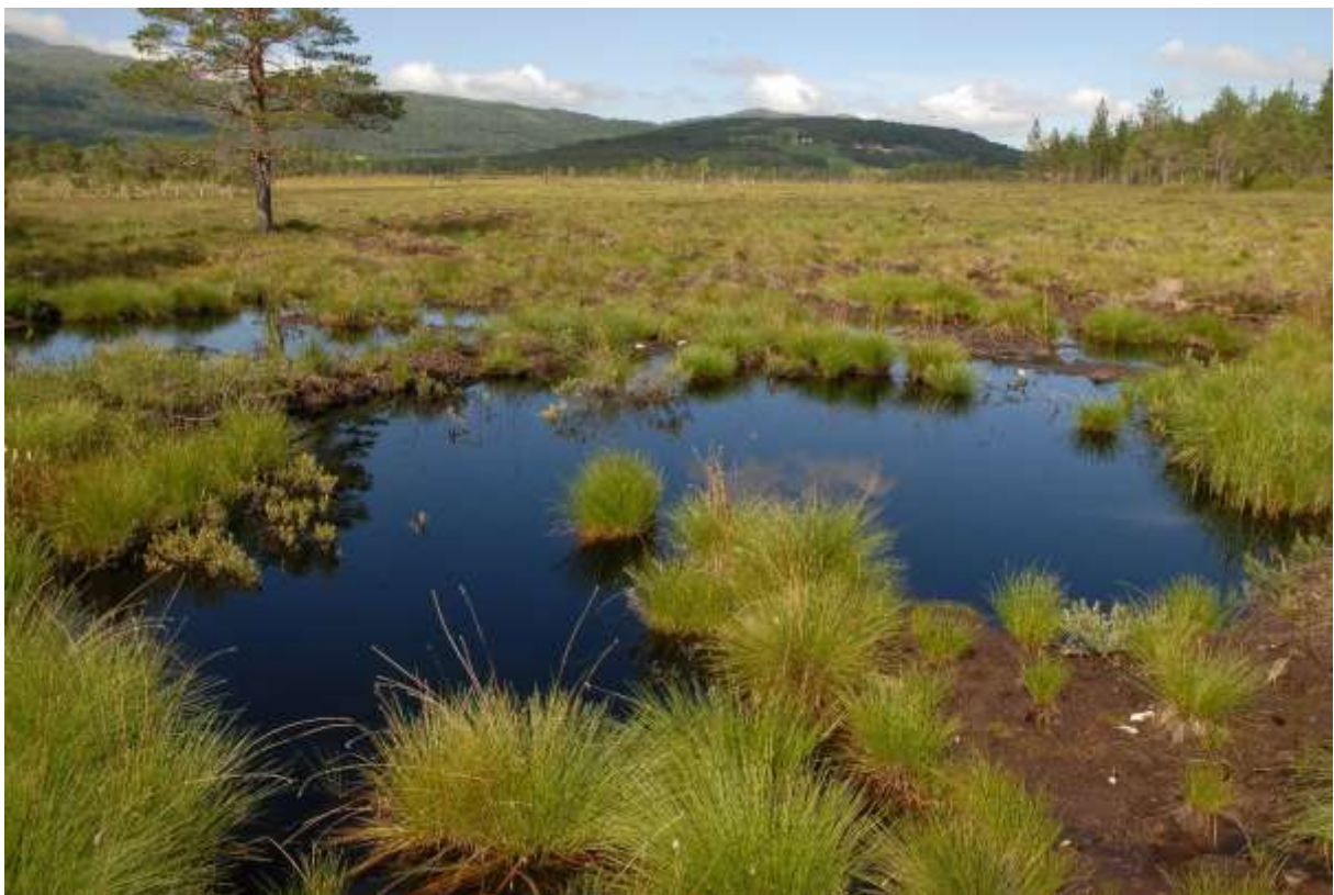
Fig. 4. Pluggdam 2b NVf Angviksetra/ Sf Grøntjørna, sett mot nord.