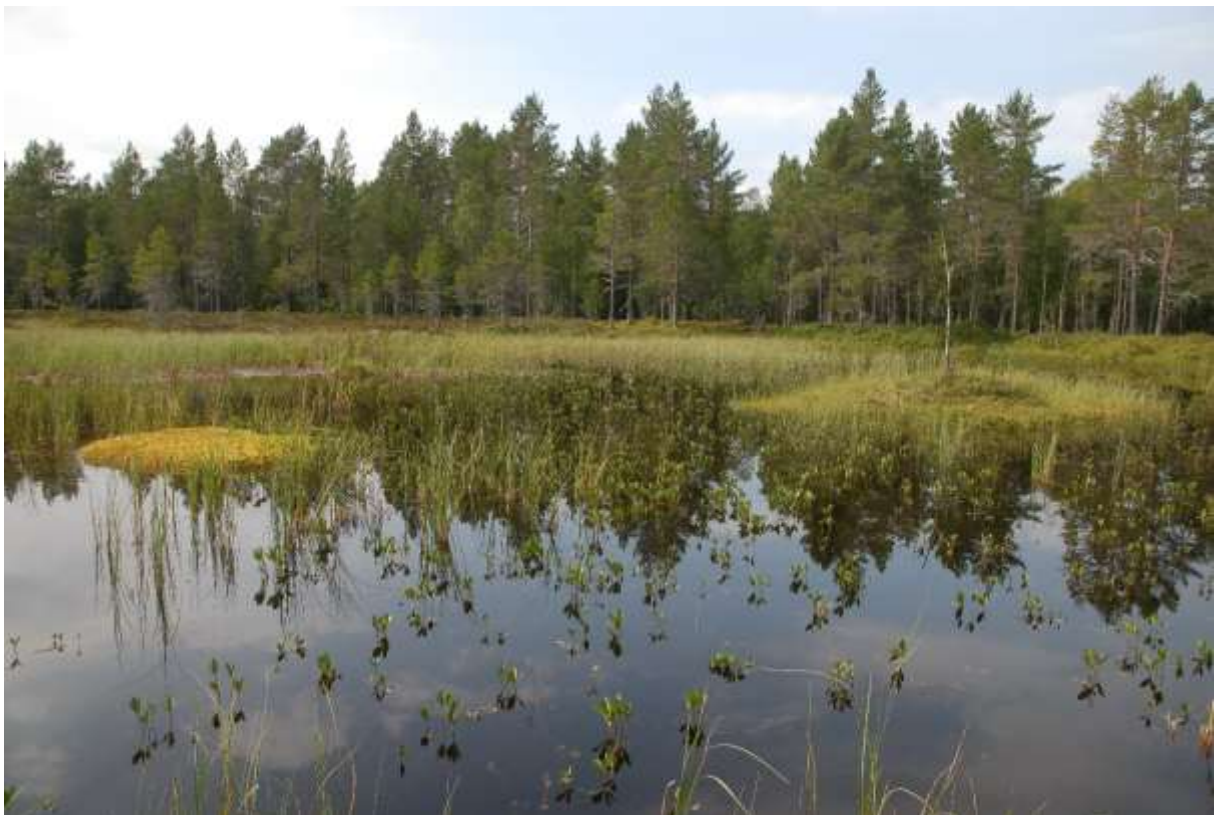
Fig. 9. Åbakktjørna ØNØf Øyan, sett mot nordvest.

14 Dam NVf bekkekryss NVf Pluggdamområdet. Dette er en bekkedam (utvidelse av en bekk) på myr, med lite kantvegetasjon. Det ble observert øyestikkerne Coenagrion hastulatum og Libellula quadrimaculata .