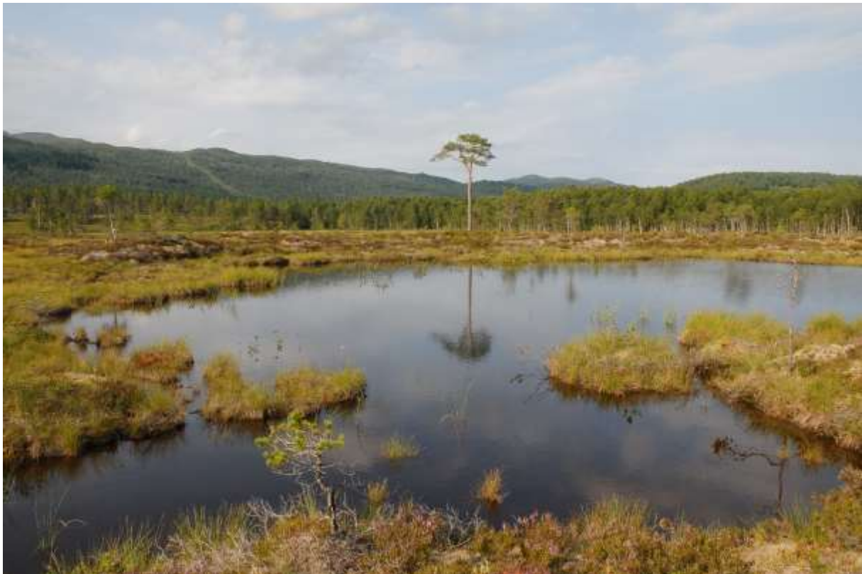
Fig. 22. Mellomtjørna Nf Motjørna, sett mot nord.

Her finnes helt sikkert 3-pigga stingsild og ørret, uten at dette ble påvist. Av flygende øyestikkere ble det registrert 6–7 arter: Lestes sponsa (mange), dessuten Enallagma cyathigerum , Aeshna juncea , Ae. grandis , (mulig) Somatochlora metallica , Sympetrum danae (mange) og Libellula quadrimaculata . Faunaen ellers syntes fattig.