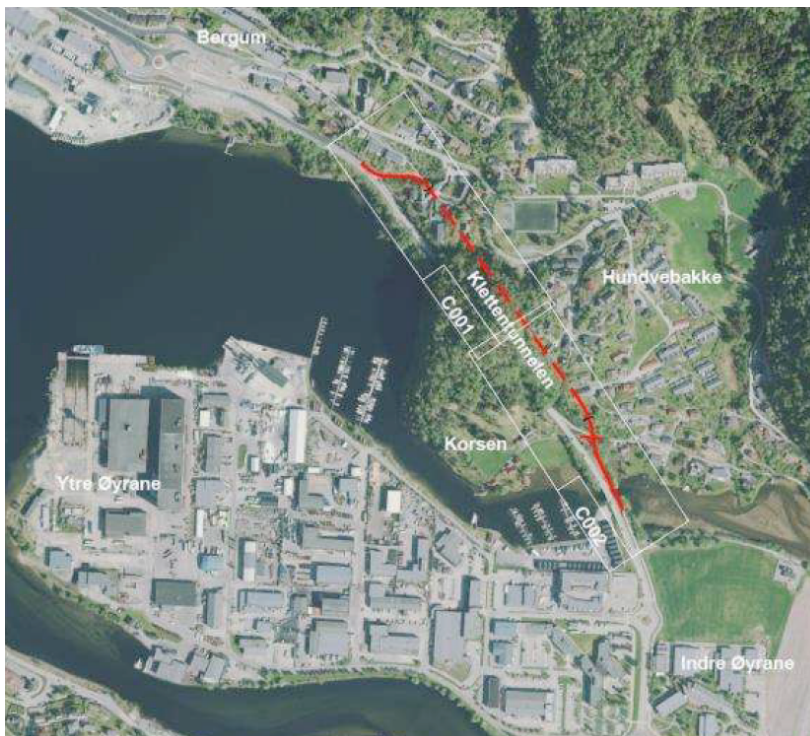
Figur 1. Oversiktskart som viser planområdet ved fjellpartiet Kletten i Førde.

Det skal byggjast 430 meter gang- og sykkel tunnel gjennom fjellpartiet Kletten i Førde. Utbygginga er en del av Førdepakken, og har som hovudformål å betre framkjømda for gåande og syklande.