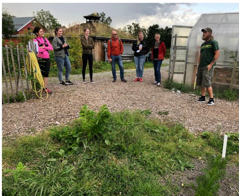
Samling ved Voll gård – kompetansesenter for urban dyrking