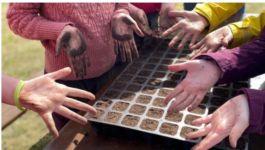
Skolehageprosjekt Lerflaten gård, Trondheim

Noen kommuner har plantet bærbusker og frukttrær i parker og andre offentlige områder. Det finnes altså mange gode eksempler som kan være til inspirasjon og nytte for andre som ønsker å starte med dyrking, enten målet er det sosiale, læring eller næring.