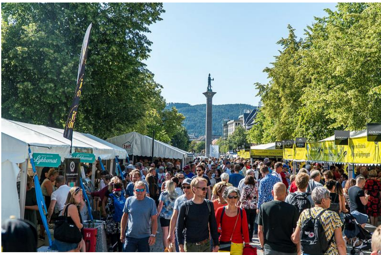
Trøndersk Matfestival i Trondheim