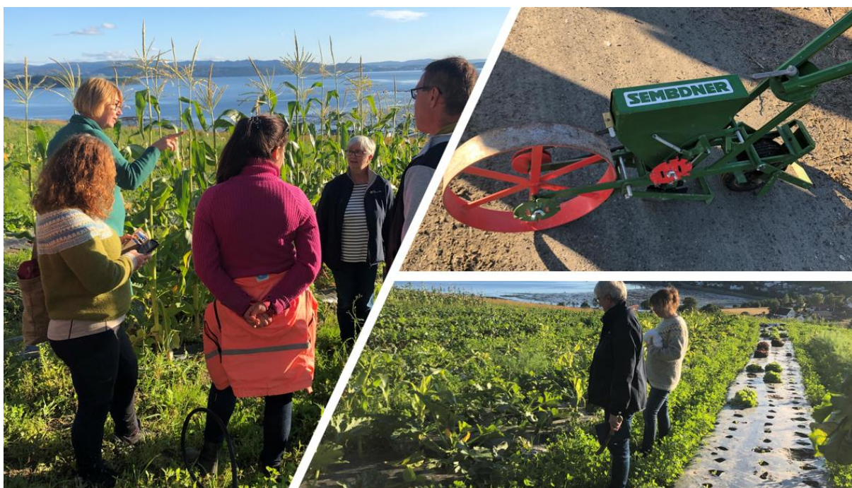
Inspirasjonssamling ved Støre Valen, Røra

Enkelte tiltak og aktiviteter kan gjennomføres uten store ekstra kostnader, mens andre vil kreve ekstern finansiering. Det vil bli en del av arbeidet med handlingsplanen å prioritere, søke nødvendige midler der det trengs, og tilpasse gjennomføringen til tilgjengelige ressurser.