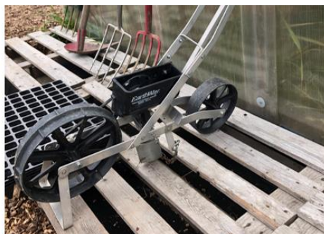
Aktivitet ved Voll gård – kompetansesenter for urban dyrking, Trondheim