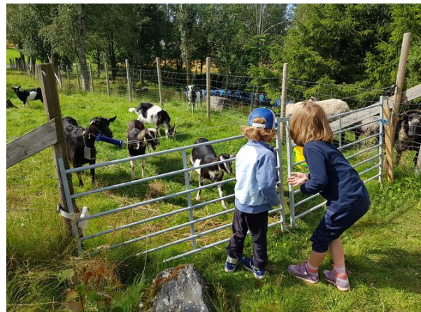
Bilder tatt i forbindelse med Trøndersk Matfestival – Et sted nær deg