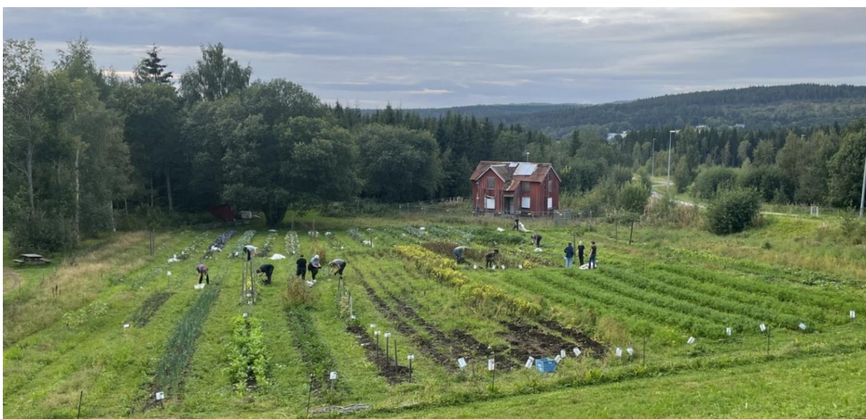
Dugnad ved andelslandbruket på Egge Museum, Steinkjer