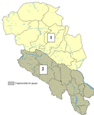
Kart med jaktområdeinndeling.

Roviltnemnda mener at hunndyrkvoten kan økes fordi familiegrupper er unntatt jakta og at de fleste ynglingene er i beiteprioritert område, som er område 1. Derfor trengs det en sterkere regulering der i forhold til område 2, som er gaupeprioritert område.