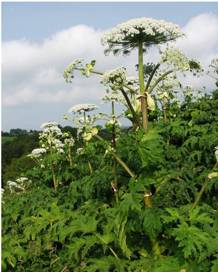
Foto: Kjempebjørnekjeks.