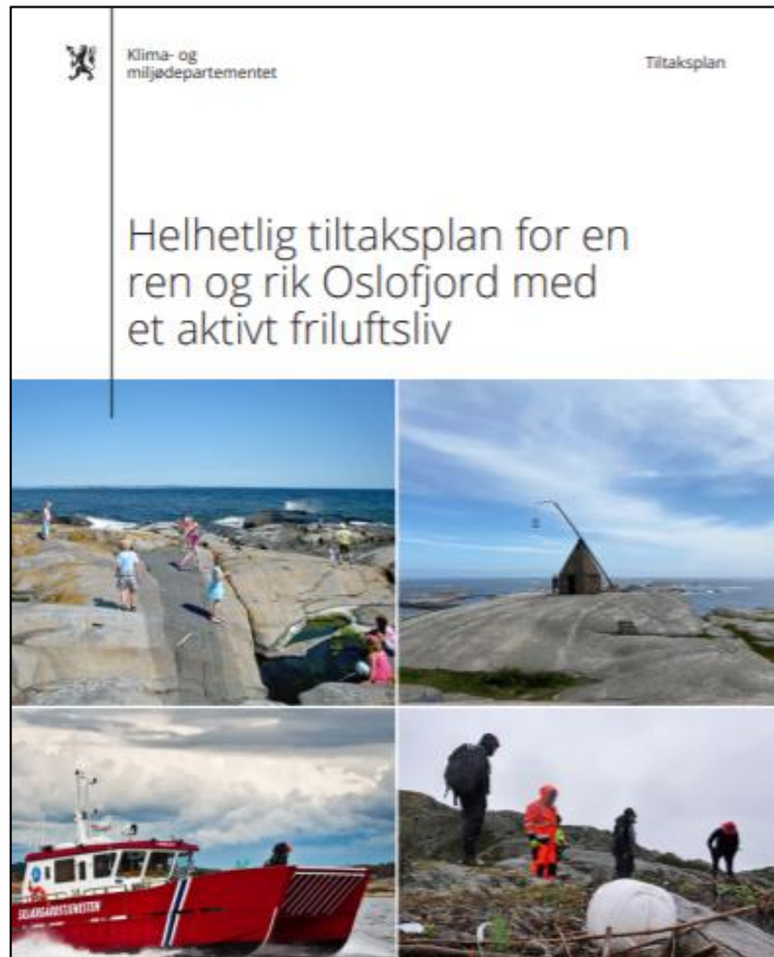
Foto: Helhetlig tiltaksplan for en ren og rik Oslofjord med et aktivt friluftsliv (forside)