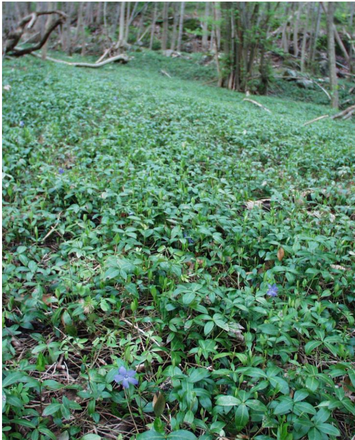
Foto: Gravmyrt. . Fotograf: Gunnar Bjar, Statsforvalteren i Oslo og Viken