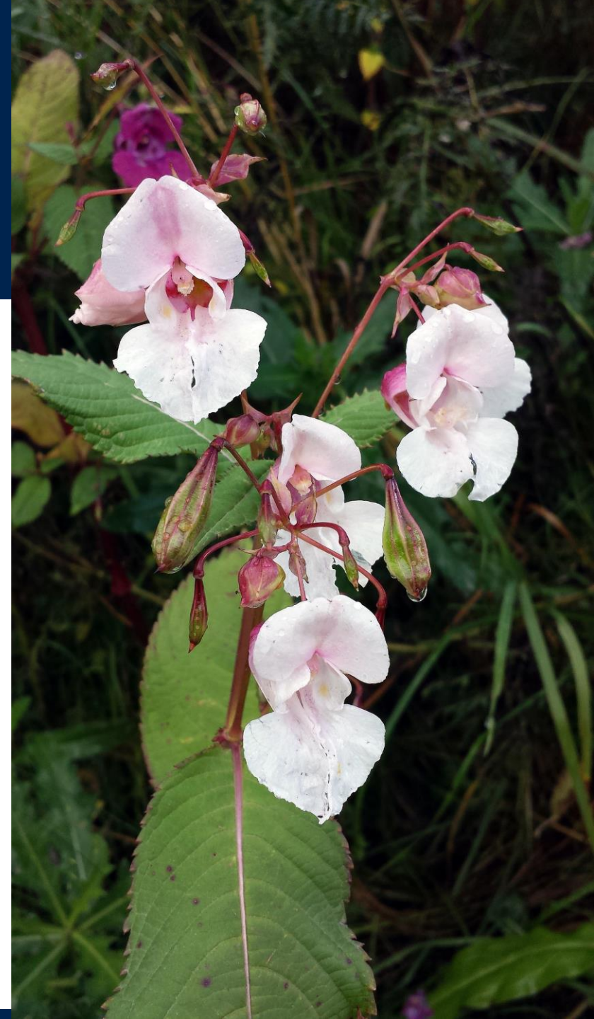
Foto: Kjempespringfrø.