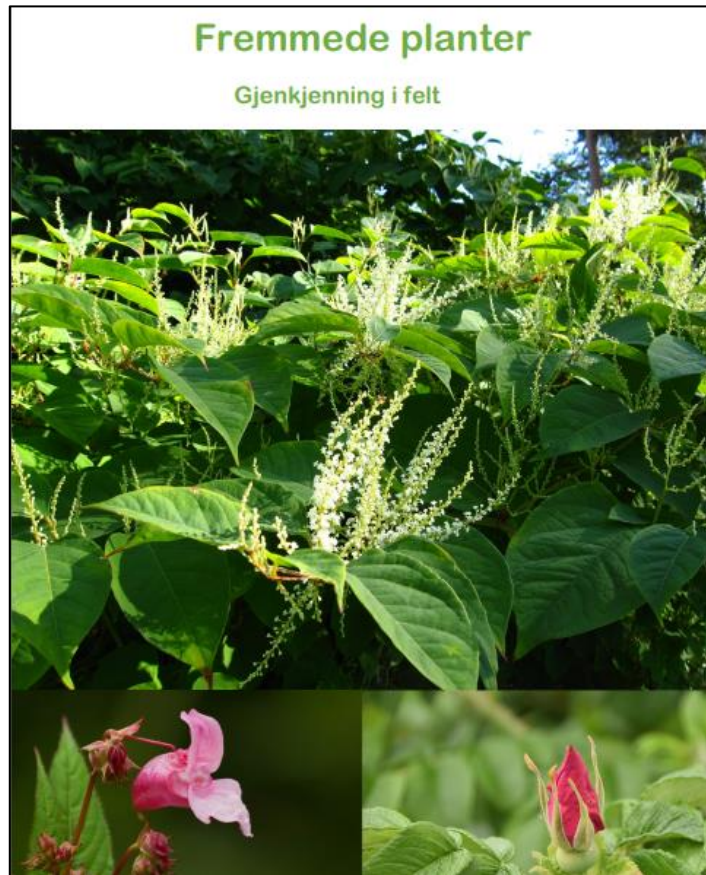
Foto: Forside av håndboken «Fremmede arter – gjenkjenning i felt»