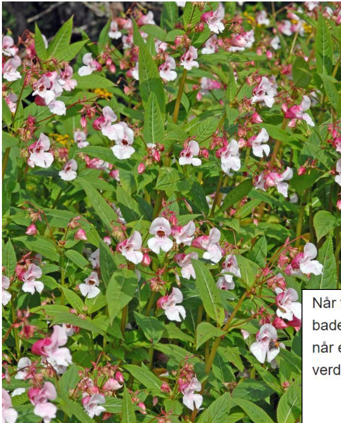
Foto: Kjempespringfrø.