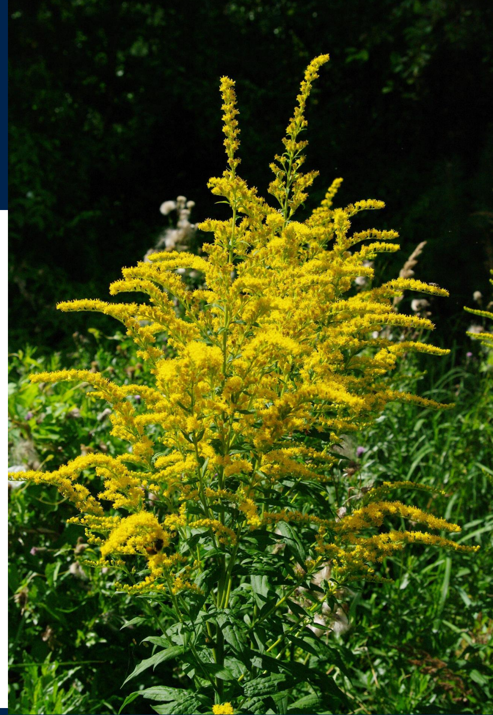
Kanadagullris.