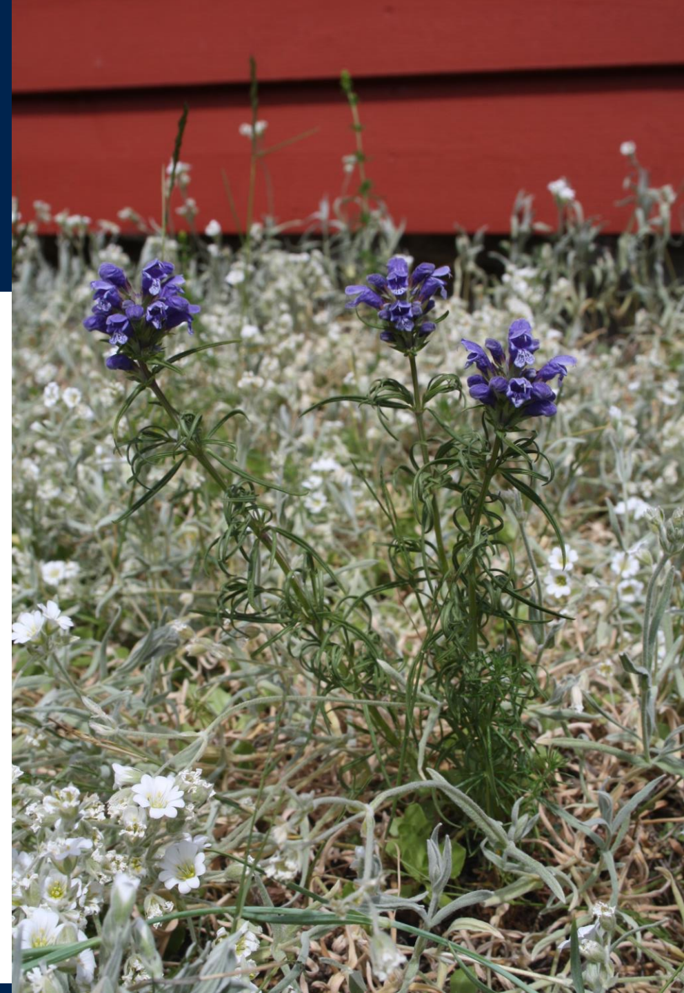
Foto: Dragehode omringet av sølvarve/filtarve på Nakholmen.