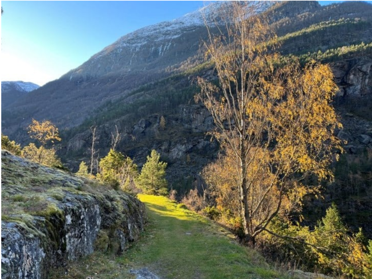
Figur 2 Kongevegen i Lærdal er eit levande kulturminne i stor bruk, og går gjennom det tilrådde Helleren naturreservat. Det er registrert så mange som 66 000 passeringar på ein sesong (2020), noko som syner den store verdien området har for både friluftsliv og reiseliv.

mest synlege anlegget. Steingardar ber minne etter tidlegare tidars utmarksslått, og midt i kandidatområdet ligg spor etter Glorhelleren, ein gamal husmannsplass frå 1700-talet.