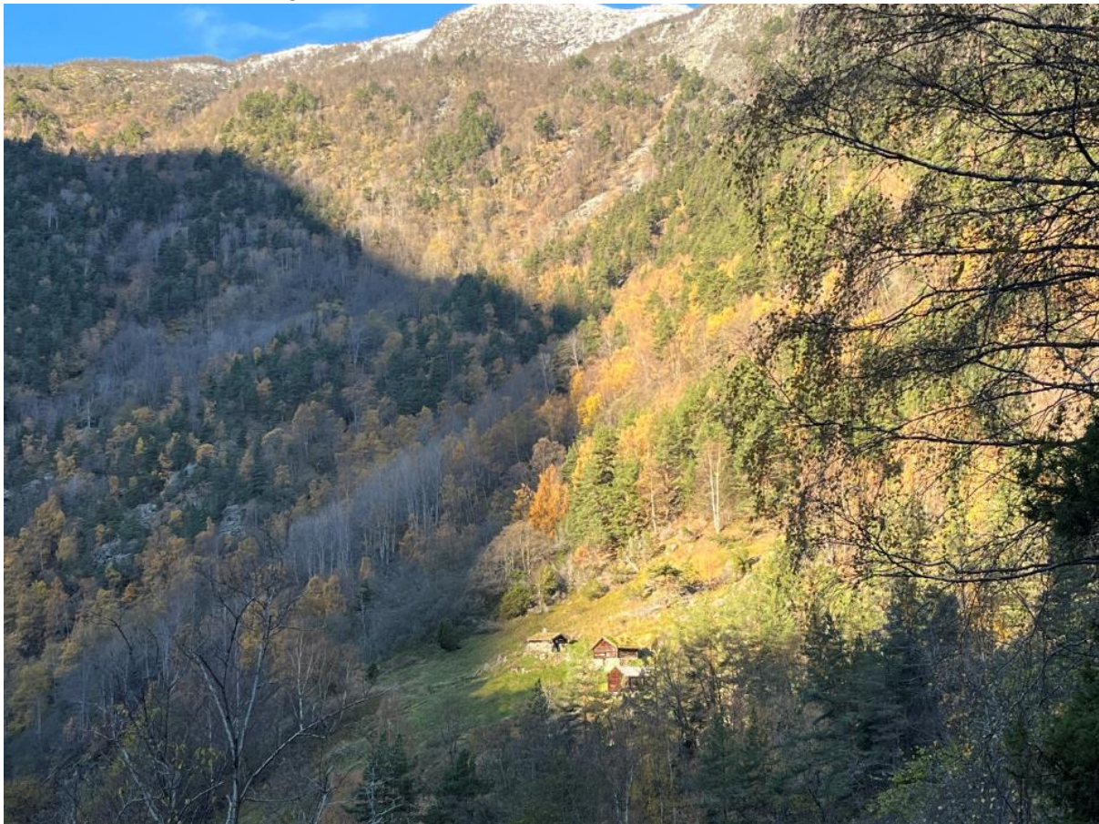
Figur 3 Biletet viser husmannsplassen Galdane som ligg rettt vest for det føreslegne verneområdet. Etter innspel frå Språkrådet gjekk vi bort i frå namnet Galdane for naturreservatet, og høyrte namnet Hellingen i staden. Det kom ikkje motførestillingar mot Hellingen i høyringa.

Blant gardane på nordsida av Lærdalselva er gardsnummer 1 den næraste nedom (vestanfor) gardsnummer 48. Språkrådet rådde oss difor å nytte namnet Nedre Øygarden naturreservat på verneforslaget i staden for Galdane. Til høyringa kom Språkrådet, etter at vi heller ville høyre namnet Hellingen enn Nedre Øygarden om området, med eit nytt innspel i verneprosessen. Språkrådet skriv at den usamansette namneforma, Hellingen , er registrert på fylkesatlas og namnet er ført opp med /"hædler*n/ som nedarva munnleg form, der namnet gjeld ein «[g]amal bustad». (Namneforma Glorhellingen er ikkje nemnt på offisielle kart.) Språkrådet skriv vidare at dei skjønar det slik at det ikkje finst andre kjende busetnadsnamn innanfor grensene til verneområdet og tilrår difor å la området få namn etter det gamle plassnamnet. Områdenamnet bør difor skrivast Hellingen naturreservat . I SSR er skrivemåten Hellingen registrert som eineform.