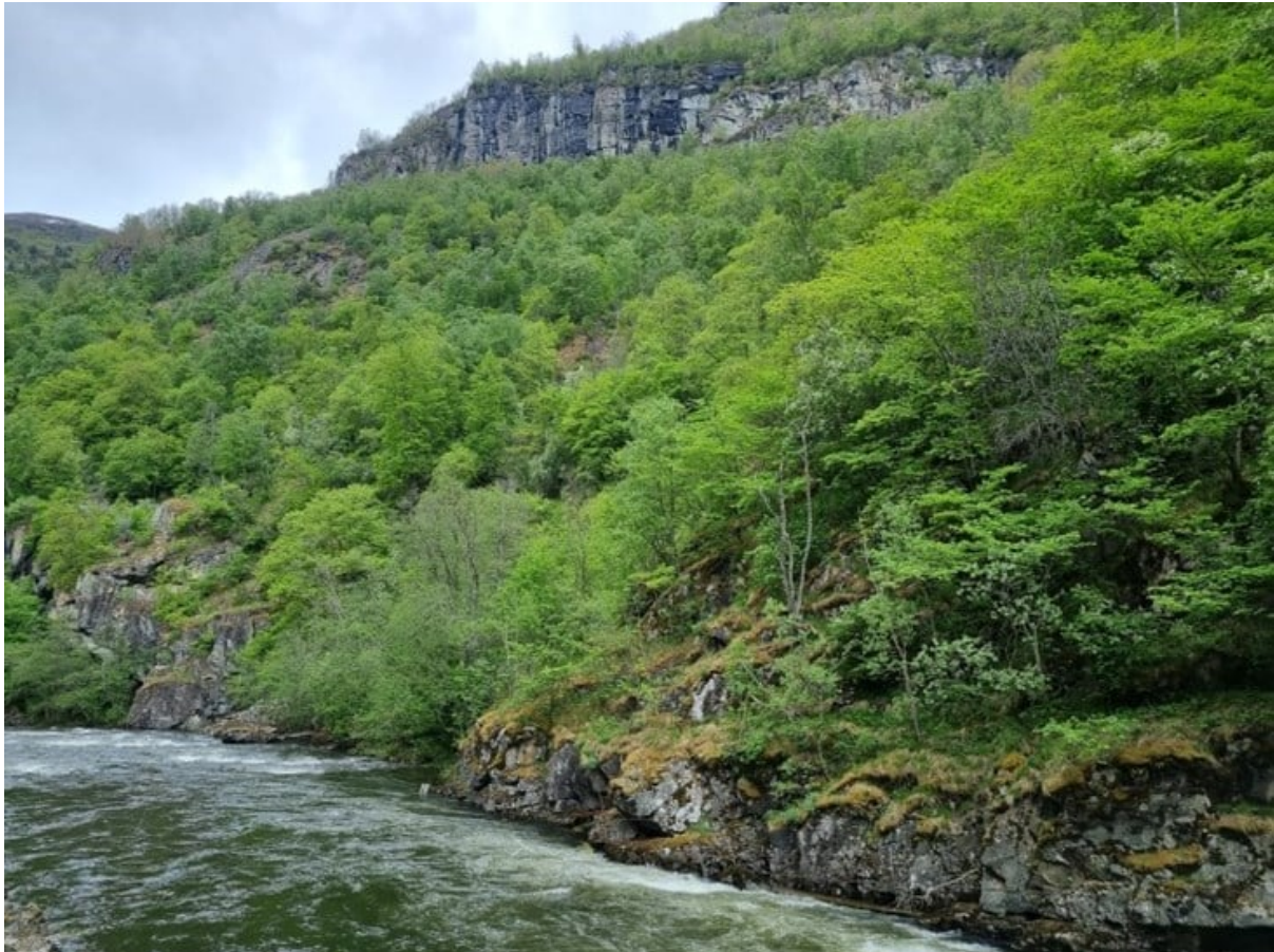
Figur 1 Galdane ligg på nordsida av Lærdalselvi i indre Sogn og husar mange varmekjære treslag. Det er registrert eit høgt tal raudlista artar i området som vi no tilrår til vern. Dette vil bidra til å ta vare på truga, sjeldne og sårbare artar for framtida.

økosystemtenester skogen gir. Vern av området vil bidra til langsiktig binding av karbon. Hellingen husar også gammal barskog i øvre delar, som ifølgje rapporten Skogvern som klimatiltak (NINA rapport 752) har det største karbonlageret per arealeining i levande biomasse. Etter figur 1 i den same rapporten blir den gjennomsnittlege karbonmengda i levande biomasse i skog som blir verna estimert til å vere om lag 70 tonn karbon per hektar. Verneverdiane på Hellingen er knytt til edellauskogen og dei varmekrevjande artane som trivst i slikt miljø, i tillegg husar området raudlista artar og har ei utforming som peiker mot bekkekløftmiljø. Hellingen naturreservat vil såleis kunne bidra til å fylle manglar i skogvernet, spesielt for edellauskog med affinitet til bekkekløftmiljø, samtidig vil området vil bidra til å bevare trua og nær trua artar og halde karbonlagre intakte for framtida.