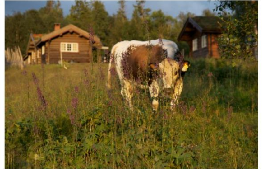
Sida trønder på Eggensetra.