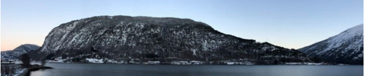
Figur 4 Grunneigarane langs Loftesnes og Hagalandet har tilbydd store delar av det bratte partiet på biletet til frivillig skogvern. Området strekk seg frå oversida av kraftlinja og opp mot fjellet. Kjørnes ligg på neset til høgre og bakover utanfor biletet.

visuelt ligg Kjørnes åtskilt frå det folk oppfattar som Loftesnes. Å bruke to stadnamn (Loftesnes og Kjørnes naturreservat) i namnsettinga av dette verneområdet kan også bli opplevd som litt langt og tungt å seie. Vi er difor ueinige med Språkrådet i deira innspel, og tilrår Loftesnes naturreservat som namn.