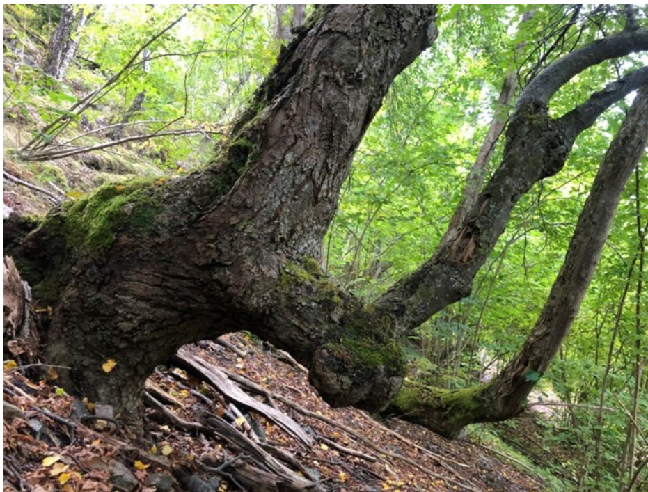
Figur 1 Lind er eit varmekjært edellauvtre og trivst berre i avgrensa, varme lommer i fylket. Vikingane brukte treet for å lage skjold grunna gode eigenskapar som låg vekt og fordi det er lett å skave i. Lind er ein viktig levestad for biomangfald og særleg insekt, - kanskje av same grunn?

Området har hatt namnet Loftesnes sidan starten av dialogen og grunneigarane støttar namnet. I oppstartsfasen tilrådde Språkrådet å endre namnet til Loftesnes og Kjørnes naturreservat. Vi tilrår likevel namnet Loftesnes naturreservat . Meir om dette under kapittelet Merknadar til verneforslaget.