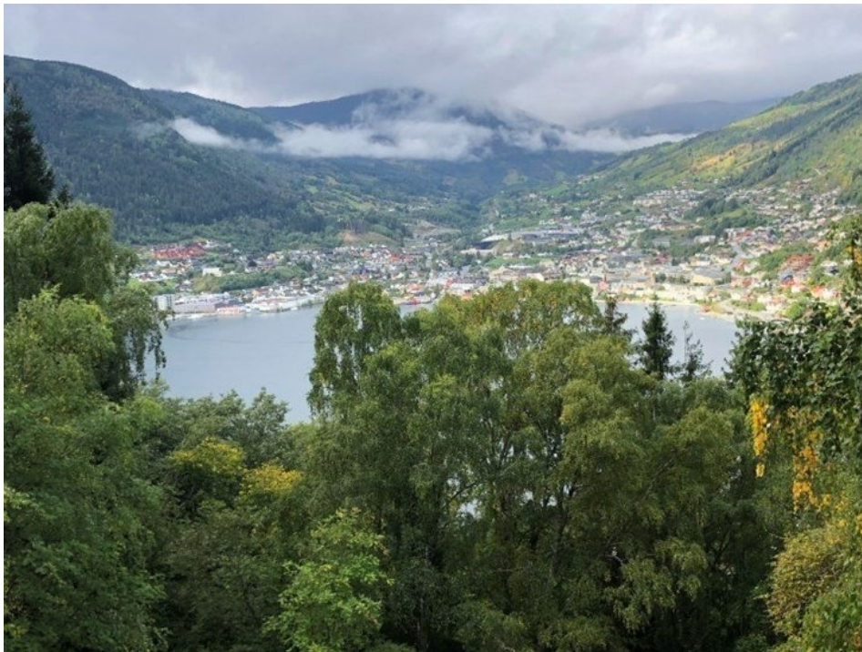
Figur 2 Loftesnes ligg eit steinkast frå Sogndal sentrum. Fordi det er så bratt er mindre areal i aktivt bruk i dag til jakt, beite og friluftsliv. Ein status som naturreservat vil ikkje redusere bruken av området til dette.

Det er ei lita jaktbu øvst på Loftesnesfjellet aust i tilbodsområdet. Hytta er nokre tiår gamal, har enkel standard og er mest i bruk om hausten under hjortejakta. Det vil være mogeleg å vedlikehalde hytta innafor forskrifta. Det er ein del hjort i dei tilgjengelege delane av Loftesnes, men ikkje meir enn at det er observert forynging av typiske beiteplantar som rogn, osp og selje. Det er aktiv hjortejakt på heile halvøya. Forskrifta opnar for å frakte ut jaktutbyte med beltegåande terrengkøyretøy, og jakt og fangst kan generelt fortsette uavhengig av eit vern.