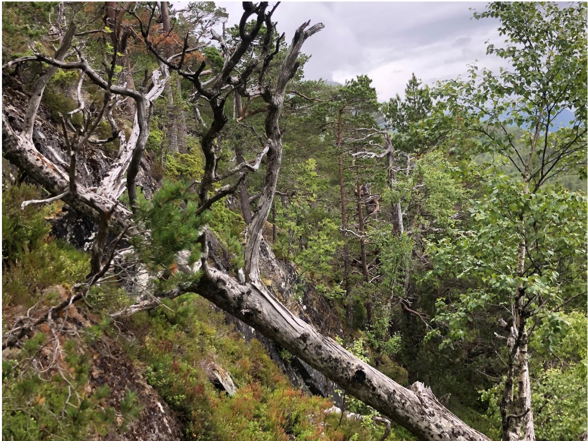
Figur 1 Det var mykje død ved i alle nedbrytingsfasar i Kudalen. Død ved er ein viktig indikator på kontinuitetsskog.

Det tilbydde området dekkjer heile gradienten frå fjord til fjell i midtre Nordfjord og ligg i ei varm li vendt mot sør- sørvest. Verneforslaget består av gammal furuskog med bjørk og osp. Mykje lungenever og hengelav er jamt fordelt i området som vart kartlagt. At området ligg i boreonemoral sone, delvis lokalisert i lågareliggjande område og har ein del areal på høgare bonitetar gjer i tillegg området relevant i vernesamanheng. Kudalen har regionale - nasjonale verneverdiar (2-3 stjerner). Rådgivende Biologer som kartla tilbodsarealet, vurderer tilbodsområdet til delvis å oppfylle manglar i skogvernet i Vestland. Statsforvaltaren var på synfaring i tilbodsarealet med grunneigar og biolog, og vurderer at det er verneverdig.