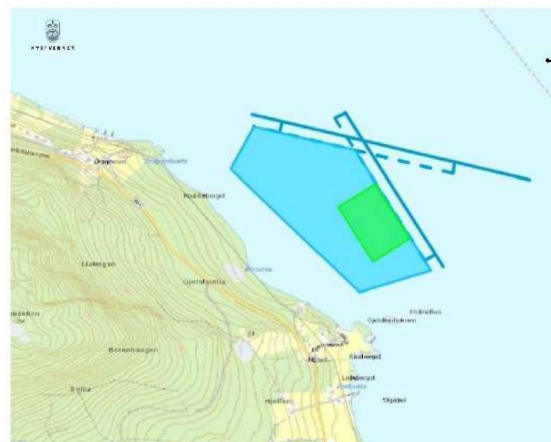
Bilde 2: blå ramme viser avsett areal til akvakulturføremål