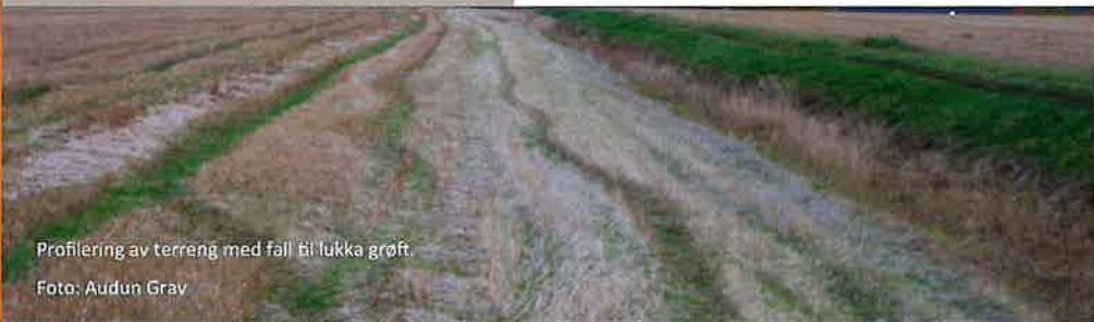
Profilering av terreng med fall til lukka grøft.