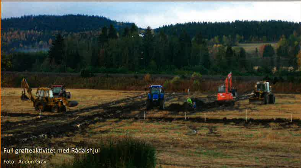
Full grøfteaktivitet med Rådalshjul

I påvente av at regelverket for tilskudd kommer, kan det være greit å se over jorda, og finne ut hva som bør gjøres.