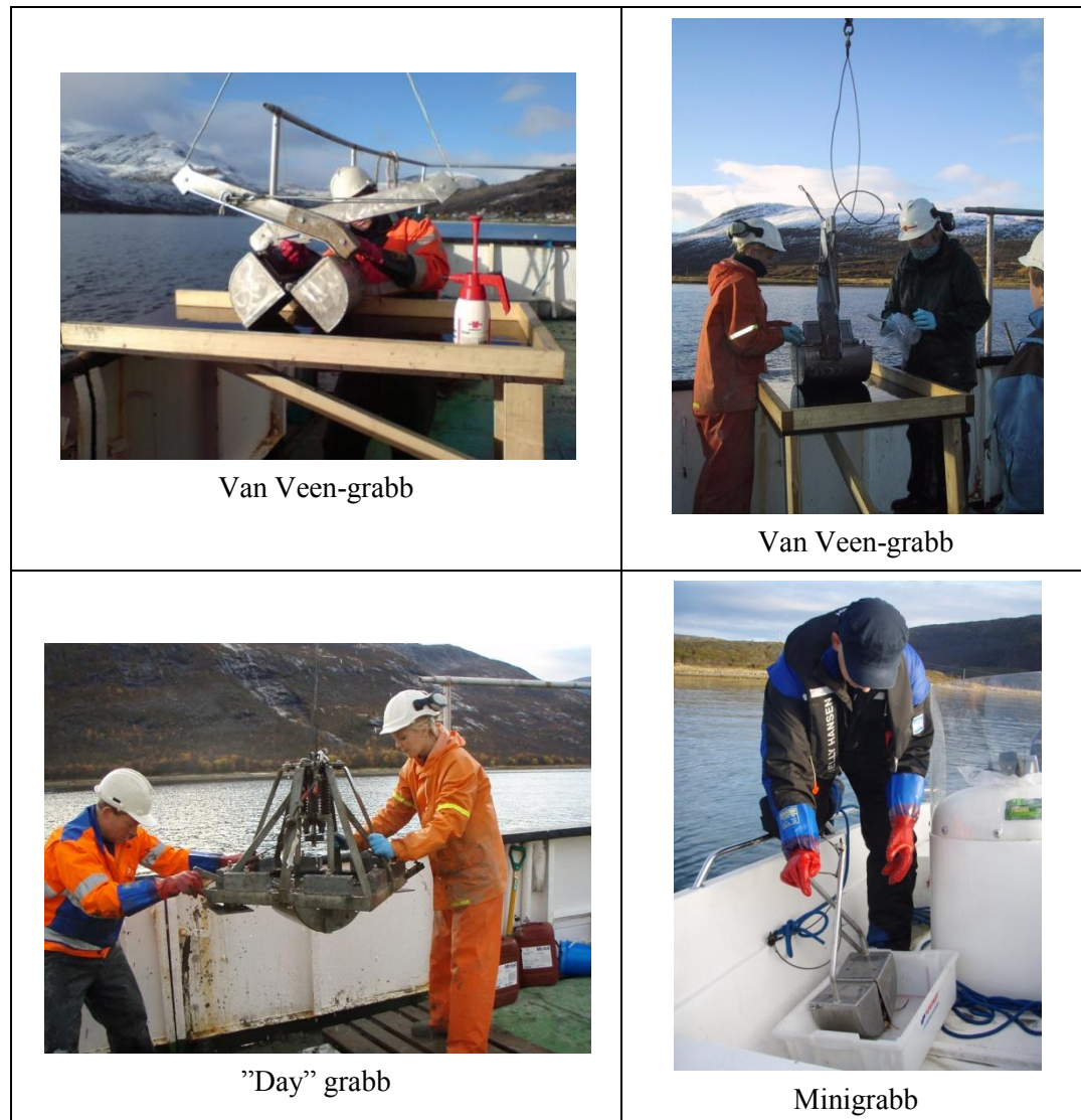
Figur 2 Standard van Veen-grabb med «inspeksjonsluker» hvor prøver blir tatt ut, «day» grabb på stativ og håndholdt minigrabb.

Multiconsult har flere standard van Veen-grabber og minigrabber i tillegg til en større grabb på stativ («day» grabb). Prøveinnsamling kan utføres med en av disse grabbene, avhengig av bunnforhold og tilgjengelighet for prosjektet. Grabbene er vist i figur 2.