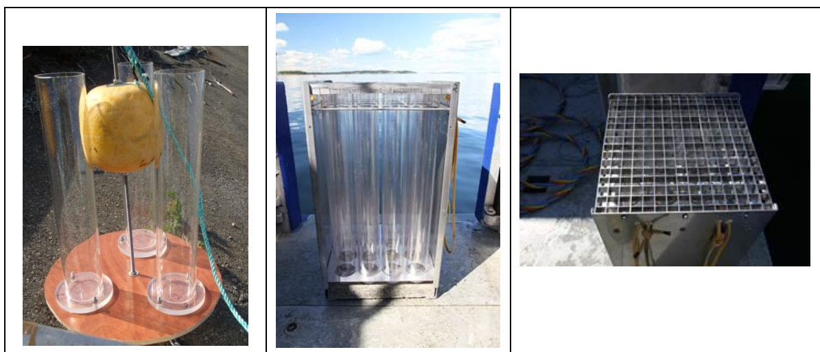
Figur 1 Eksempel på utforming av sedimentfeller. Bildet til venstre viser standard sedimentfelle som plasseres på bunnen eller i vannsøylen. Bildet i midten viser større sedimentfeller for plassering på bunn og detalj som viser åpning med strømdemper er vist i bildet til høyre.

Sedimentfeller benyttes til innsamling av partikler som sedimenterer ut fra vannmassene (figur 1). Disse kan plasseres på bunnen eller i definerte nivå i vannsøylen. Ved uttak av sedimentert materiale fra fellene blir fritt vann over prøven (sedimentene) forsiktig dekantert ut før prøven blir overført til rengjorte og forbehandlede beholdere i tråd med planlagt analyseprogram. Eventuelt benyttes destillert vann eller sjøvann fra lokaliteten for å skylle ut alt prøvematerialet.